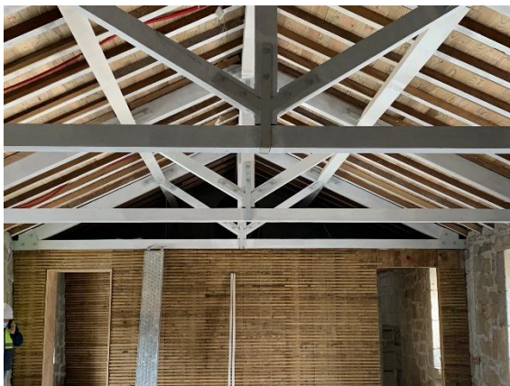
Figura 3 - obra de reabilitação