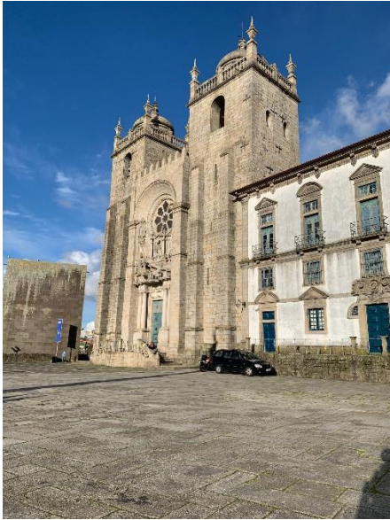
Figura 9 - Sé do Porto num sábado (durante o Estado de Emergência)

Ao viver nesta cidade aprendi que vale a pena ter sempre um guarda-chuva por perto e ver a previsão do tempo antes de sair de casa, pois o dia pode começar ensolarado e terminar com chuva.