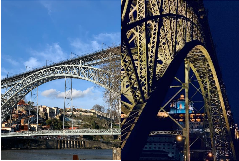
Figura 5 - Ponte Luís I

Assim, existe a minha experiência nesta cidade antes do desconfinamento e depois do desconfinamento. O período em que estávamos todos confinados, proporcionou-me longas horas de introspecção, caminhadas pela cidade vazia e visitas à obras de arquitectura.