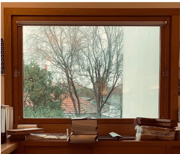
Figura 1. vista pela janela a partir da minha secretária

No dia 18 de Janeiro comecei o estágio. Lembro-me de estar inquieta, pois não fazia ideia de como era a dinâmica do atelier, mas imaginava que seria enorme, com muitos trabalhadores e, por isso, com um ritmo frenético. Para minha surpresa, deparei-me com um espaço com escala ideal para este atelier e que nos proporciona conforto e privacidade.