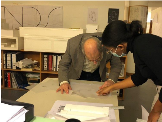
Figura 4 - conversa com o arq. Álvaro Siza

Tive a oportunidade de trabalhar lado a lado com o arquitecto Álvaro Siza, que se mostrou disponível sempre que precisei, para solucionar as minhas dúvidas e passar o seu intangível conhecimento. Esta foi sem dúvida uma experiência única, especial e que marcará a minha trajetória profissional.