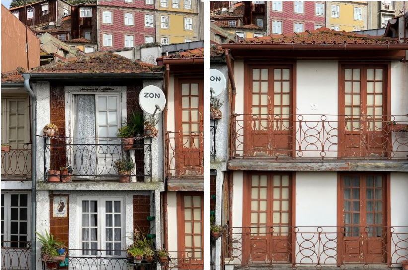
Figura 11 – arquitetura local