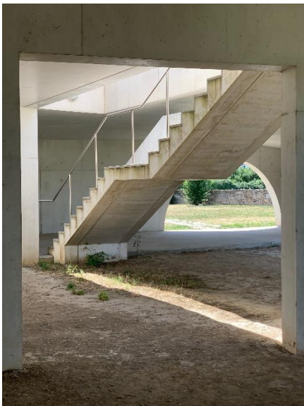
Figura 6 - Museu Nadir Afonso, Chaves

Assim, existe a minha experiência nesta cidade antes do desconfinamento e depois do desconfinamento. O período em que estávamos todos confinados, proporcionou-me longas horas de introspecção, caminhadas pela cidade vazia e visitas à obras de arquitectura.