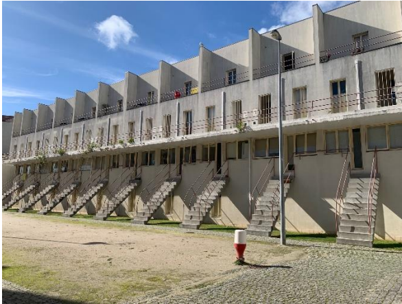
Figura 7 - Bairro da Bouça, Porto

A diferença entre o espaço vazio e o mesmo espaço movimentado e preenchido de pessoas é absurda. Até Abril, as praças eram silenciosas, ouvia-se apenas o eco de algumas vozes de pessoas que ali passavam. Por viver na Ribeira do Porto (zona turística, com imensos restaurantes), esta comparação entre os períodos antes e depois do desconfinamento acentuava-se. Várias vezes percorri a Rua das Flores (rua de lojas, comércio, cafés) a pé e ver tudo fechado, deserto, parecia enorme a rua, sem fim. Hoje, na mesma rua, existe um zumbido permanente de vozes, turistas, música, conversas. A mesma rua hoje parece pequena.