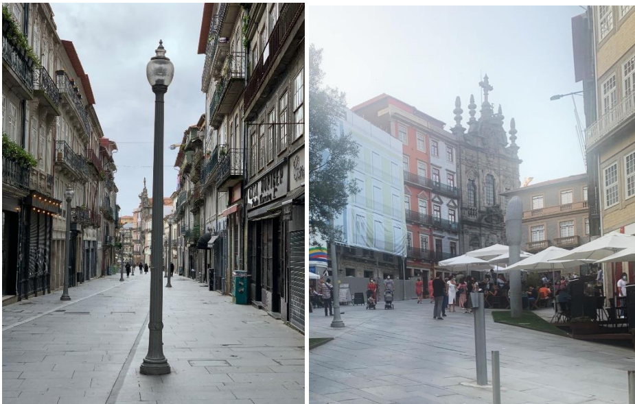
Figura 8 – à esquerda, a Rua das Flores num sábado (durante o Estado de Emergência, com as lojas fechadas); à direita, a mesma rua após os restaurantes abrirem

A diferença entre o espaço vazio e o mesmo espaço movimentado e preenchido de pessoas é absurda. Até Abril, as praças eram silenciosas, ouvia-se apenas o eco de algumas vozes de pessoas que ali passavam. Por viver na Ribeira do Porto (zona turística, com imensos restaurantes), esta comparação entre os períodos antes e depois do desconfinamento acentuava-se. Várias vezes percorri a Rua das Flores (rua de lojas, comércio, cafés) a pé e ver tudo fechado, deserto, parecia enorme a rua, sem fim. Hoje, na mesma rua, existe um zumbido permanente de vozes, turistas, música, conversas. A mesma rua hoje parece pequena.