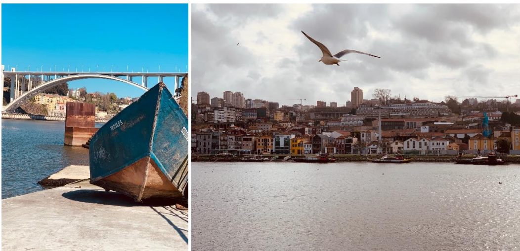
Figura 10 – à esquerda, ponte da Arrábida sobre o rio Douro; à direita, vista para Gaia.

Os passeios matinais pelo Porto tornaram-se rotina. A escala da cidade permite-nos facilmente andar a pé ou de bicicleta (mas, é necessário estar preparado para as grandes subidas e desníveis naturais do terreno) e é esta escala que nos deixa completamente rendidos pela cidade, tal como o rio e as suas “mil” pontes; a comida; as pessoas; a praia; parece o cenário perfeito para viver.