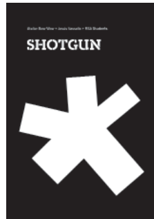
Atelier Bow-Wow et al. Shotgun Rice University, Houston, 2015 159 páginas; 20 dólares