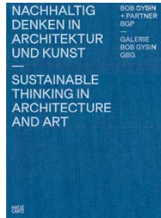
Bob Gysin + Partner Sustainable Thinking... Hatje Cantz, Ostfildern, 2015 400 páginas; 58 euros

THE ARCHITECTURAL type can be found in cultured sources, but also in vernacular models of uncertain origin but perfectly adapted to the climate. This is the case of the best of popular architecture, in which many have seen an alternative to modern schemes. This book presents the investigations of Atelier Bow-Wow, Jesús Vassallo, and a team of Rice University students on a vernacular model: the so-called shotgun house, with its pitched roof and narrow succession of rooms. Based on a field study, the research led to contemporary remakes of the original type, and an installation inspired in the shotgun houses that was shown at the Rice Gallery in 2015 and is now immortalized in this book.