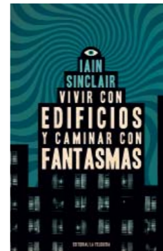
Iain Sinclair Vivir con edificios y caminar... La Felguera, Madrid, 2023 256 páginas; 23 euros

AN ARCHITECT and urbanist who made his first foray into literature at 62 now offers a second novel, a slow-motion apocalypse where the dream of a better future almost unnoticeably dissolves in a day-to-day existence made of lethargy, emptiness, amnesia. Pecoraro describes it from the viewpoint of a dispassionate onlooker who, from his unit in an apartment bloc amid suburban squalor, scans the City of God, a decadent modern metropolis which, though presented as an allegory, is a portrait of our smug, ugly, vacuous way of life, and of an urb that behind the remains of indolent planning hides traces of the natural and mysterious beauty we will never be able to get back.