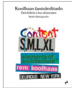
Belén Butragueño Koolhaas (auto)editado Ed. Asimétricas, Madrid, 2023 176 páginas; 24 euros

FOR NORDIC architects the Mediterranean was a promised land of sorts, and that is what Nordic architecture has been for some Spanish architects. In the same way that the likes of Asplund and Lewerentz traveled down from their ‘hyperboreal’ regions to discover in Italy a classicism that felt strangely familiar, many architects of Europe's south unexpectedly found themselves akin to the tenuous light and intense materiality of the best of Scandinavian architecture. This is the starting point of a publication that gives voice to authors who for different reasons feel close to Nordic tradition, from Ángela García de Paredes to José Ignacio Linazasoro. Each writes an ‘ode to the North.’