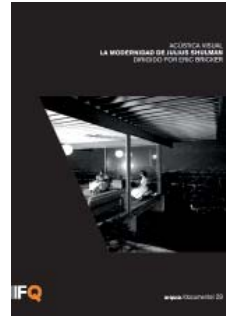
Eric Bricker (director) La modernidad de Julius Shulman F. Caja de Arquitectos, Barcelona, 2013 DVD 83'; 18 euros

DIVERGING FROM THE procedure of past editions, the 12th Spanish Biennial of Architecture and Urban Planning has awarded 15 works grouped in 5 families: reconversion and reuse; territory and landscape; urban revitalization and transformation; participative and social action; and 'civic symbols'. The variety of designs echoes the plurality of generations and perspectives, which reflects the transformation the discipline is undergoing in Spain. Titled like the Biennial motto, Inflexión / Turning Point , the catalog of the exhibition presents the 15 winners and 27 finalists, besides a selection of final-year school projects, and can be downloaded in pdf form at www.fundacion.arquia.es