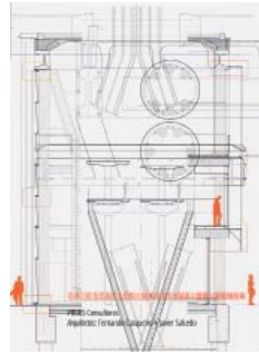
F. Casqueiro y J. Salcedo La estación marítima de Denia Mairea, Madrid, 2013 145 páginas; 15 euros

Denia se comunica con las Islas Baleares mediante fast-ferries de última generación, artefactos de 180 metros de eslora y 30.000 toneladas de peso que se desplazan a una velocidad de 30 nudos y son capaces de transportar 1.500 pasajeros y 300 metros lineales de camiones. Como los fast-ferries que atracan en ella, la nueva dársena de Denia —proyectada por Fernando Casqueiro y Javier Salcedo— es también un edificio extremo desde el punto de vista tecnológico, y su construcción se ha llevado a cabo desde un enfoque que es a la vez mecánico y termodinámico. Esta perspectiva inspira las 145 páginas del libro que describe la terminal mediante fotografías y abundantes detalles constructivos, acompañados de varios ensayos de la mano de Antonio Miranda, los ingenieros consultores del proyecto y los propios arquitectos.