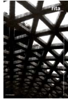
rita_ rita_ no. 1 Redfundamentos, Madrid, 2013 136 páginas; 30 euros