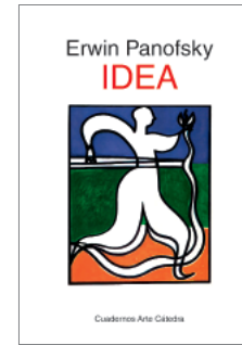
Erwin Panofsky Idea Cátedra, Madrid, 2013 278 páginas; 18 euros

THE GYNECOLOGIST Fritz Kahn was known for his extraordinary books for wide readerships, published in Germany and the USA in 1920–1950. His genius lay in his way of explaining scientific concepts through illustrations rendered by a team of painters, designers, and architects. Mechanical metaphors were used to describe the physiology and metabolism of the human body: the shaft for the spinal column, the connecting rod for the leg, the industrial palace for the entire human anatomy. A Taschen edition gives us this graphic adventure with a look, too, at the life of the Berlin Jew who had to leave Germany in 1933, when the Nazis prohibited, confiscated, and burned his splendid books.