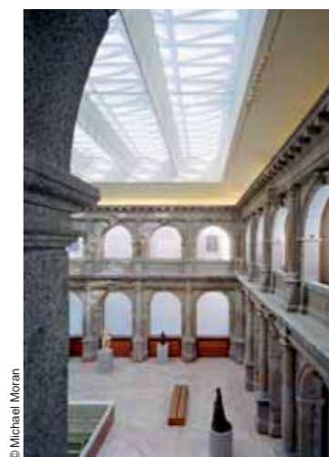
© Michael Moran Prado Museum extension, Madrid (1996-07)