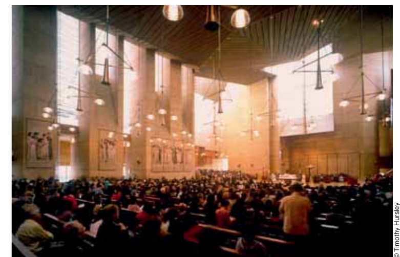
© Timothy Hursley Catedral de Nuestra Señora Our Lady of the Angels Cathedral, Los Angeles (1996-02)