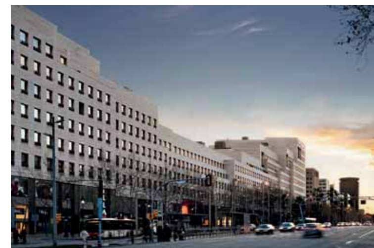
Edificio L'Illa Diagonal L'Illa Diagonal building, Barcelona (1987-93)

successes, from the Beirut Souks to Columbia University, could also be a prophet in his own land; and a special meaning can also be seen in the Iesu parish church in San Sebastián, a lyrical space built with light and financed by the supermarket housed under it, uniting the sacred with the profane as in Los Angeles, and which wraps up this itinerary in the city where it began. Rafael Moneo received the news of his winning the Prince of Asturias Award for the Arts the day he turned 75, and this latest coincidence is a good provisional finale for an extraordinarily brilliant professional and intellectual career, surely the most outstanding of the last Spanish half-century.