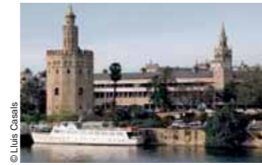
Previsión Española headquarters, Seville (1982-87)