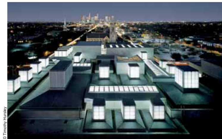
© Timothy Hursley Museum of Fine Arts, Houston (1992-20)

Houston – his first American works, two cubes topped with skylights at the service of art –, but in 1990–91 he executed three buildings in Europe which masterfully expressed the tension between respect and rupture when constructing in geographical or urban landscapes: the Kursaal of San Sebastián is an auditorium and convention center that can be described through the metaphor provided by the architect himself, two rocks stuck on the beach with a crystalline geometry belonging more to the accidental coast than to the grid of the regular city; the Moderna Museet and Arkitekturmuseet of Stockholm blend into the horizontal landscape and