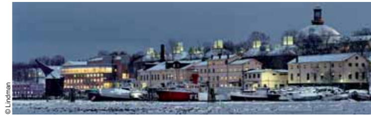
Museos de Arte Moderno y Arquitectura Modern Art and Architecture Museums, Stockholm (1991-98)

dos; no menor trascendencia tendría la ampliación del Museo del Prado, iniciada en la misma fecha, y que vendría a completar una extraordinaria secuencia de intervenciones a lo largo del eje Prado-Castellana, de la sede de Bankinter a la estación de Atocha, e incluyendo el Museo Thyssen y la ampliación del Banco de España —un proyecto de admirable subordinación a lo existente, ganado en concurso en 1978 y completado sólo en 2006—, para mostrar que el Moneo de los éxitos internacionales, del Zoco de Beirut a la Universidad de Columbia, podía también ser profeta en su tierra; y especial significado cabe también atribuir a la parroquia Iesu en San Sebastián, un espacio lírico construido con luz y financiado con el supermercado que se aloja bajo él, reuniendo como en Los Ángeles lo sagrado y lo profano, y que cierra este itinerario en la misma ciudad donde se inició. Rafael Moneo recibió la noticia de la concesión del Premio Príncipe de Asturias de las Artes —que había antes distinguido a su mentor Sáenz de Oíza— el mismo día que cumplió 75 años, y esta última coincidencia es un buen colofón provisional para una carrera de extraordinaria brillantez profesional e intelectual, seguramente la más destacada del último medio siglo español.