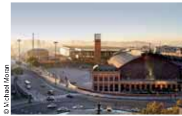
Atocha train station, Madrid (1984-92)

THE INTELLECTUAL influence of an engineer-father and the Jesuits of Tudela forged the early personality of this native of Navarre who ran the bulls at the San Fermín festival while preparing for admission into the Madrid School of Architecture. There Alejandro de la Sota showed him the abstraction of Mies van der Rohe, but it was the organicism of Frank Lloyd Wright and Alvar Aalto that he took to, and the young student trained for three years in the studio of Francisco Javier Sáenz de Oíza. After earning his degree, a year in the Danish studio of Jørn Utzon (then struggling with the construction of the Sydney Opera House) and two in the Spanish Academy in Rome gave his architectural training an unmistakable classical and Scandinavian patina that would soon come in tune with the theoretical influence of Aldo Rossi and Robert Venturi.