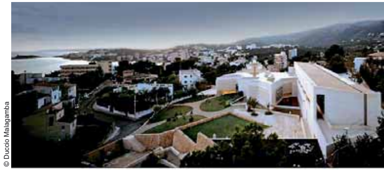
Pilar and Joan Miró Foundation, Palma de Mallorca (1987-92)

en Harvard el papel que en su día correspondió a arquitectos europeos de la talla de Walter Gropius o Josep Lluís Sert, y desde 1985 hasta 1990 —trasladado a Cambridge con su familia— será Chairman de Arquitectura en la Graduate School of Design.