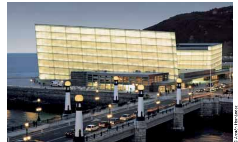
© Anxón Hernández Kursaal auditorium, San Sebastián (1990-99)

In 1996 the architect won the Pritzker Prize, and the awarding ceremony in Los Angeles happily coincided with his appointment to design the city's Catholic cathedral, a commission of