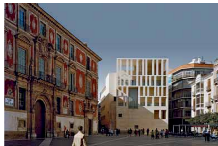
Ampliación del Ayuntamiento de Murcia City Hall extension, Murcia (1991-98)