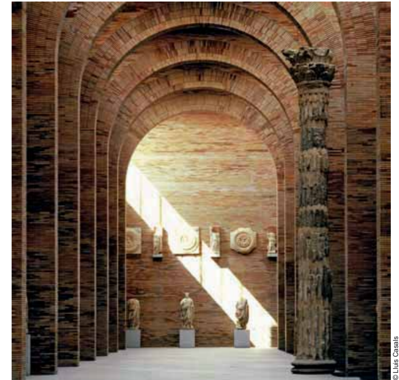
National Museum of Roman Art, Mérida (1980-86)