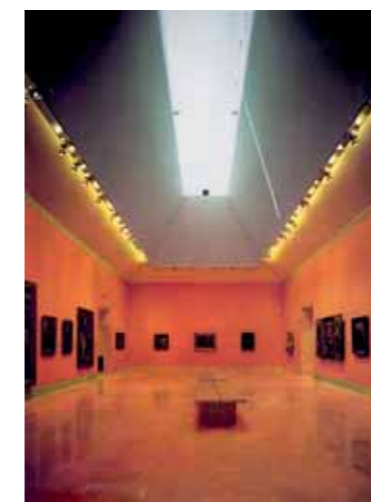
Thyssen-Bornemisza Museum, Madrid (1989-92)