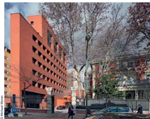
Sede de Bankinter Bankinter headquarters, Madrid (1972-76)