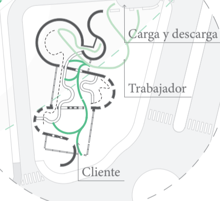
Diagrama de circulaciones. El movimiento también es un parásito.

Nido de guardia 24h Nido medicamentos Conexión entre nidos a través del parásito Nido óptica Nido farmacia