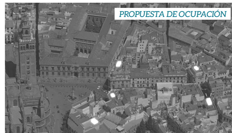
PROPUESTA DE OCUPACIÓN