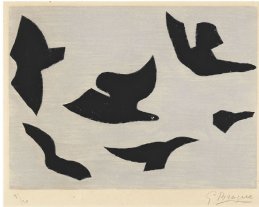
L'ordre des oiseaux Georges Braque