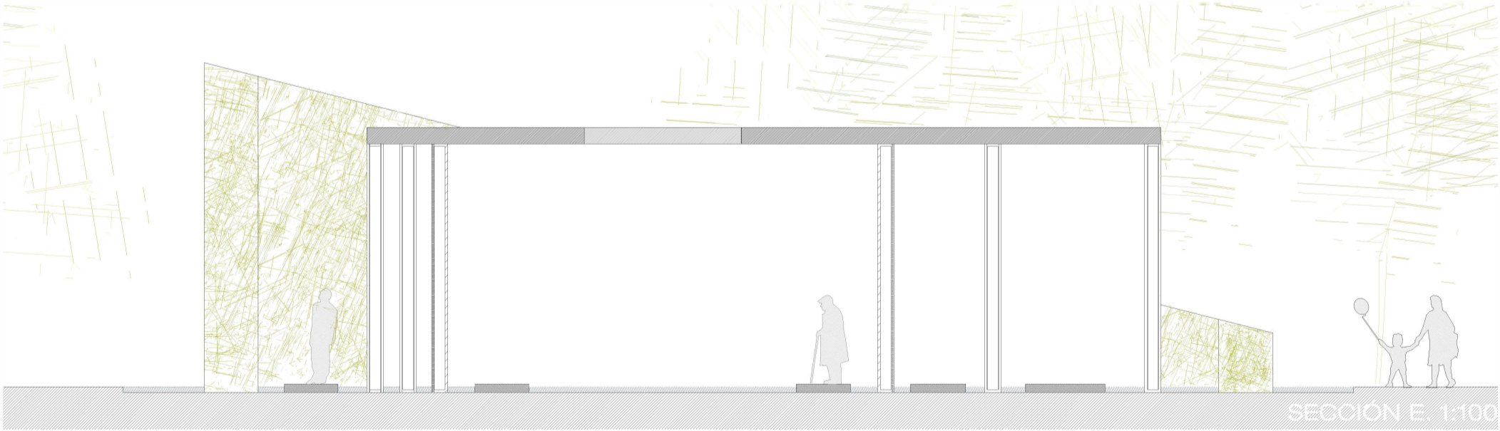
SECCIÓN E. 1:100