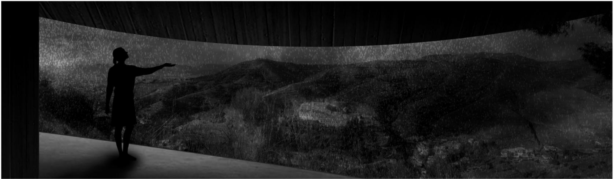
Perspectiva desde el interior del cobijo

La Alhambra, antigua ciudad palatina de origen defensivo, deviene su nombre del color de la tierra con la que se erigió: "LA ROJA". Esta tierra, sigue teñiendo de "colorao" las colinas de la Sabika y, más arriba, las de la Dehesa del Generalife.