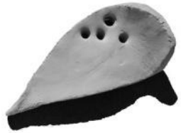
Maqueta de cubierta