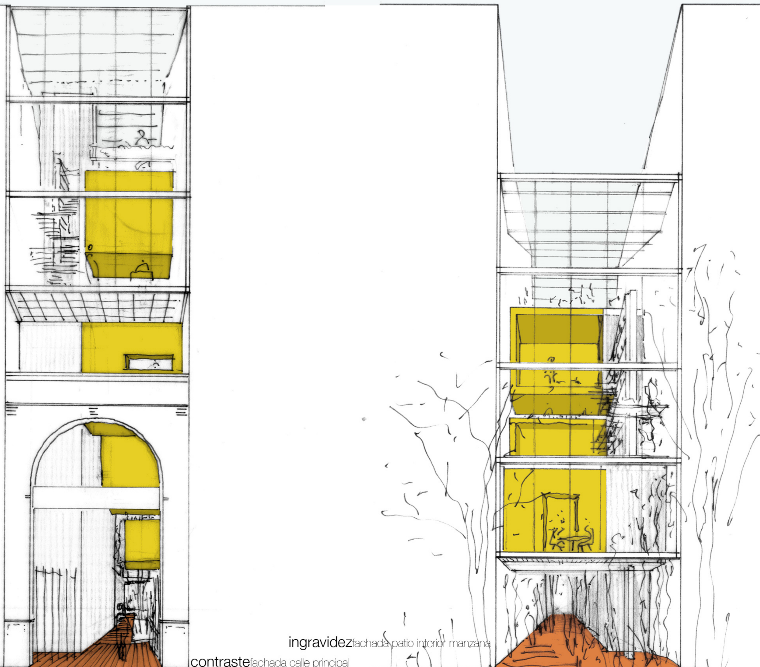
ingravedad fachada patio interior manzana

El proyecto mantiene el vacío existente mediante la construcción fragmentada a la vez que pretende irradiar la actividad por todo el espacio.