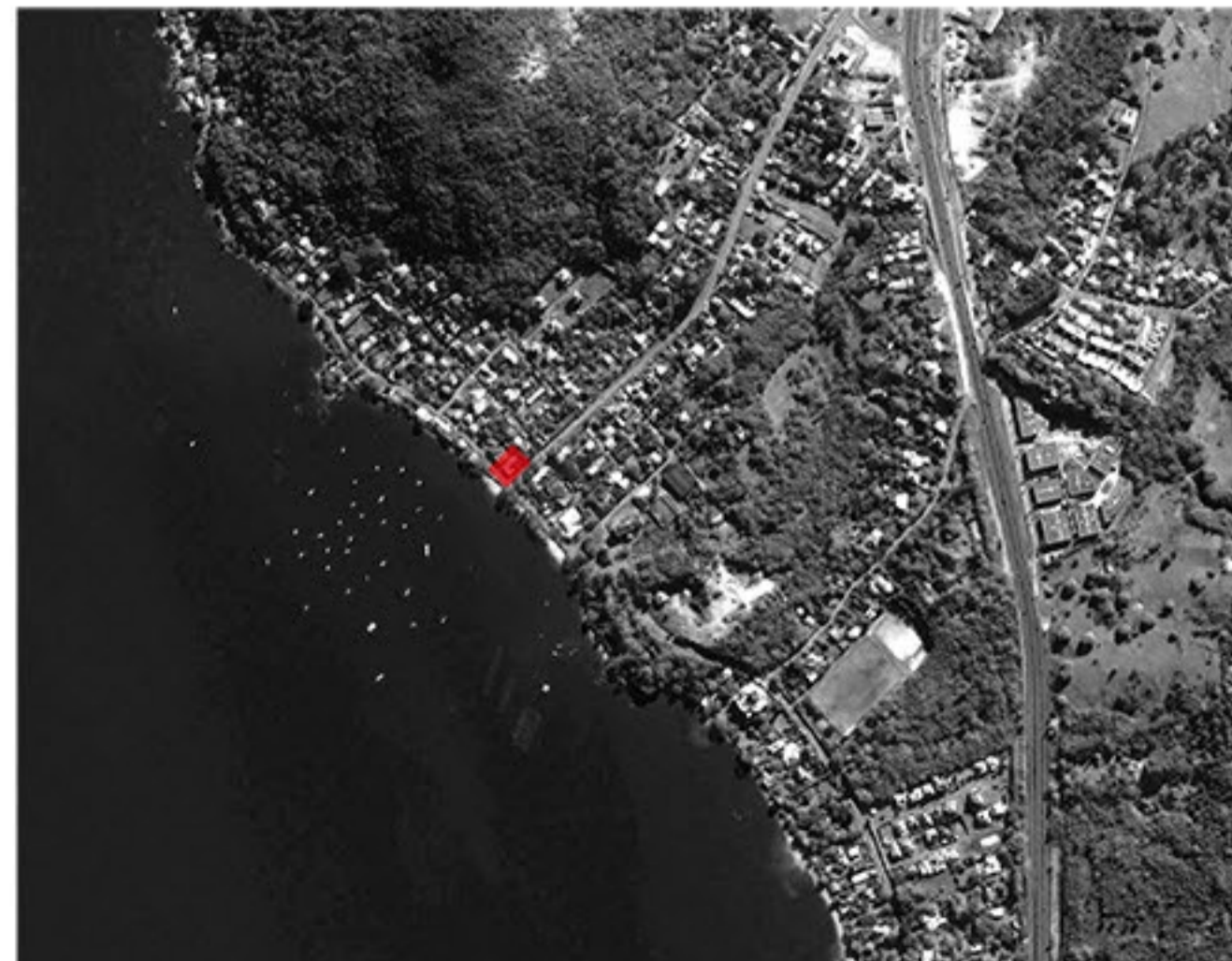
SANTO ANTÔNIO DE LISBOA | FLORIANÓPOLIS | BRASIL

La estrategia de criar un espacio de transición para mejorar el contacto directo con la calle fue una fuerza motriz de como se ha desarrollado el proyecto, una solución simple y eficiente para lograr una mejor seguridad y una nueva perspectiva de sentidos. También se destaca la azotea con una de las vistas y puesta del sol más increíbles de la isla. Con muy poca intervención, se logró un resultado muy satisfactorio, donde se ha hecho una propuesta exequible y sólida. Una casa discreta, pero rica en confort y generosa en todos sus sentidos, y ubicada en un sitio exuberante.