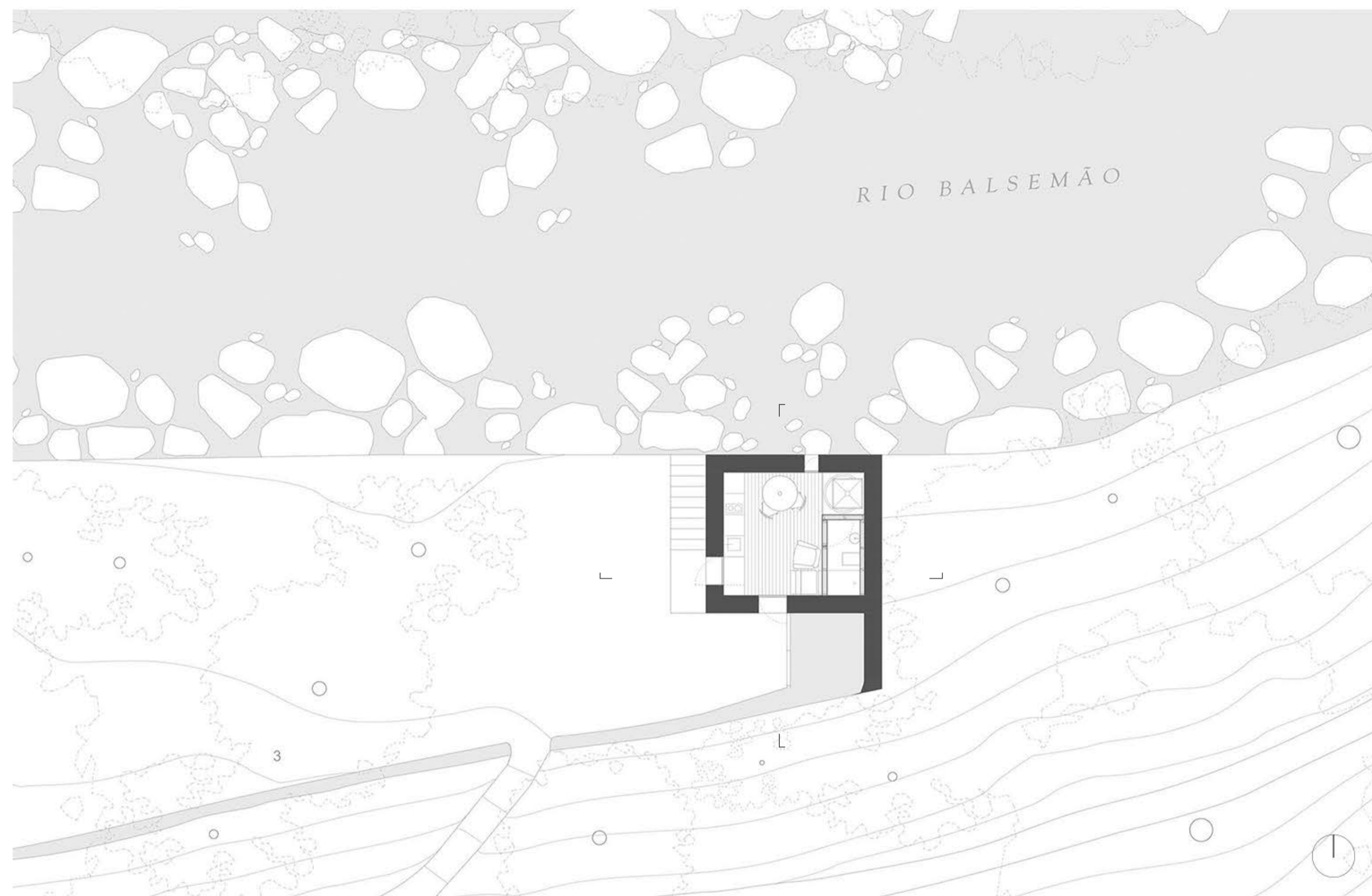
Planta de Implantação | Escala 1.100