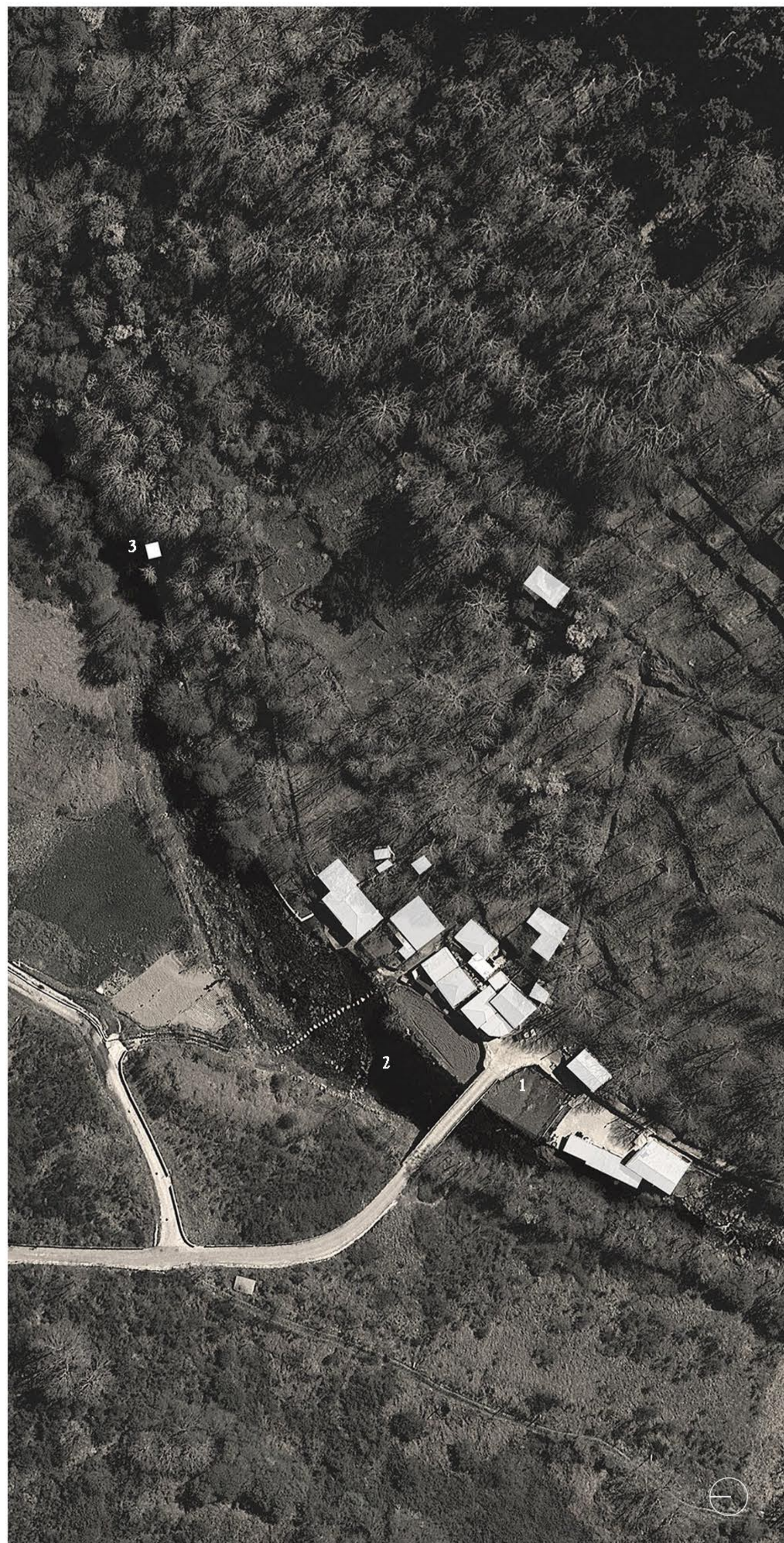
Planta de Inserção Urbana | Escala 1.1000