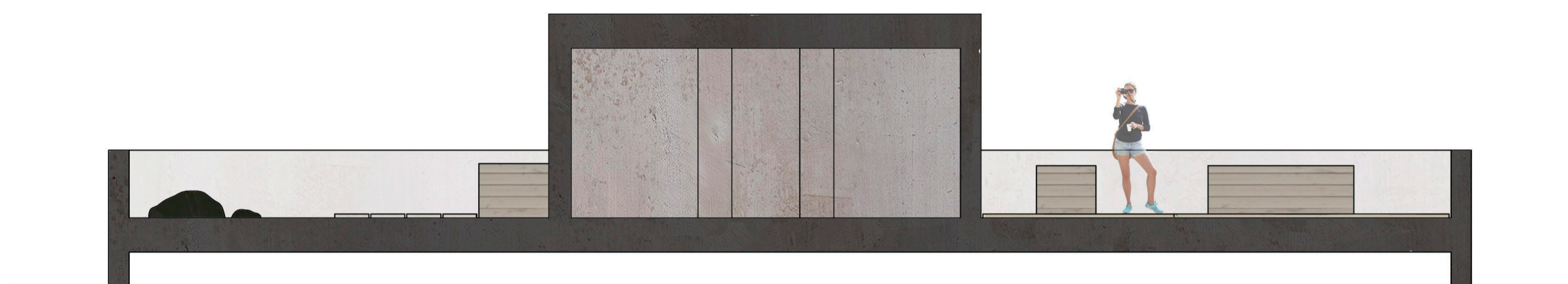
SECCIÓN A-A' E:1/100