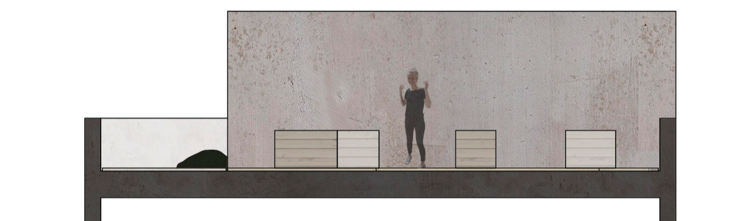
SECCIÓN B-B' E:1/100