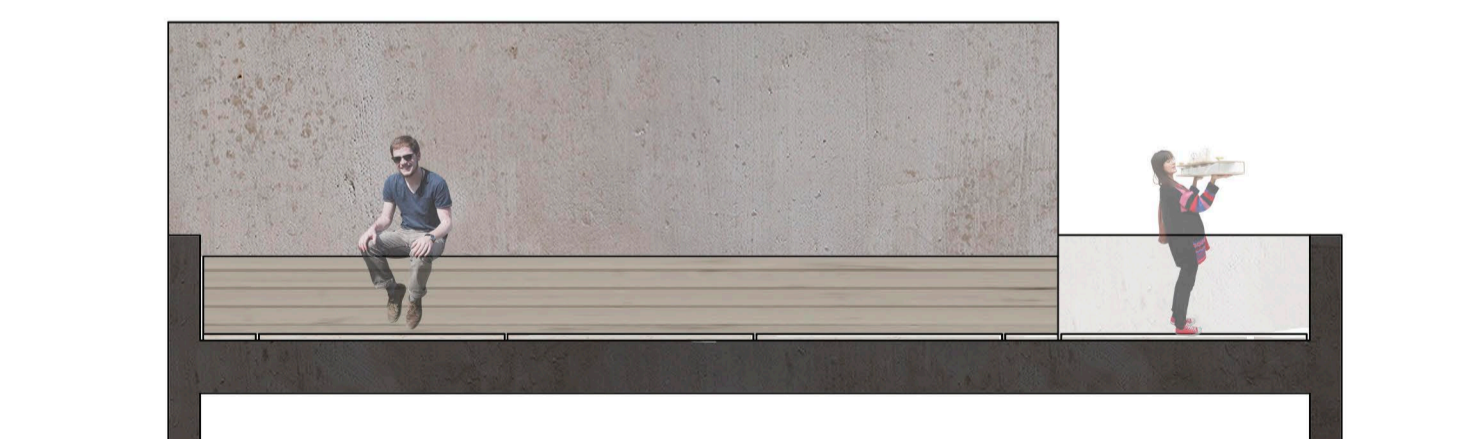
SECCIÓN C-C' E:1/100