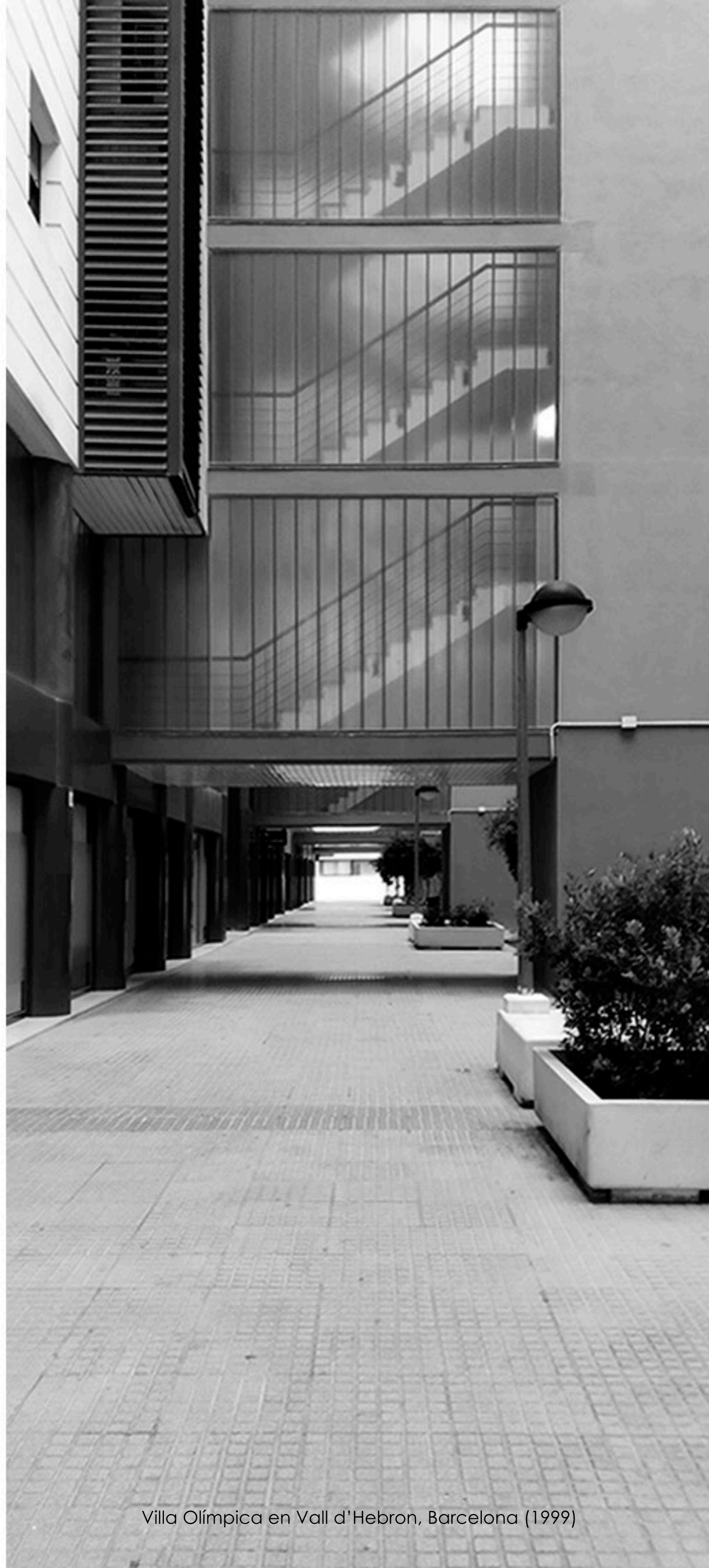
Villa Olímpica en Vall d'Hebron, Barcelona (1999)