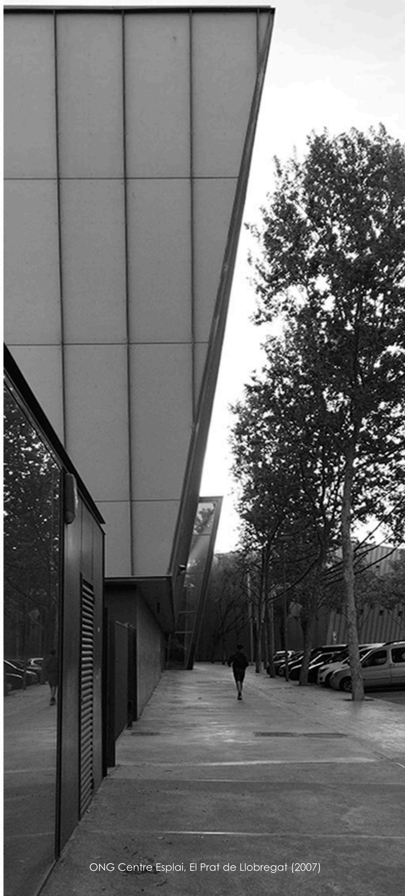
ONG Centre Esplai, El Prat de Llobregat (2007)