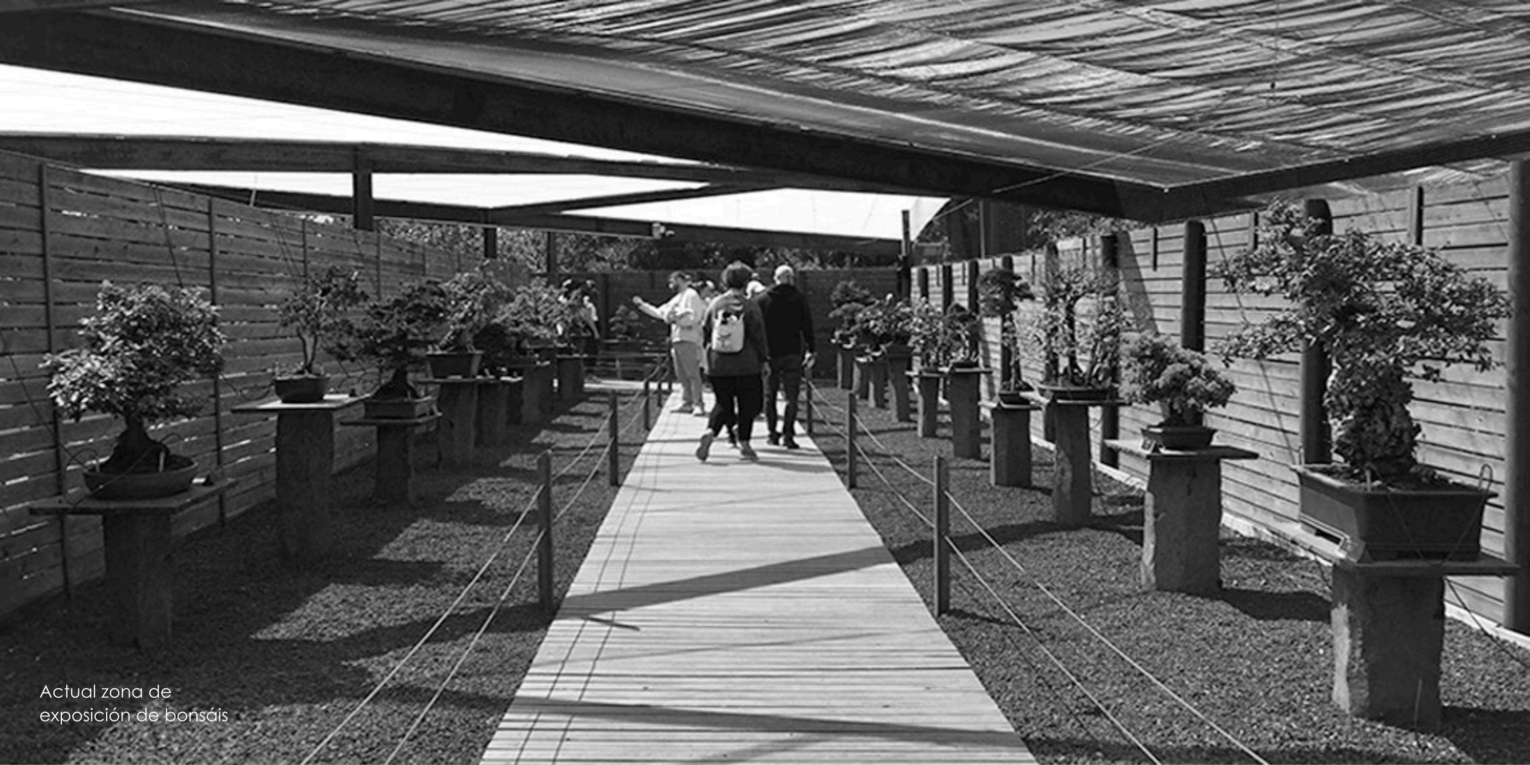
Actual zona de exposición de bonsáis