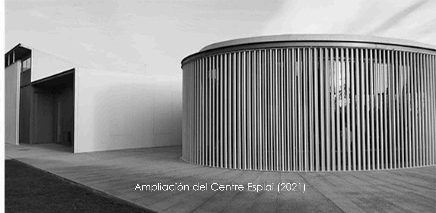
Ampliación del Centre Esplai (2021)