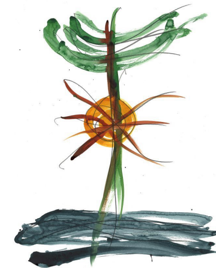
Acuarela ejercicio La Sagrada Familia en la Barcelona actual

Es una suerte haber podido abordar el proyecto con este equipo. Es muy especial la amistad que se construye durante esos días, y siendo perfiles tan variados, es sorprendente ver cómo cada uno tiene cosas valiosas que ofrecer y cosas que aprender del resto. Admiro y aprecio mucho a todos ellos y estoy muy agradecida de lo que he aprendido de cada uno.