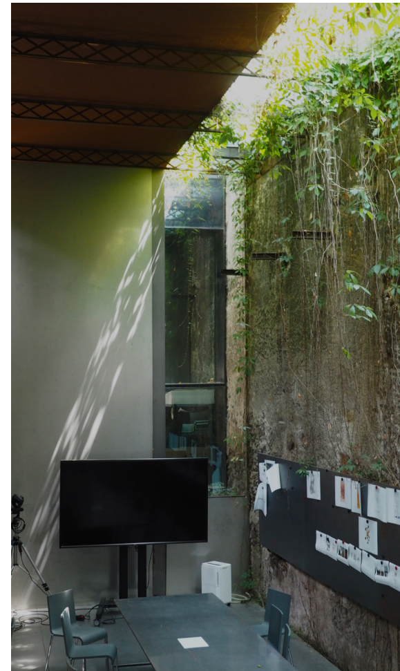
El Pabellón de los Sueños

Por otro lado, me quedo con las amistades de esas semanas que serán para siempre. También con la energía que transmiten todos ellos: el ímpetu, las ganas y la implicación. Es sin duda la actitud que me quiero llevar de aquí para aplicar tanto a mi vida personal como profesional.