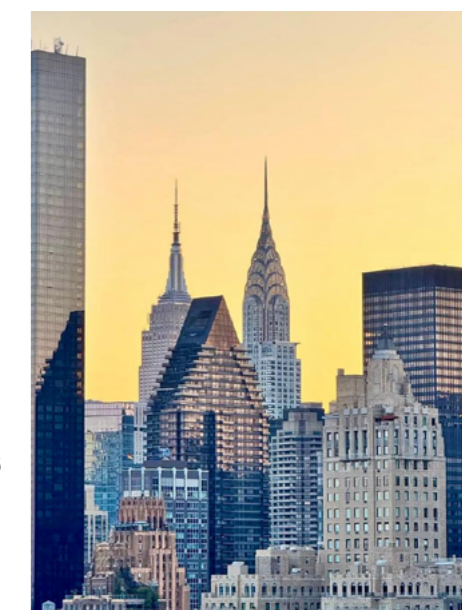
Nueva York, 2025

Cuando finalice este periodo continuaré formando parte de Diller Scofidio + Renfro como Sustainability and Integrated Design Specialist . Es algo que jamás habría imaginado cuando envié mi candidatura a Arquia.