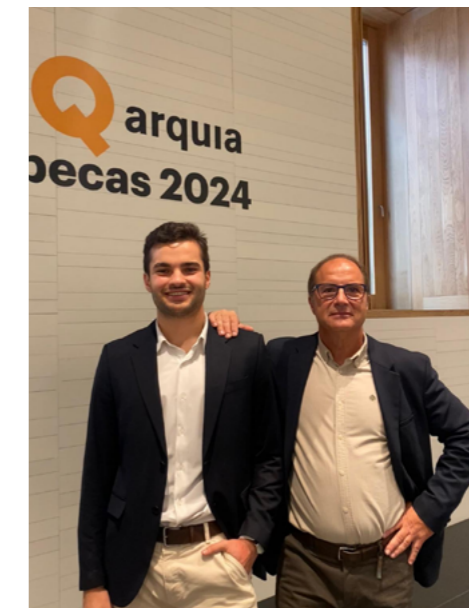
En mi caso, esa oportunidad se llamó Arquia .

Y quizá por eso programas como este son tan necesarios. Porque los jóvenes no pedimos regalos. Pedimos oportunidades. Pedimos que nos dejen participar, aportar y demostrar lo que somos capaces de hacer.