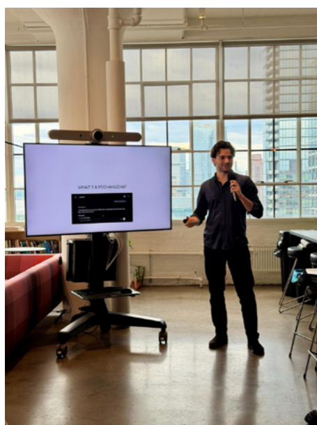
En el estudio...

Quizá lo más valioso de la experiencia no haya sido ningún proyecto concreto, sino la confianza que recibí. Cuando uno llega a una oficina de este nivel espera observar y aprender. Lo que encontré fue algo mejor: la posibilidad de contribuir.