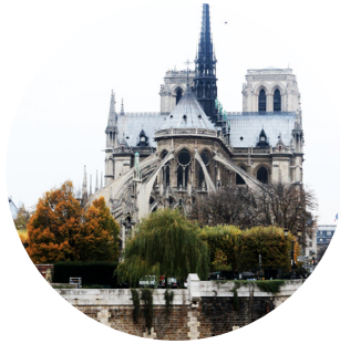
Notre-Dame de Paris

"Si tienes la suerte de haber vivido de joven en París, entonces durante el resto de tu vida ella estará contigo, porque París es una fiesta." E. Hemingway