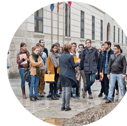
Entrega Beca Arquia - Valladolid

Si bien es cierto que llegué con un conocimiento básico del idioma, el día a día así como los cursos que ofrece La Mairie de París contribuyeron enormemente al perfeccionamiento de la lengua.