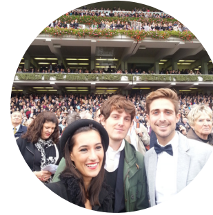
Qatar Prix de l'Arc de Triomphe

"París responde a todo lo que el corazón desea. Uno puede divertirse, aburrirse, reír, llorar o hacer lo que se le antoje sin llamar la atención, puesto que miles de personas hacen otro tanto...y cada uno como quiere."