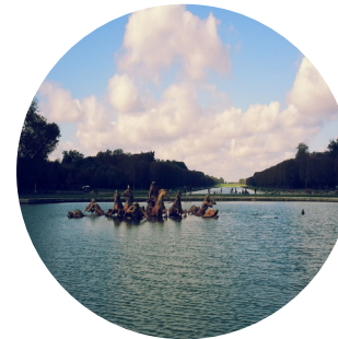
Jardines de Versalles