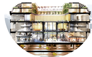
Poste du Louvre

Si bien es cierto que el trato con Dominique Perrault es distante debido a la cantidad de proyectos en marcha, la implicación y cohesión de cada equipo es intachable. El trabajo en grupo, la cooperación, el aprendizaje mutuo o el saber argumentar y aceptar puntos de vista dispares, son elementos fundamentales a la hora de hacer arquitectura. Por otro lado, el ambiente intercultural del estudio, así como las exposiciones y visitas que Perrault organiza, hacen del estudio un "ente viviente" y enriquecedor.