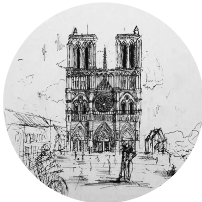
Boceto Notre Dame 11-2014

PERO SÓLO HICIERON FALTA UNOS INSTANTES, CUANDO EN MI CAMINO HACIA NOTRE-DAME, ME DETUVE EN MEDIO DEL PUENTE LOUIS-PHILIPPE, PARA QUE PARÍS QUEDARA GRABA- DA EN MI MEMORIA PARA SIEMPRE.