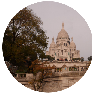
Sacre Coeur de Montmartre

¿Ajetreo o puntualidad?, ¿densidad o ambiente intercultural?, ¿día nublado o íntimo?, tanto se puede cuestionar de París, todo menos la belleza intrínseca de esta ciudad. Centro mundial del arte en el s. XIX y cuna de personajes como Descartes, Voltaire o Duchamp, París ha conseguido sorprenderme, como en su día sorprendió a Picasso, Victor Hugo o Manet. Los grandes bulevares arbolados del París Haussmaniano, los múltiples parques y bosques que actúan como pulmones de la ciudad, el Sena y sus pintores, Montmartre y sus artistas, o las estrechas callejuelas que te conducen sin rumbo a descubrir sus secretos, son algunos de los elementos que avivan la capital francesa.