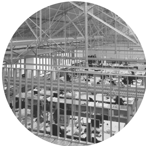
Estudio DPA - 6, rue Bouvier Paris

Tras una semana de formación, en la que nos familiarizamos, junto con nuevos internos, con el sistema de organización del estudio y sus proyectos, pasamos a formar parte de un equipo. La magnitud de un estudio de esta escala requiere de una jerarquización a la hora de desarrollar los proyectos, de forma que cada uno está compuesto por un Jefe de Proyecto y un equipo.