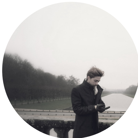
Jardines del Château de Fontainebleau

Oportunidad gracias a la cual he complementado mis estudios con la praxis profesional, he vivido en una de las ciudades más sorprendentes del mundo y conocido a personas increíbles, de las que he aprendido dentro y fuera del estudio, he perfeccionado "la langue de l'amour" y puedo decir, que aún a falta del PFC, me siento arquitecto.