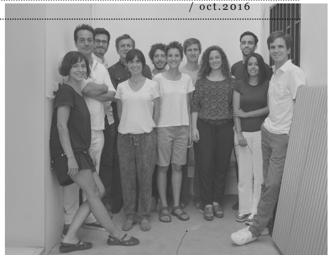
la foto familiar de antes de vacaciones