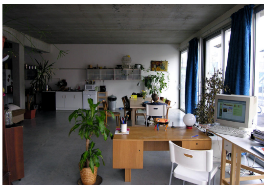
img _ www.lacatonvassal.com

Comenzamos... el primer dia la primera persona que me recibió fue Jean-Philippe Vassal, estaba sentado al final de una mesa... enfrente de la puerta, no tenía despacho propio, estaba rodeado de todos los becarios del estudio, al otro extremo del estudio estaba Anne un poco atareada con la publicación que preparaban para la Biennial de Venecia , enseguida me di cuenta que ella tampoco tenía despacho propio, observé a mi alrededor, el estudio era un espacio diáfano con largas visuales nada lo interrumpía ...al fondo se podía intuir un color verde, una carpintería de vidrio separaba el invernadero de Jean Philippe con el estudio. Los primeros dias pasaron y pronto entendí que aquí las jerarquías no eran una prioridad, todos teníamos los mismos ordenadores, el mismo espacio vital para trabajar , las mismas sillas, compartíamos el mismo frigorifico, la misma mesa para comer....se percibía un ambiente muy familiar e incluso porque no decirlo a veces daba la sensación que era un hogar...lleno de recuerdos, de libros amontonados, postales de viajes, de fotos divertidas...se me venía a la mente esas imagenes de las casas proyectadas por ellos mismos ,en las que domina la estética del desorden pero que a la vez enseña una gran vitalidad y donde podemos imaginar como viven sus habitantes.No hay preparación todo es casual.