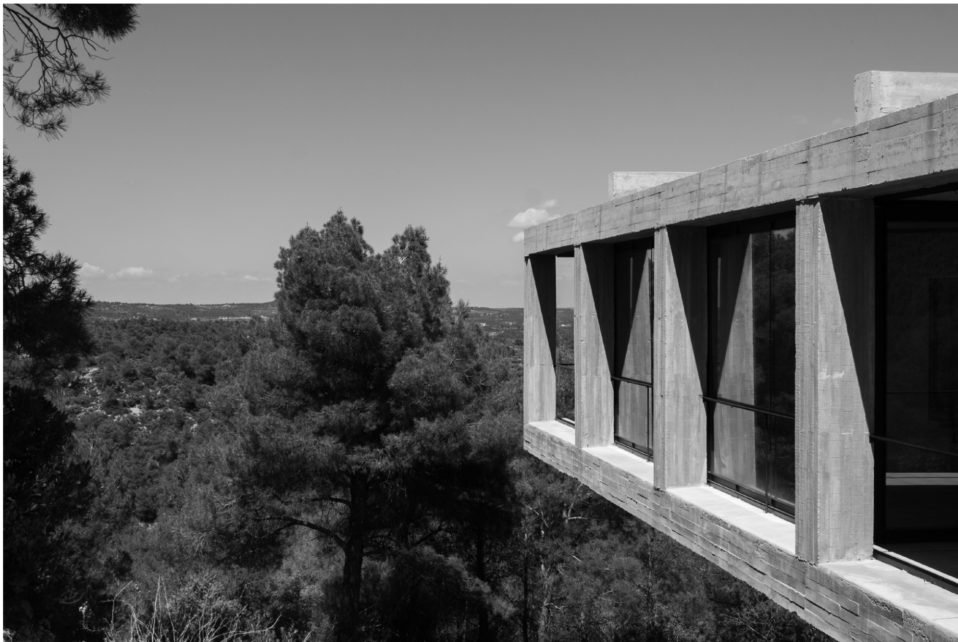
Solo House Peter Zumthor