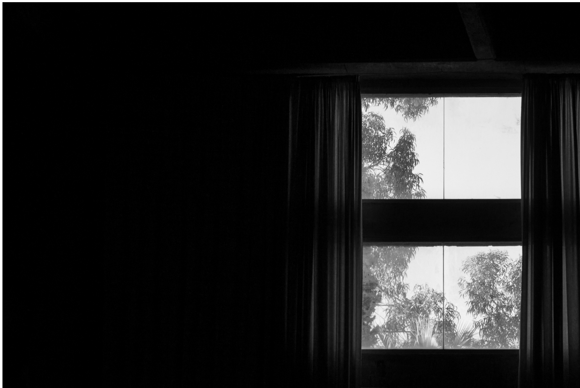
La Fábrica, Ricardo Bofill