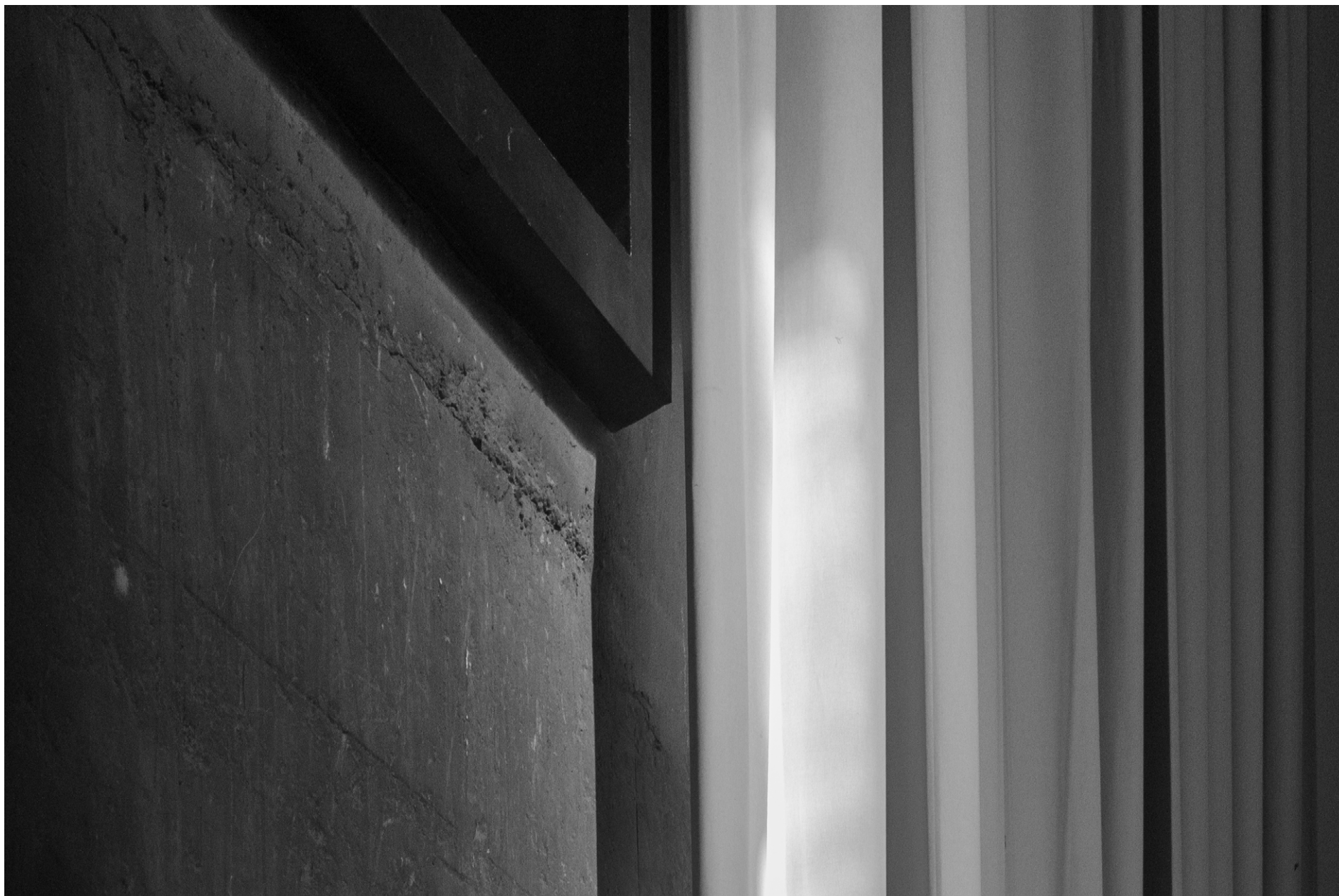
La Fábrica, Ricardo Bofill