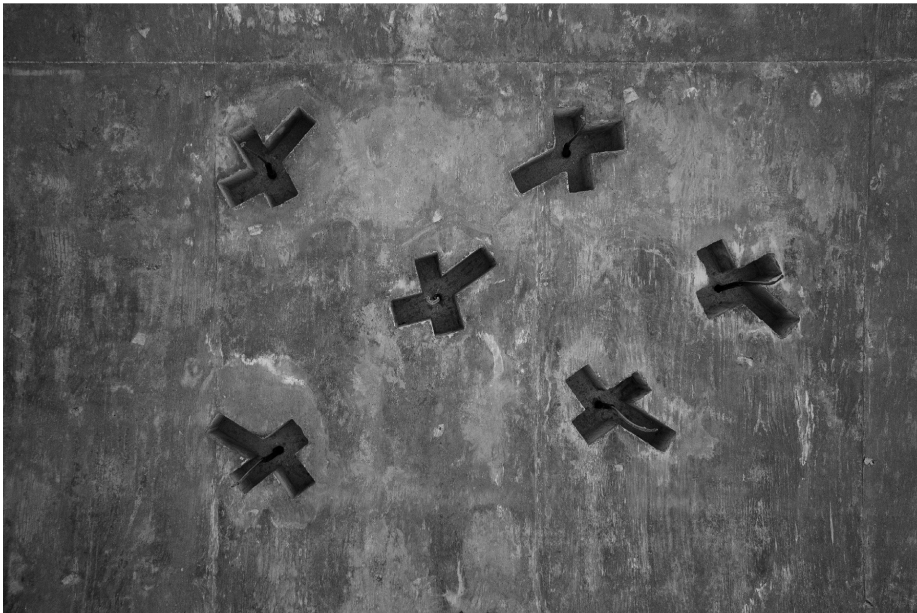
Cementerio de Igualada, Miralles + Pinós