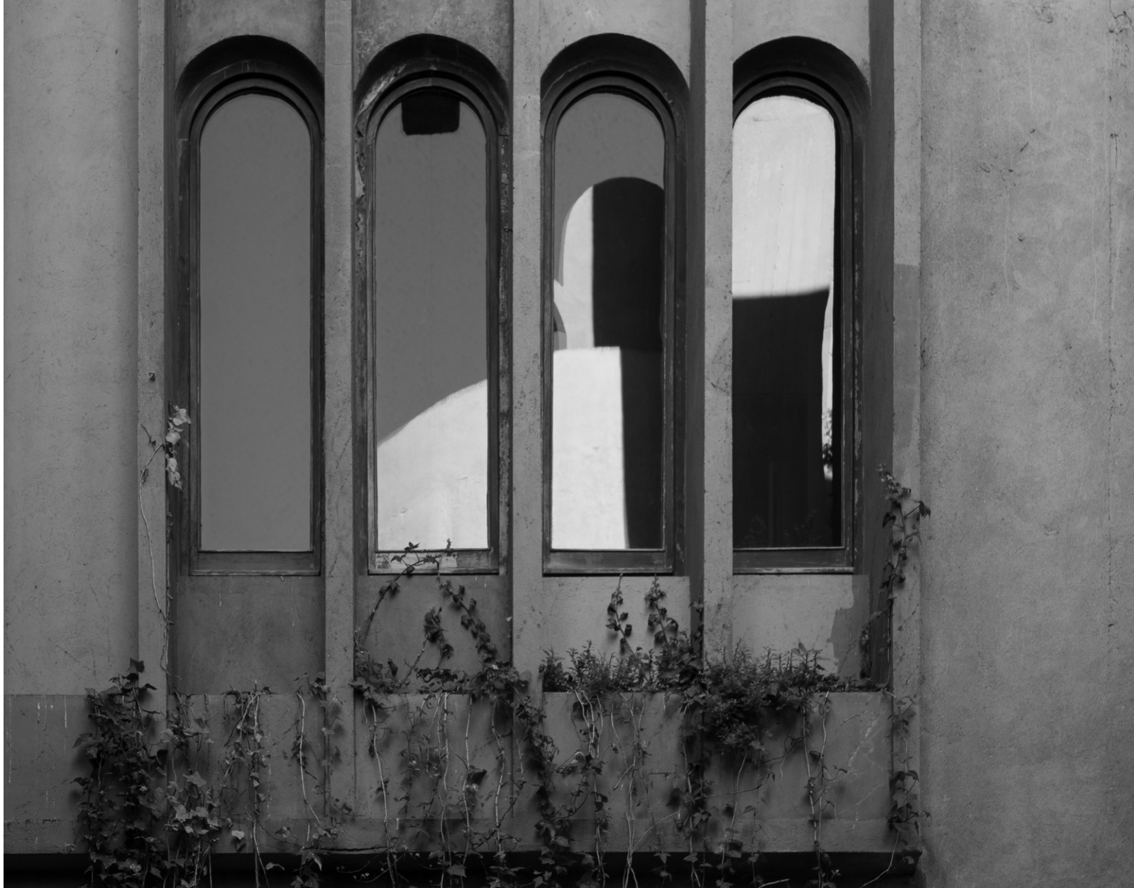
La Fábrica, Ricardo Bofill