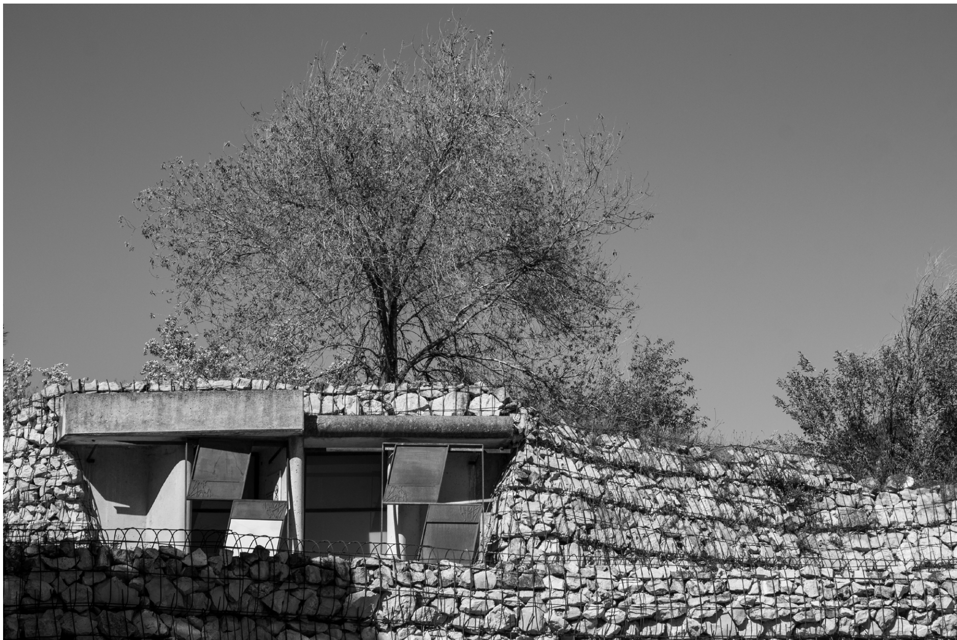
Cementerio de Igualada, Miralles + Pinós