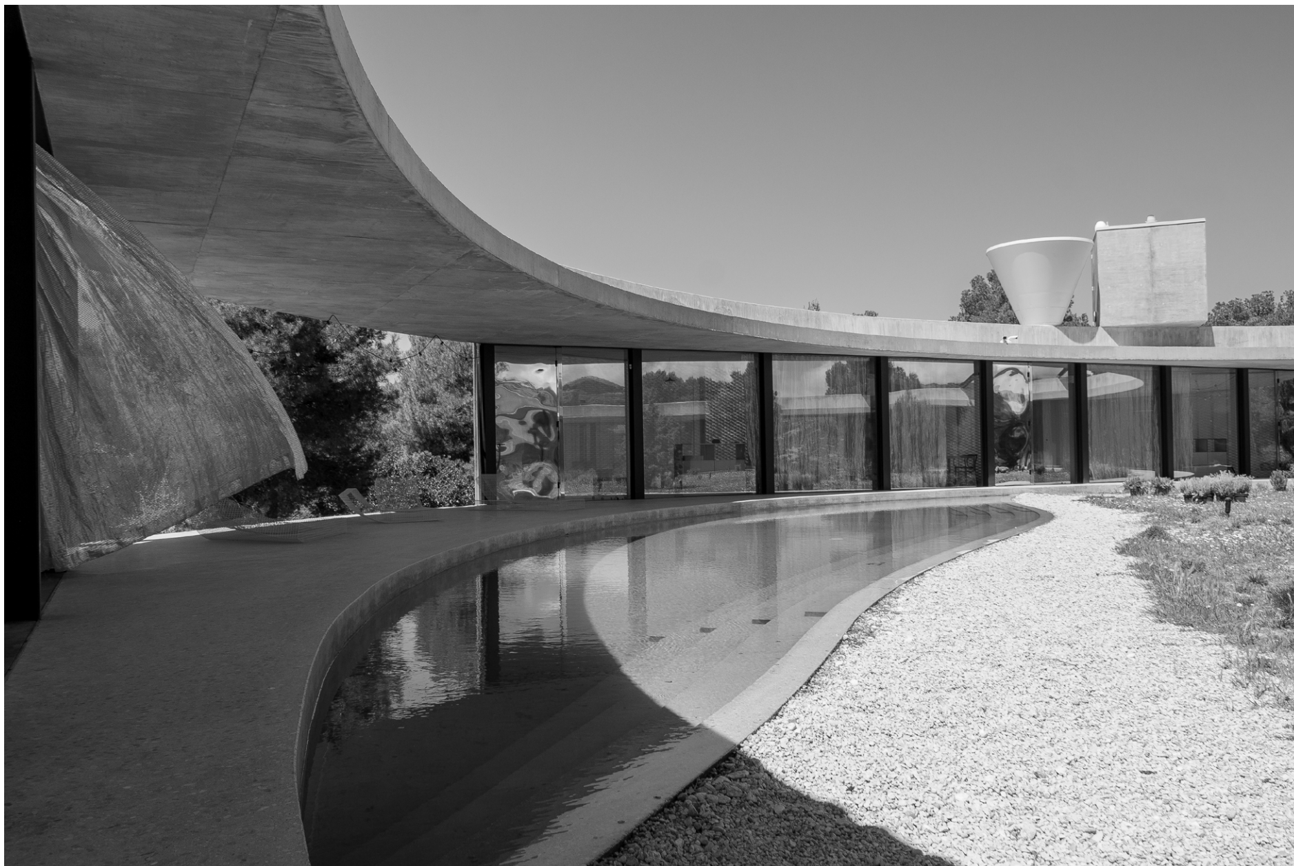
Solo House Office KGDVS