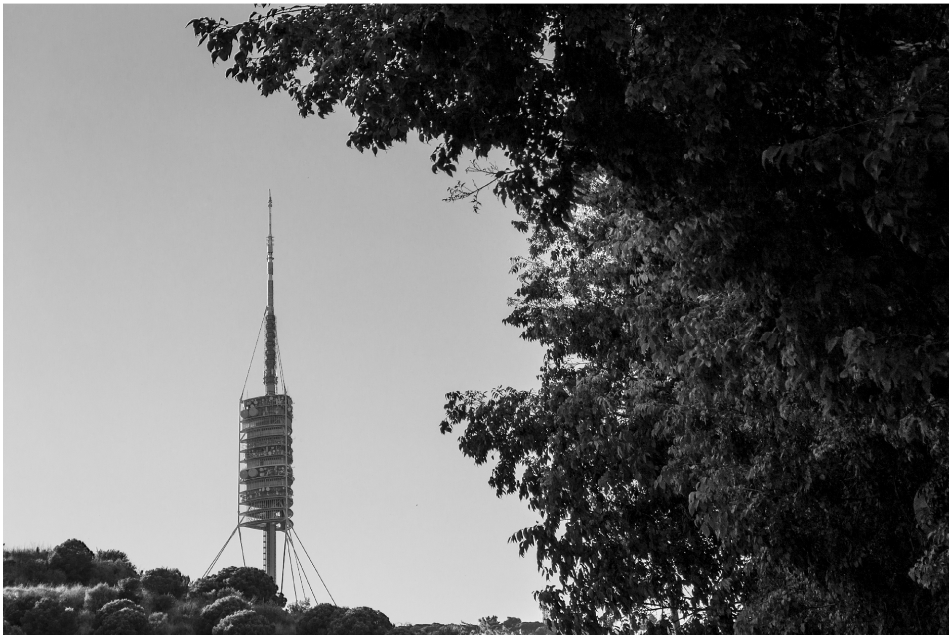
Torre Collserola, Norman Foster