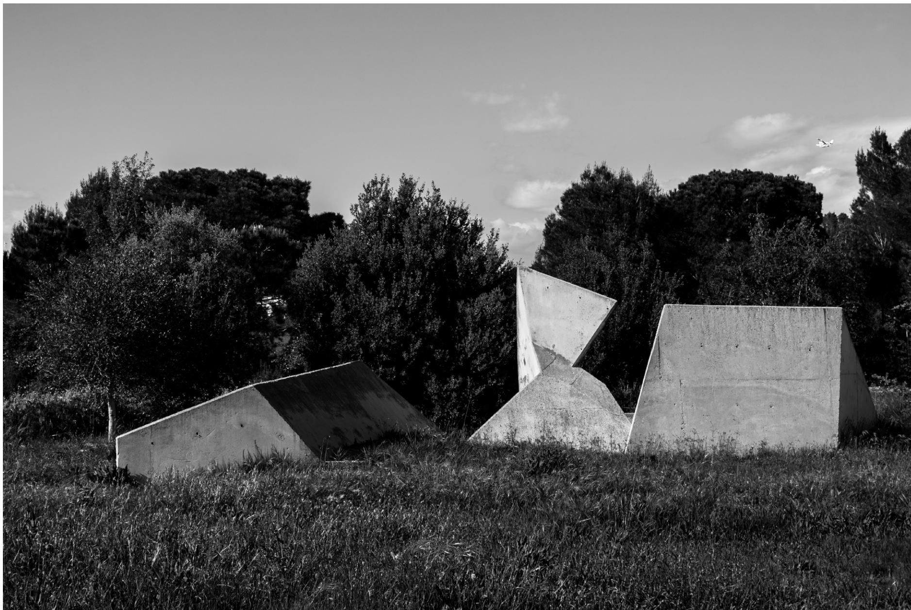
Cementerio de Igualada, Miralles + Pinós