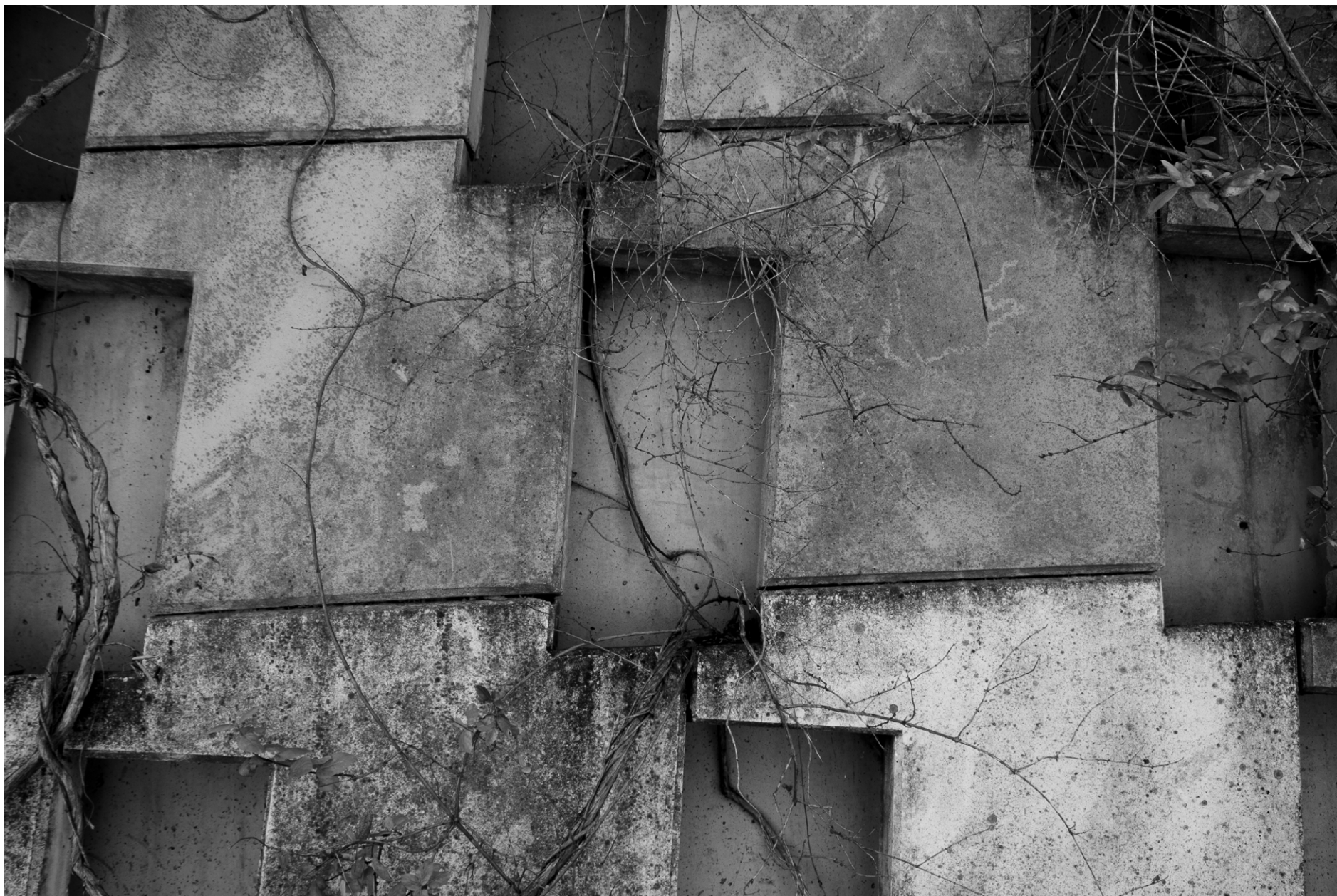
Cementerio de Igualada, Miralles + Pinós