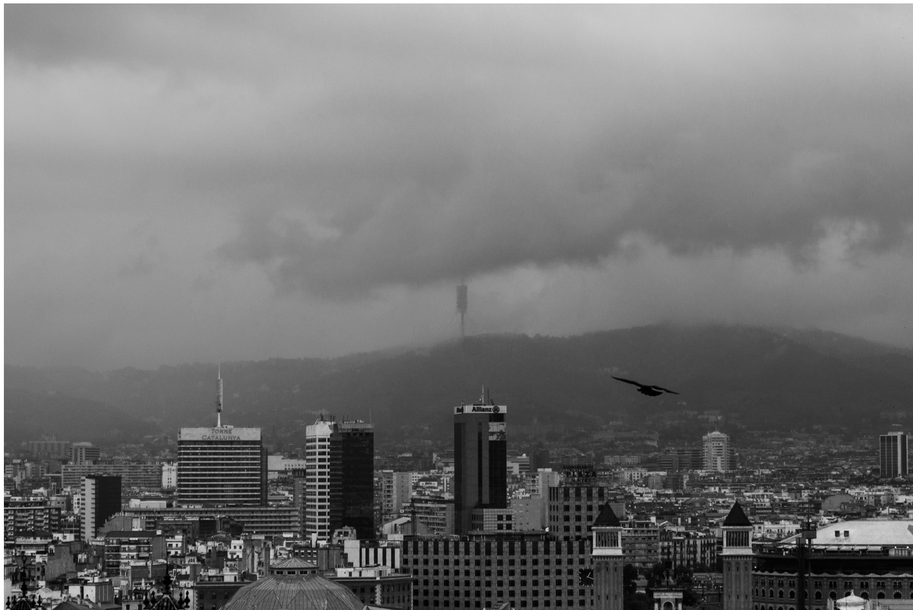
Vista de Barcelona desde el Museo Nacional de Arte