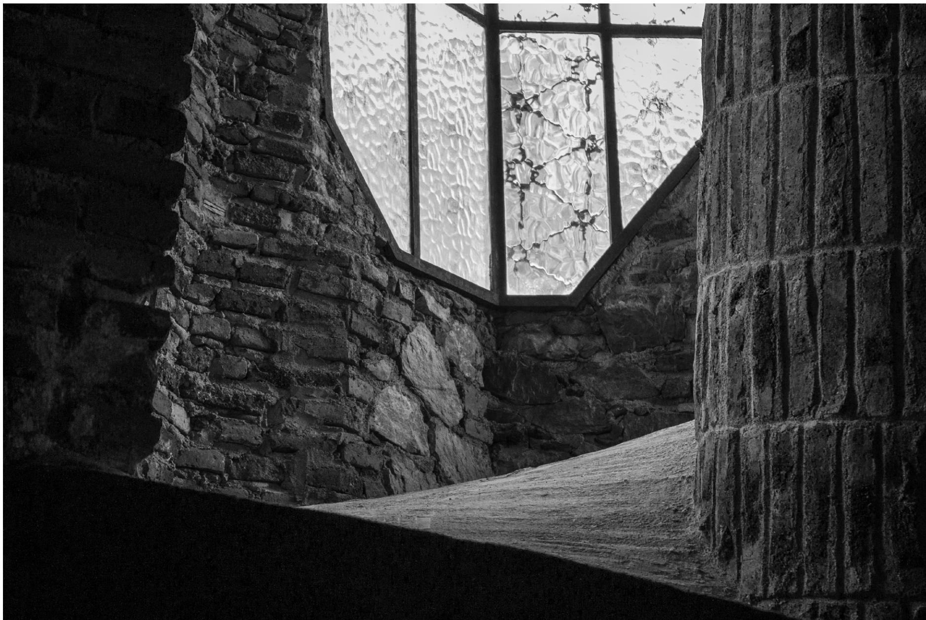
Colonia Güell, Cripta Antoni Gaudí