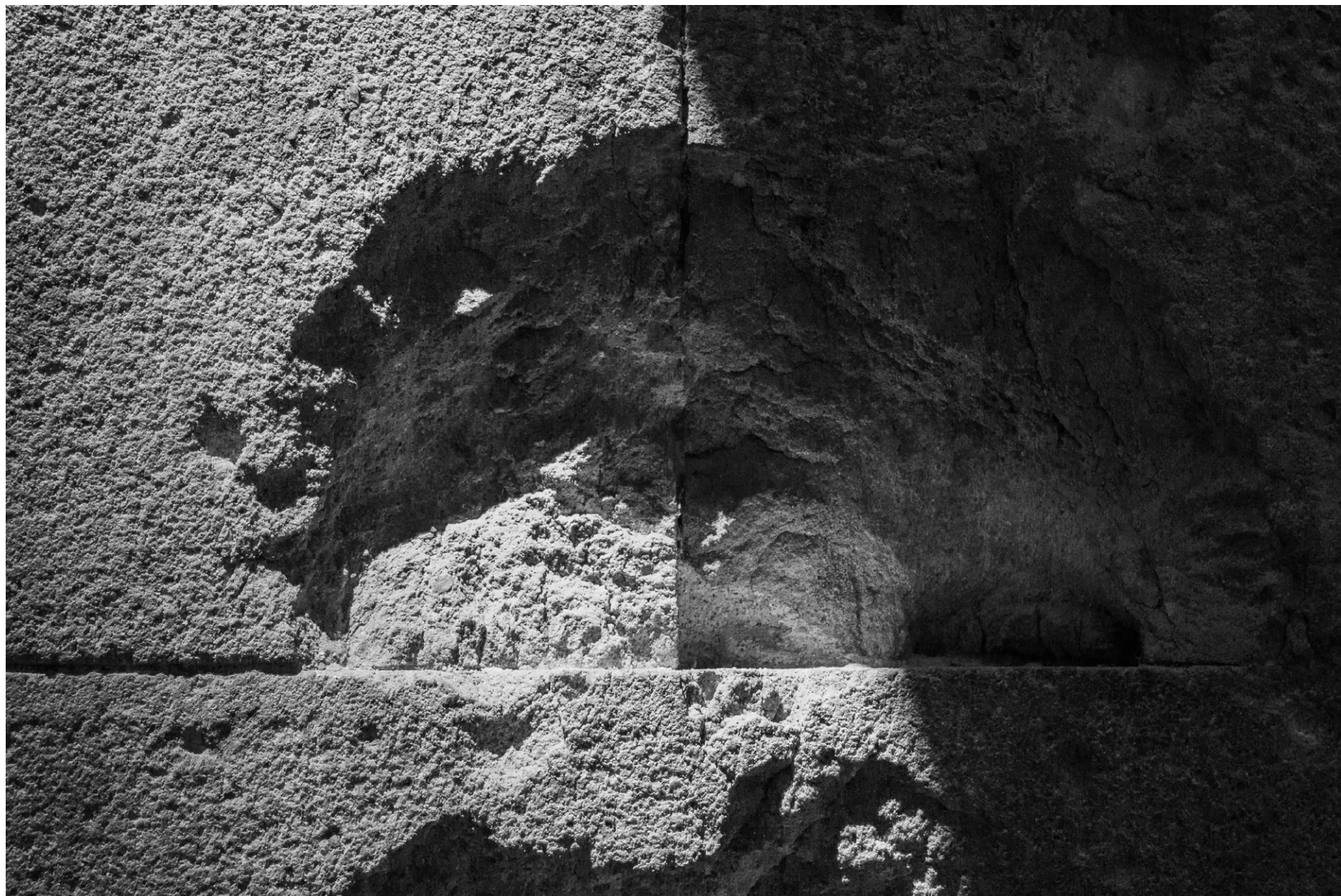
Iglesia de San Felipe Neri