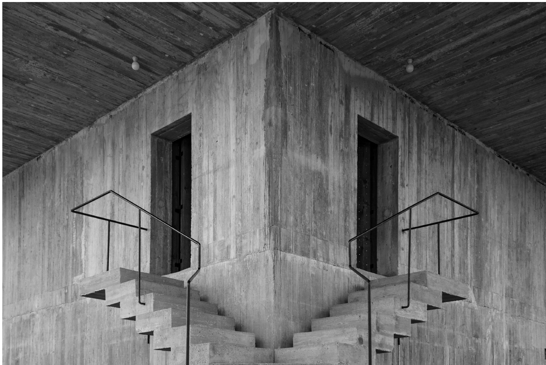
Solo House Pevo Von Elrichshausen