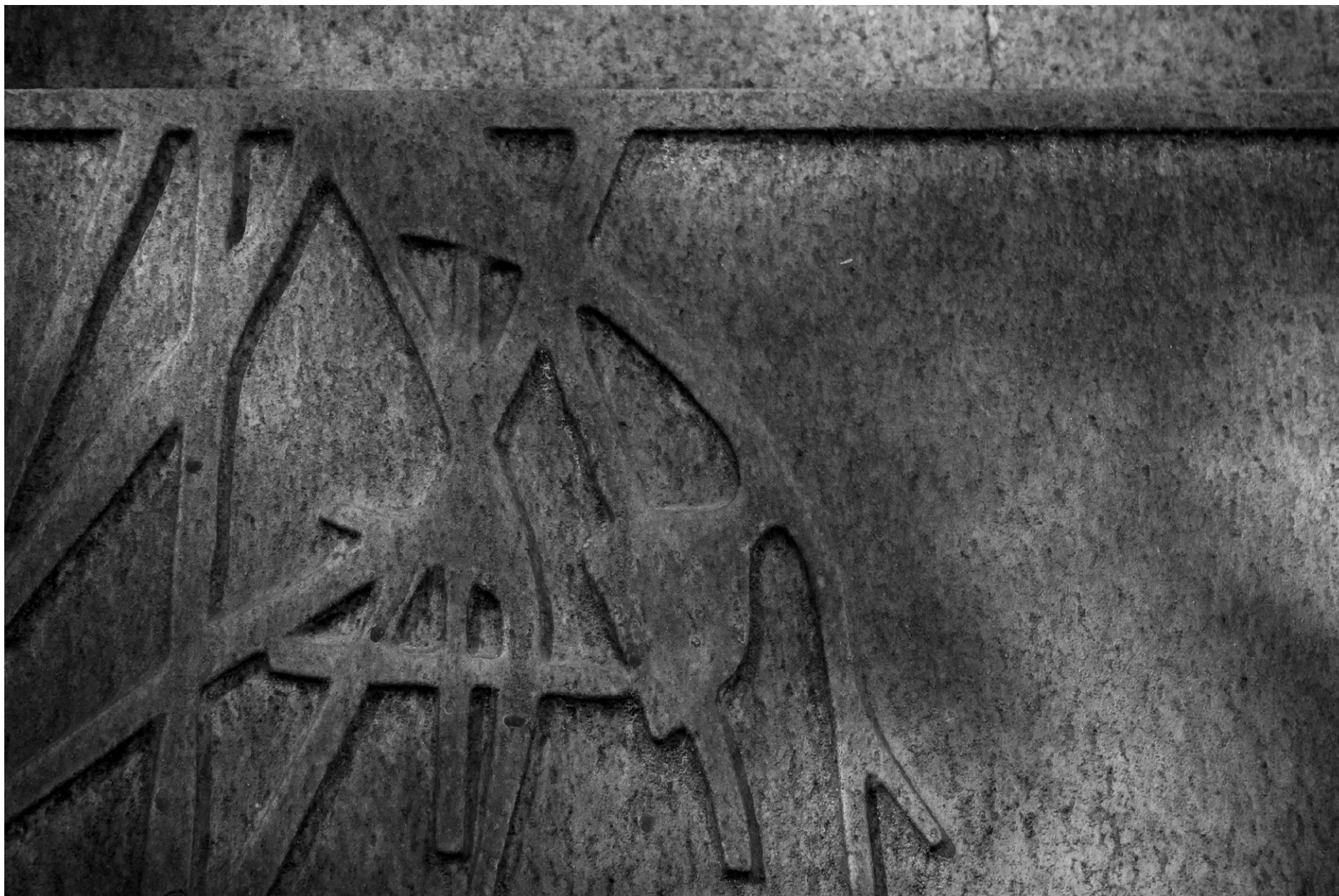
Cementerio de Igualada, Miralles + Pinós