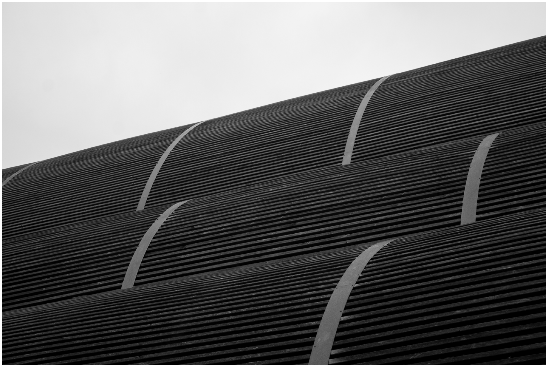
Umbráculo del Parque de la Ciudadela