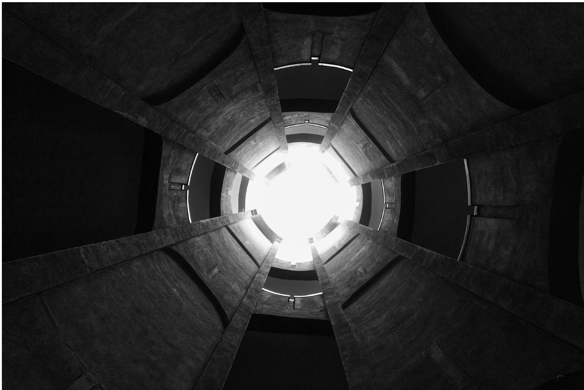
La Fábrica, Ricardo Bofill