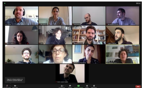
Primera reunión online con el equipo de estudio Herreros