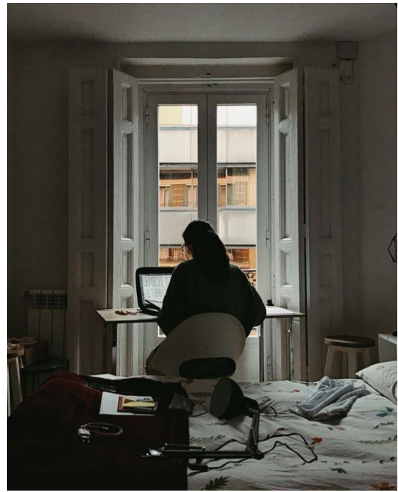
Mi espacio de trabajo en casa

Y es que no he desaprovechado ni un fin de semana libre para visitar eventos que la extensa oferta cultural de la capital me ofrecía. Comenzando por los clásicos, como el Prado, Reina Sofía y Thyssen, me he paseado las galerías casi emocionándome con la cantidad de arte que había colgado en sus paredes. Por otro lado, las exposiciones temporales que Centros como CaixaForum y el museo ICO ofrecen han resultado ser de una calidad excepcionales. Además, gracias a las tarifas