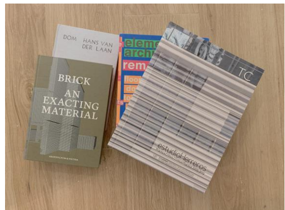
Algunos de los libros que he comprado en la librería Naos, visita imprescindible