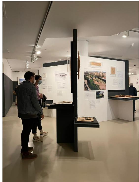
Visita a la exposición de Carme Pinós en el Museo ICO