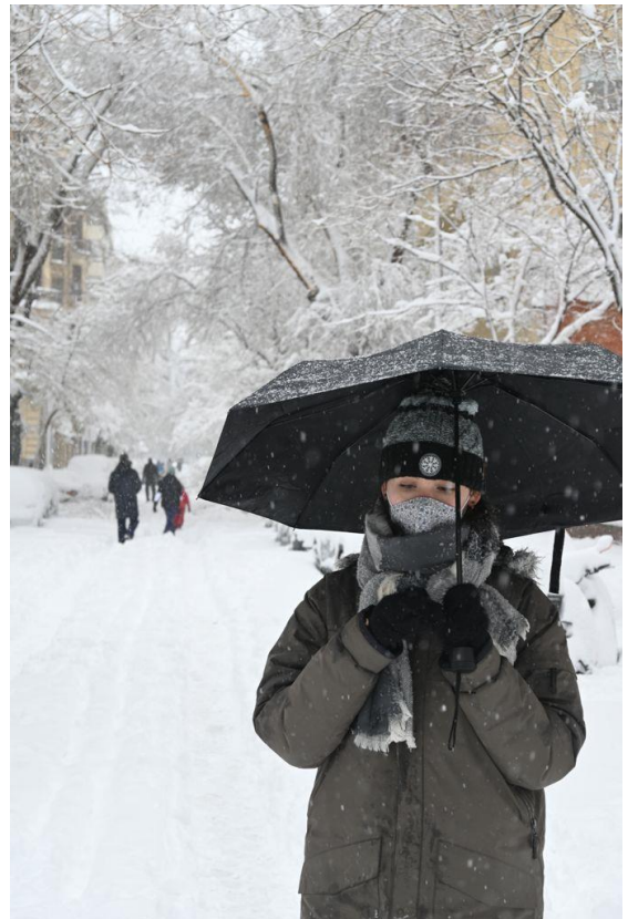
Paseo por la Castellana el día de la gran nevada