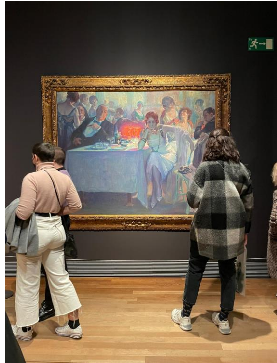
Visita a la exposición de 'Invitadas' en el Museo del Prado

Por fin es 1 de octubre y mis prácticas en estudio Herreros comienzan. Como ya he comentado anteriormente, 2020 ha sido un año de cambios y adaptaciones continuas para todo el mundo, así que dio la casualidad que mis dos primeros días en el estudio fueron de manera telemática. Adjunto foto de la primera reunión de equipo a la que asisto. Sin embargo, en seguida volvemos todos a la oficina y me presento a quienes serán mis compañeros y jefes durante los próximos 6 meses.