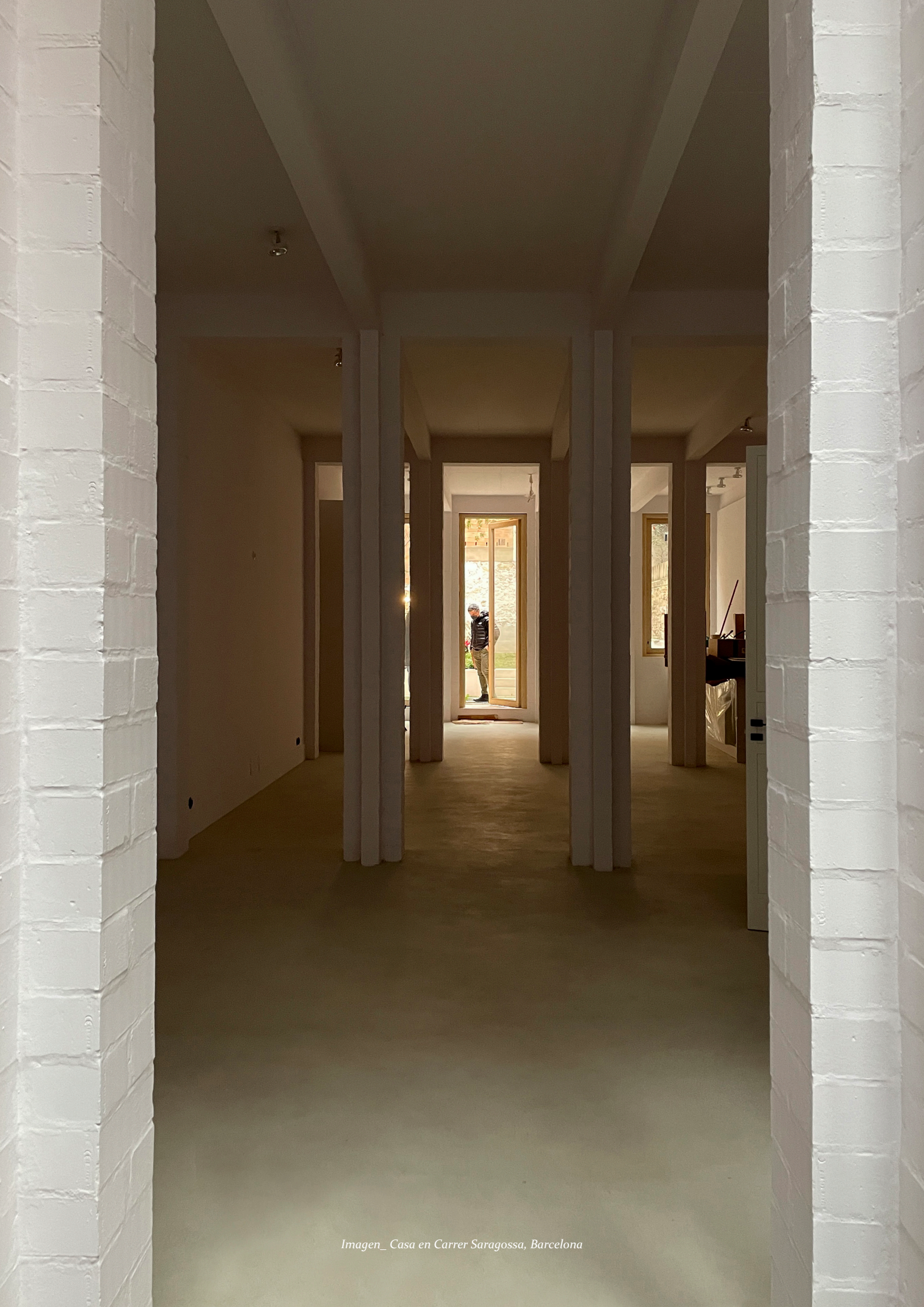
Imagen_ Casa en Carrer Saragossa, Barcelona