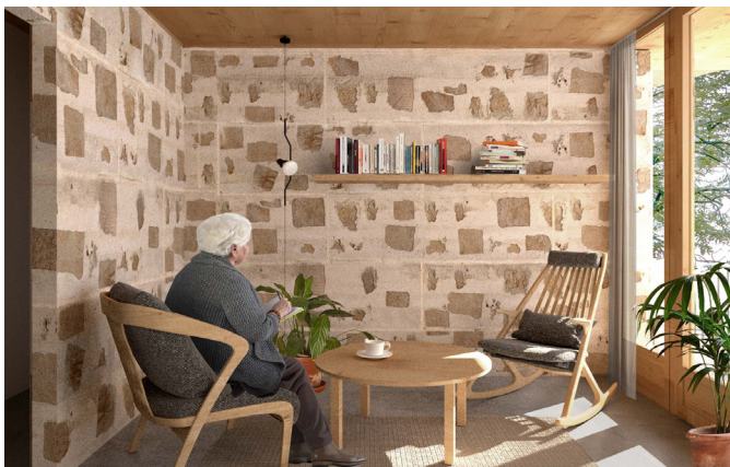
Imagen_ Edificio residencial en Mallorca

Aunque lo habitual en el despacho es entrar en uno de los equipos de un proyecto y continuar en él hasta su finalización, yo tuve la oportunidad de ir rotando de uno a otro y poder trabajar con casi todos. Fue muy enriquecedor ya que en cada proyecto del despacho se abre un mundo totalmente diferente y apasionante del que poder aprender