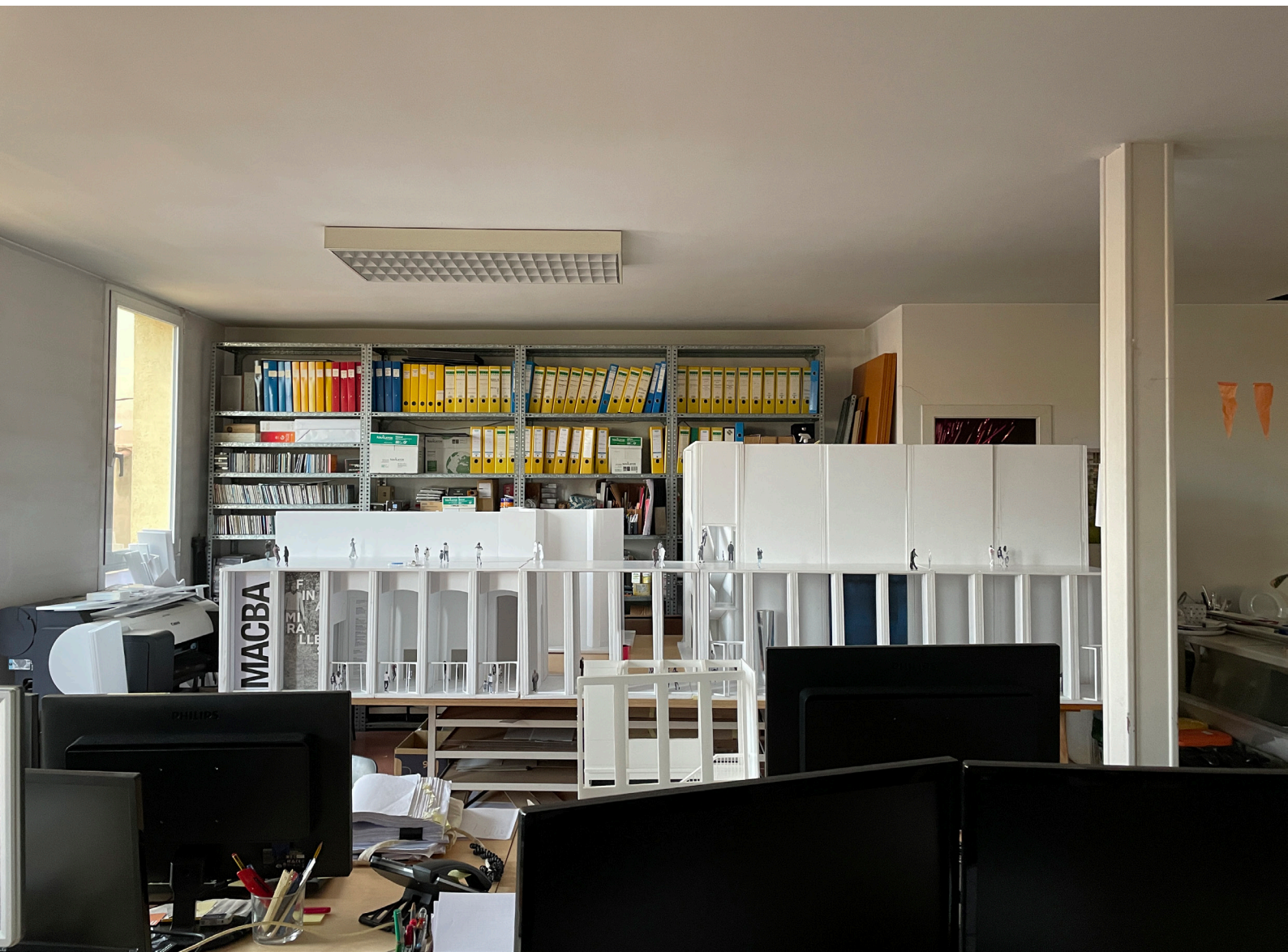
Imagen_ Montaje de una maqueta en el despacho

Cada viernes por la tarde se realiza una sesión de debate abierto. Cada semana se va rotando y se presentan varios proyectos para ver cómo han ido avanzando, cuáles son los problemas que han surgido o qué nuevas opciones de avance se presentan. Este tipo de seguimiento impide que el proyecto se vaya por las ramas y así poder encauzarlo entre todos de forma unánime. Son sesiones muy prácticas y divertidas donde todos los que no hemos tenido posibilidad de trabajar con ese equipo podemos ver y tomar también decisiones conjuntas.