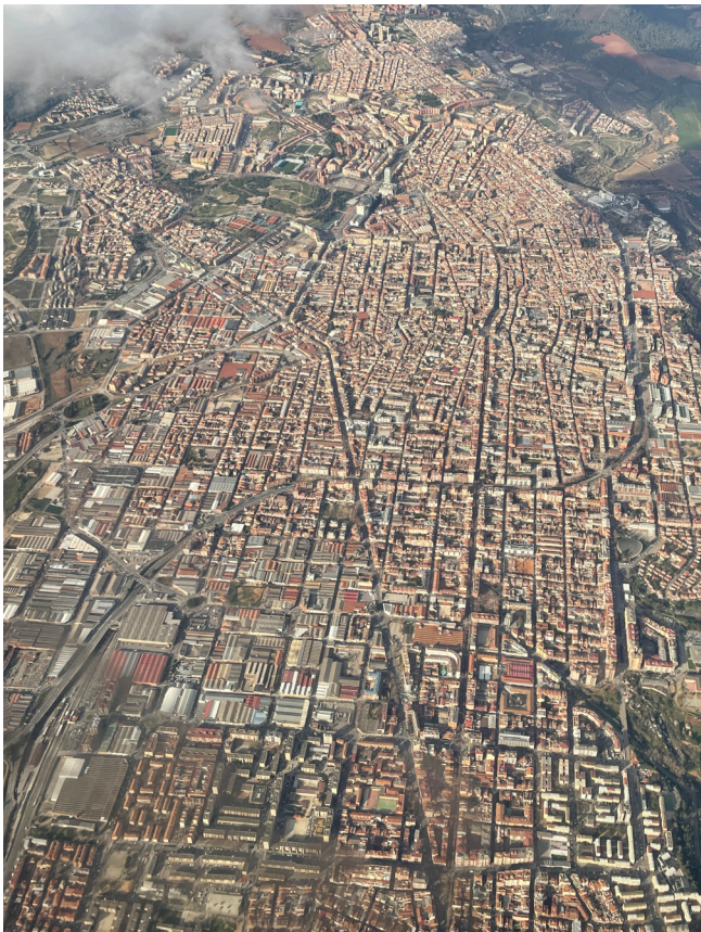
Imagen_ Vista aérea de Sabadell durante el vuelo a Barcelona

Y de Barcelona... qué decir. Los fines de semana aprovechaba el tiempo libre para coger el tren y explorar la ciudad. A solo 35 minutos saliendo de mi casa ya me encontraba en plena Plaza Catalunya. Ya había veraneado por la zona en muchas ocasiones, pero vivir la ciudad no tiene parangón. Es una joya arquitectónica en sí misma llena de innovación y en constante cambio y movimiento. Gracias a los compañeros del despacho he podido descubrir nuevos rincones y edificios espectaculares, como la fábrica del gran Ricardo Bofill, que pudimos ver cuando abrió durante su homenaje.