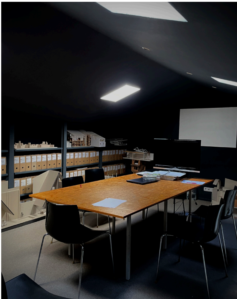
Imagen_ Sala de reuniones

Realmente es un lugar que refleja muy bien los ideales del despacho, el bienestar personal, las interacciones sociales, lo práctico y pero a la vez potente... Al ser un local pasante, la ventilación cruzada permite trabajar con una ligera brisa en los meses de verano, y disfrutar del sol que entra por captación a través de la fachada sur en invierno. Otra vez más, los mismos criterios que trabajamos en los proyectos.