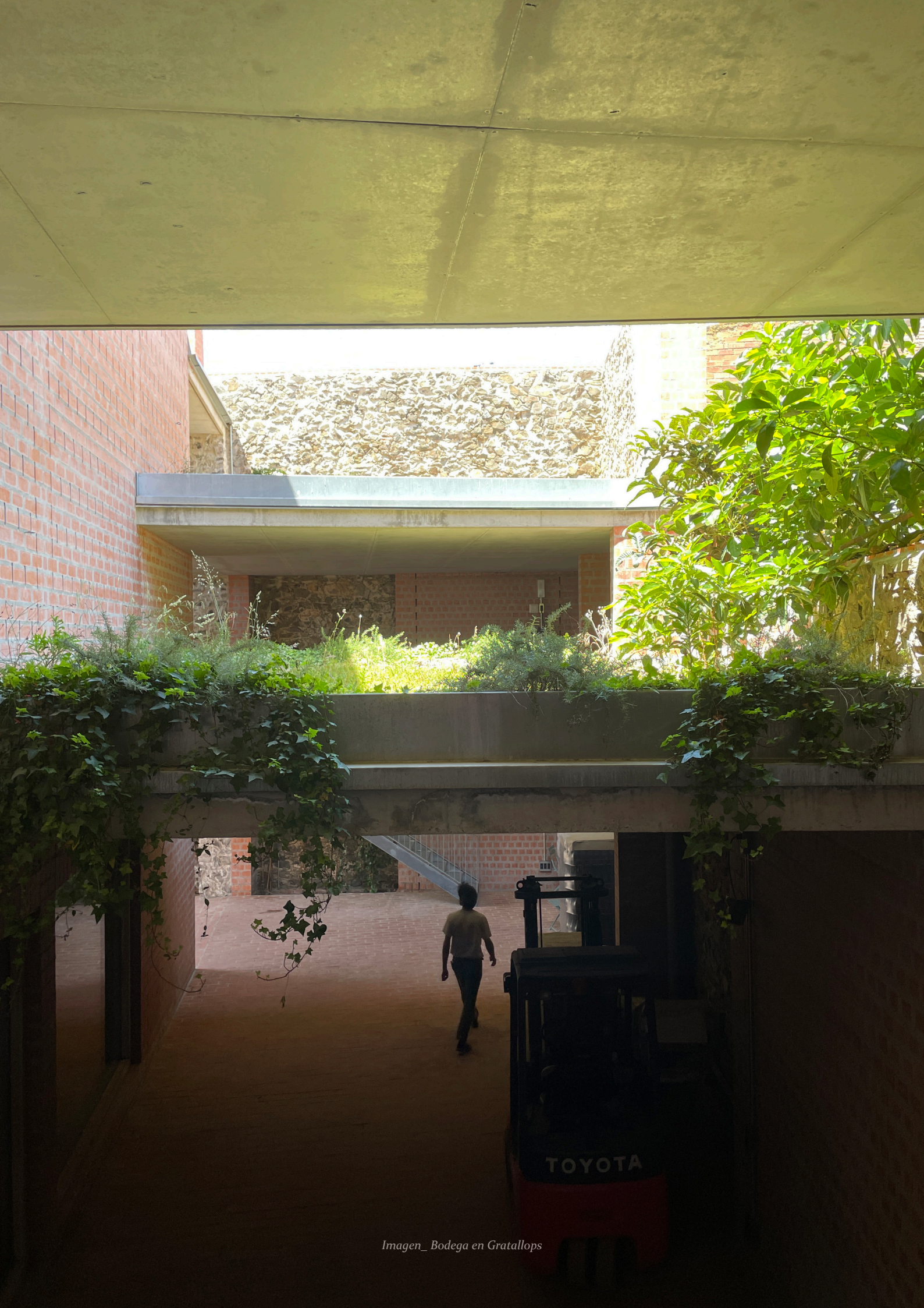
Imagen_ Bodega en Gratallops