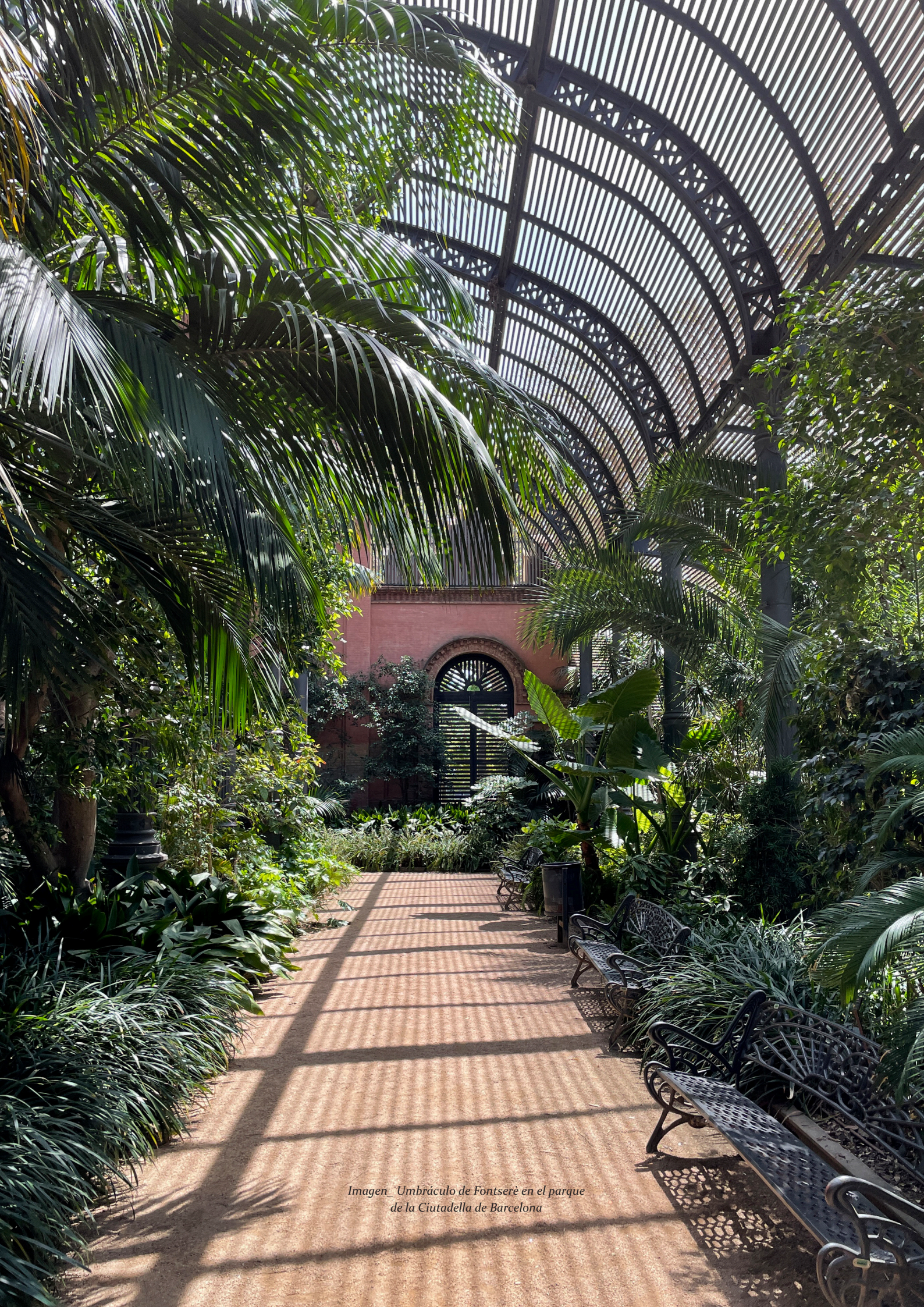
Imagen_ Umbráculo de Fontserè en el parque de la Ciutadella de Barcelona