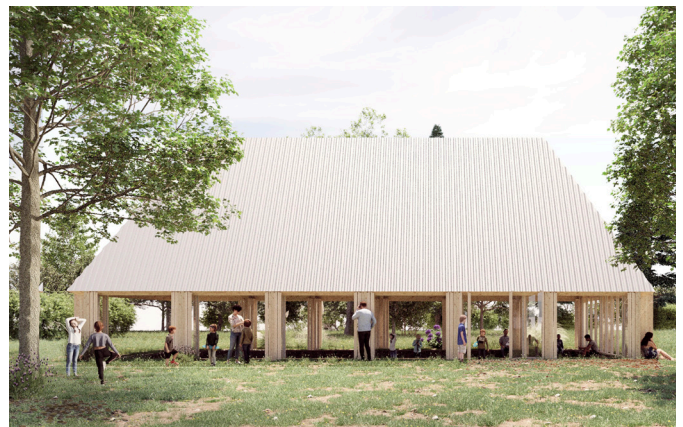
Imagen_ Pabellón bioclimático en Sabadell