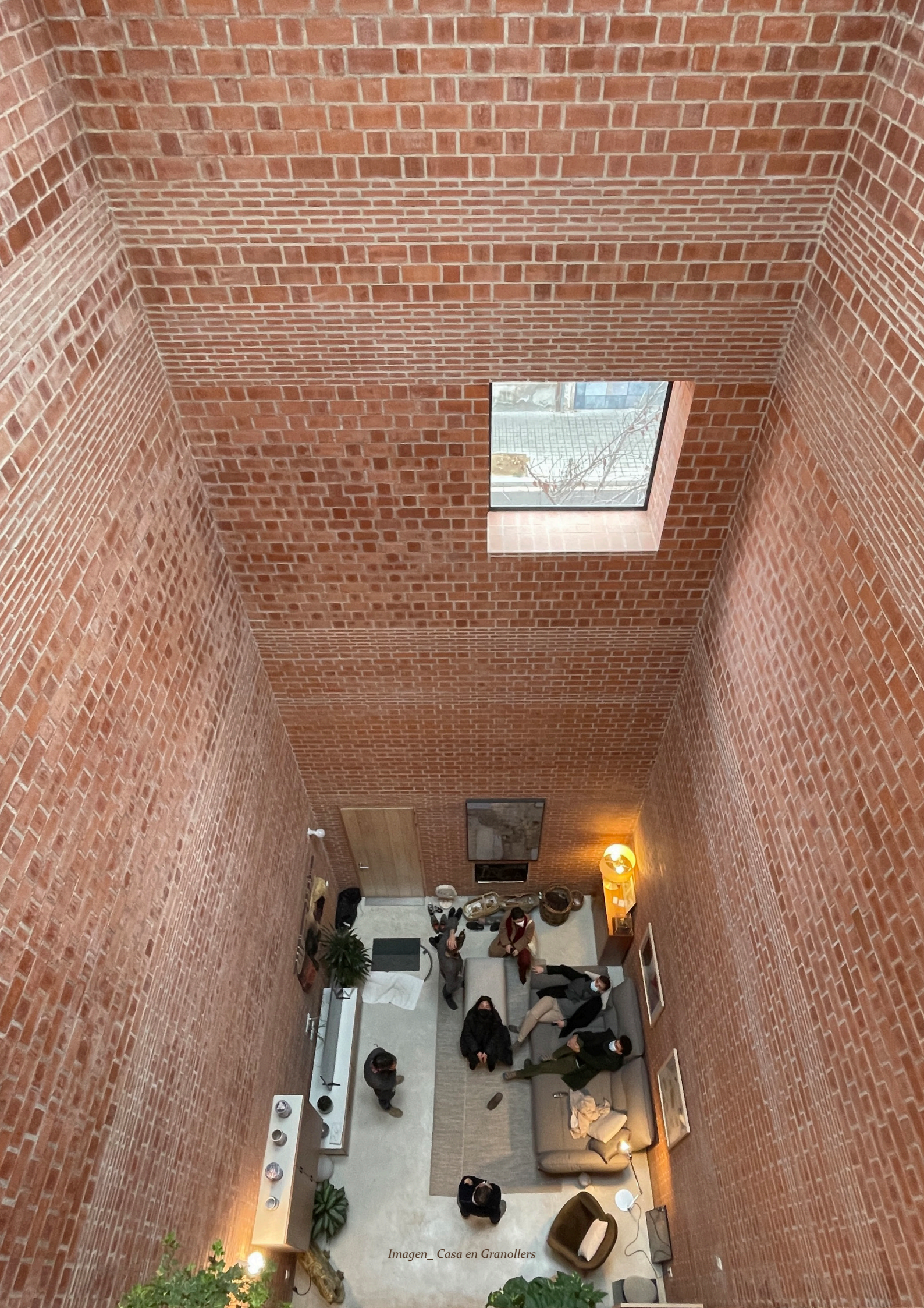
Imagen_ Casa en Granollers