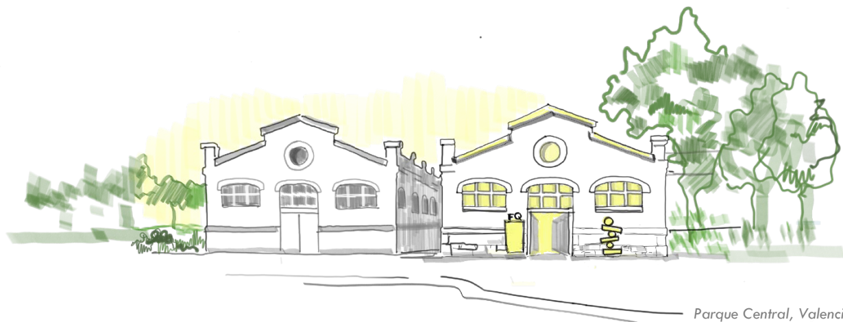
Parque Central, Valencia

El festival brindó una oportunidad magnífica de conocer muchos estudios diferentes, proyectos con nuevos retos, las tendencias y necesidades de arquitectura hoy en día. Obvio, fue muy importante también para conocer a otros becarios y compartir la emoción de empezar una experiencia nueva. Me quedé muy inspirada e impaciente por empezar la beca.