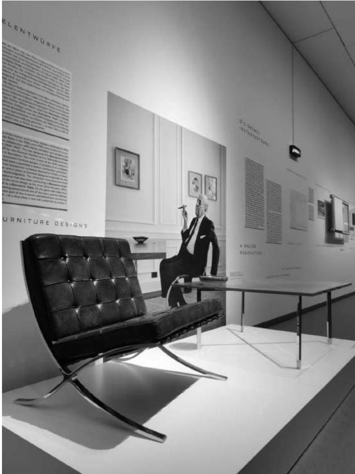
Galería de Mies...

También en Berlín se puede hacer mucho senderismo. Yo fui a Postdam caminando, que es la ciudad de al lado. Estas son algunas fotos del bosque entre las dos ciudades: