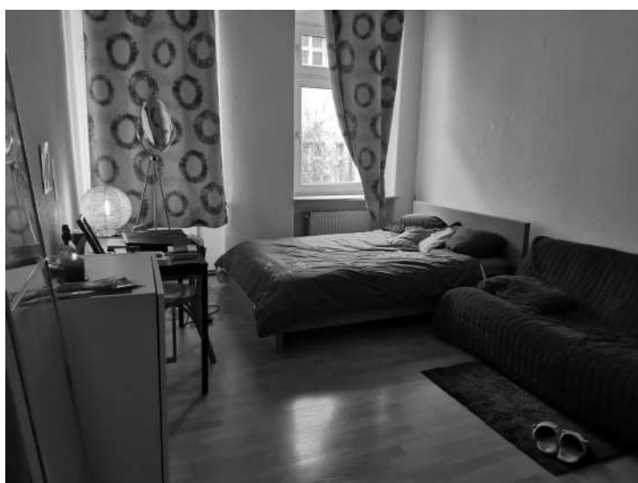
Mi habitación en el distrito de Wedding

Es por todos conocido en Berlín lo difícilísimo que es encontrar piso. Cuando me enteré de que mi destino iba a ser finalmente el taller de Anupama, ya era demasiado tarde para encontrar una habitación a buen precio. Yo he estado pagando 800 euros mensuales por una habitación que encontré en Airbnb. Fue un error por mi parte porque la app se lleva una gran comisión y se aprovechan mucho con los precios. Os recomiendo que vuestro límite en el precio sea como mucho 700 euros y que uséis otras páginas como Erasmusu o housinganywhere. Os recomiendo también que estudiéis el barrio de vuestro piso porque no todos los barrios son igual de seguros, aunque en general sea una ciudad sin mucha delincuencia.