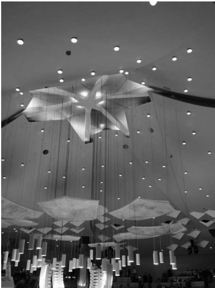
Filarmónica Hans Scharoun