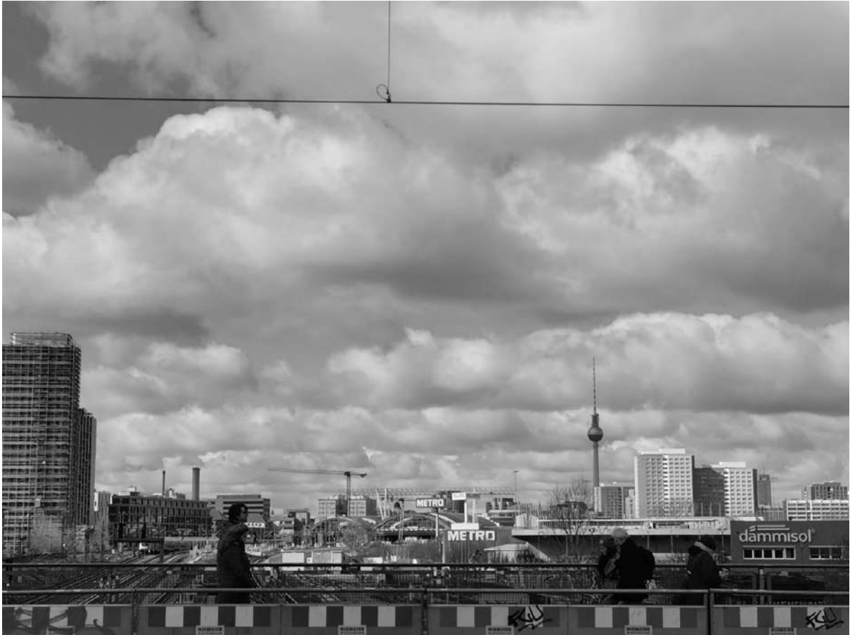
Contorno urbano de Berlín desde el RAW