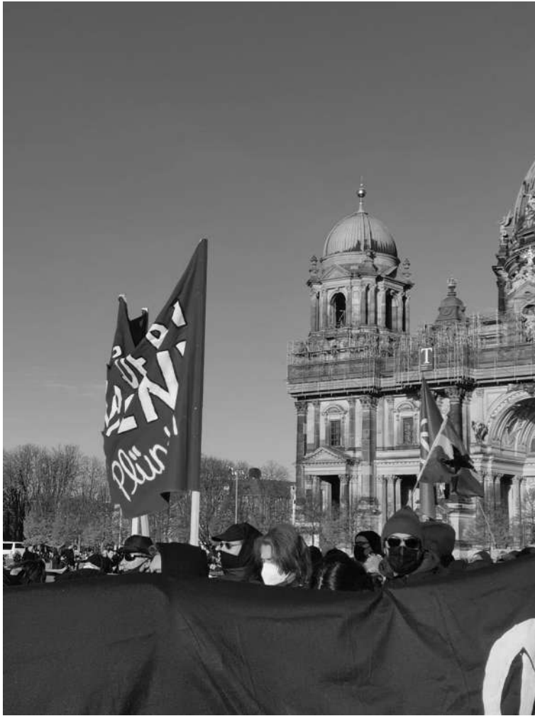
Manifestaciones cerca de la Catedral del Dom.

En Navidad la ciudad se pone preciosa y es muy típico tomar vino caliente. Podés salir con amigos a pasear por los mercadillos navideños.