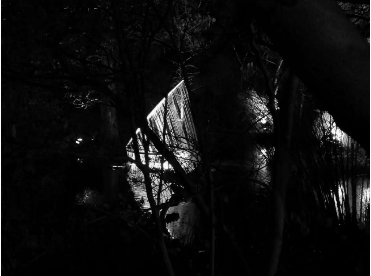
Espectáculo de luces en el Jardín Botánico

Veréis que Berlín tiene una estética muy Underground, os dejo algunas fotos callejeras