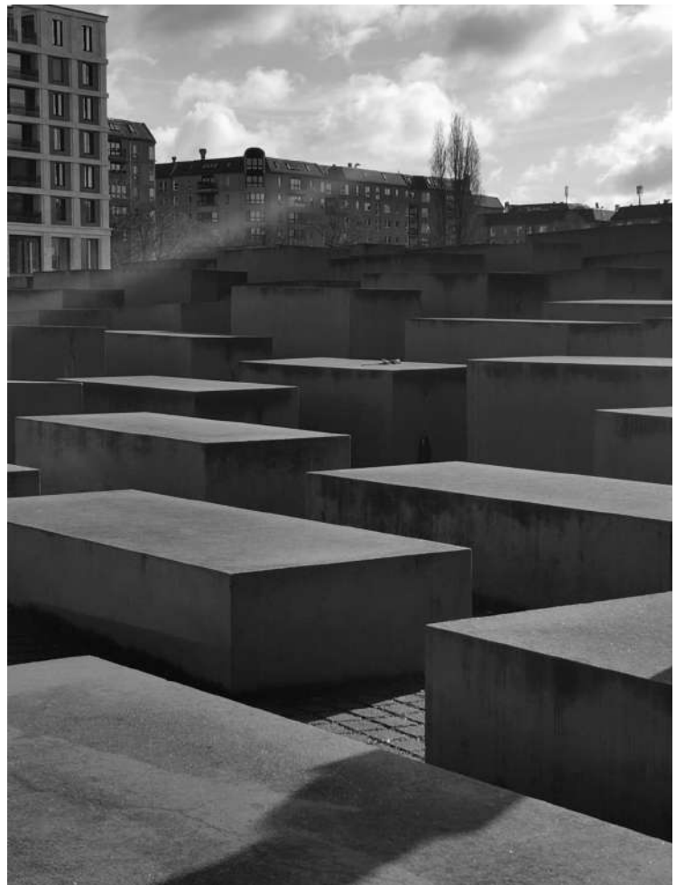
Museo del Holocausto