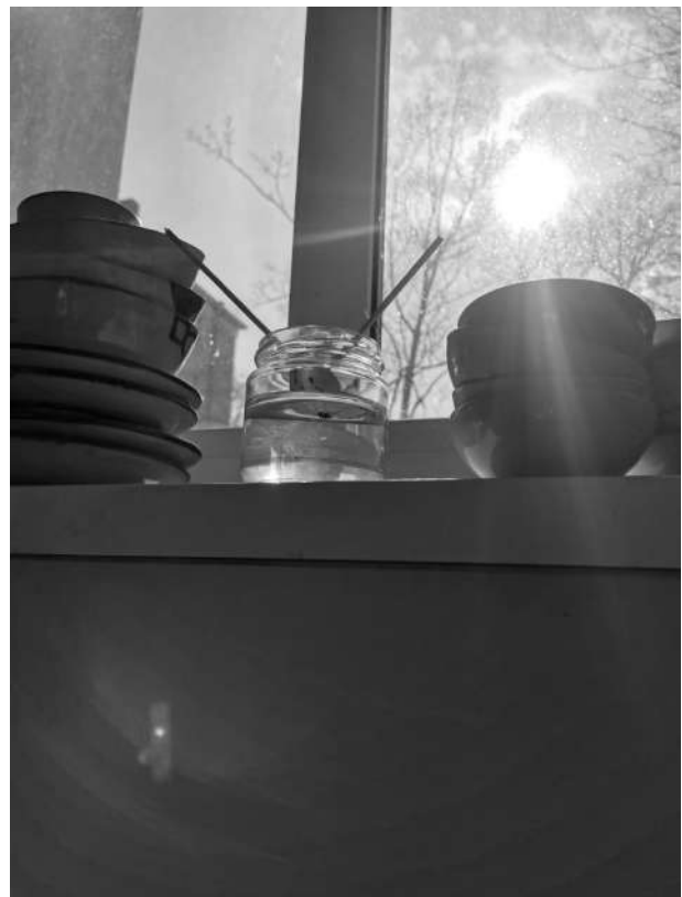
Hueso del aguacatero que tratamos de hacer crecer en el estudio