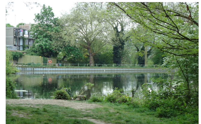
Hampstead. London, UK.