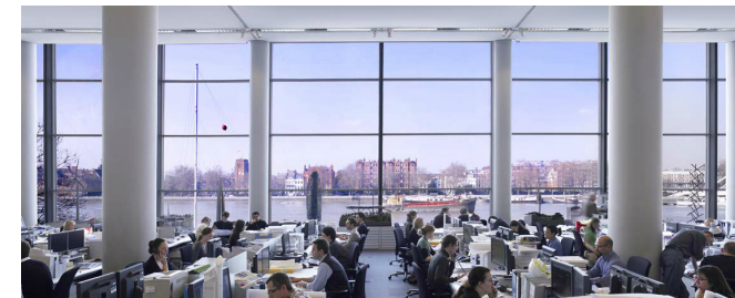
F+P Main building, London. Foster+Partners.