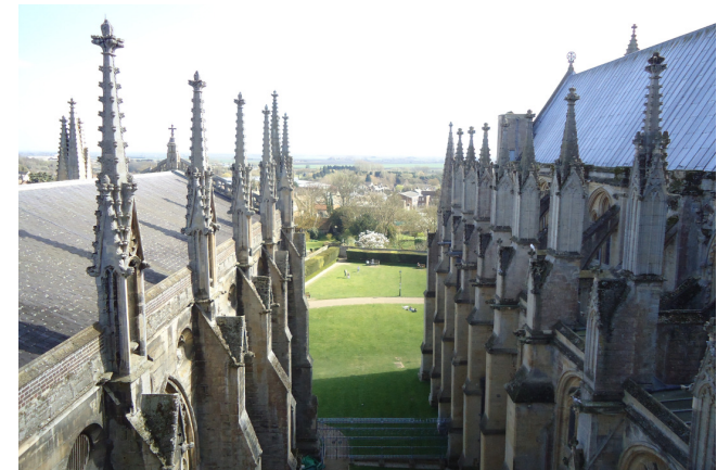
Catedral. Ely, UK.