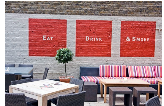
Pub The Prince Albert. London, UK