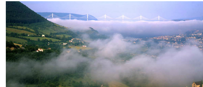
Millau Viaduct. Millau, Francia. Foster+Partners.