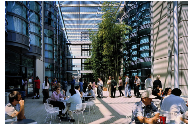
Center for Clinical Sciences Research. Stanford, USA. Foster+ Partners

Cuando terminamos con este proyecto me incorporé al proyecto del Hospital de Niños de Iowa , estaba en fase de diseño pero en este caso se estaba realizando para unos clientes. Esta vez he trabajado en un equipo más grande desde el inicio, incluso hemos trabajado con oficinas externas. Es un proyecto complejo por el programa y las necesidades de los clientes, es un reto conseguir los resultados que los jefes de diseño y el cliente esperan. En este proyecto he colaborado en la realización de diagramas sobre el funcionamiento de un hospital, plantas, maquetas y el plan de ordenación. Es un proyecto muy interesante y también complicado porque debemos mantener el edificio existente y conectarlo con lo nuevo.