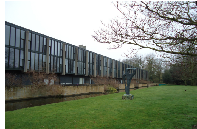
St Catherine's College. Oxford, UK. Arne Jacobsen