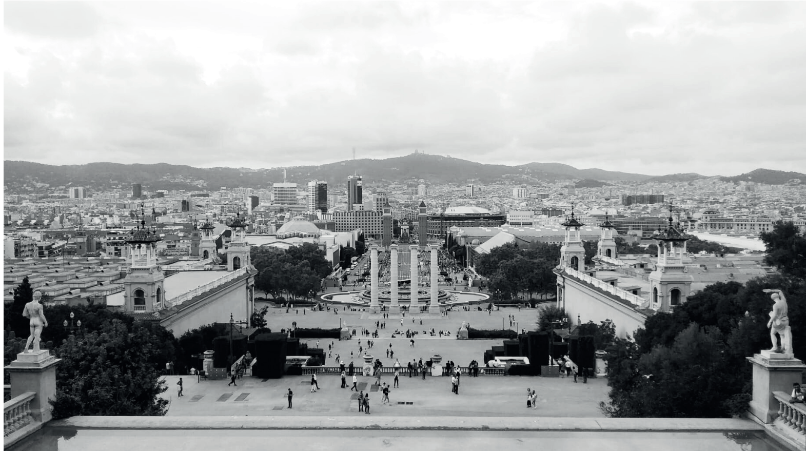
Vistas de la fuente mágica de Montjuic y Plaza España, desde del Museo de Arte Nacional de Cataluña.

Barcelona es una ciudad que inspira, que atrapa por su actividad y por su historia. Recorrer su ensanche, perderte en el trazado de sus calles o contemplar su extensión desde las alturas, son tres escenarios diferentes que se pueden disfrutar de la ciudad condal. Una ciudad viva, llena de posibilidades, que he podido disfrutar con la mejor compañía: el equipo de becarios, las amigas que ya tenía en Barcelona y las nuevas amista-