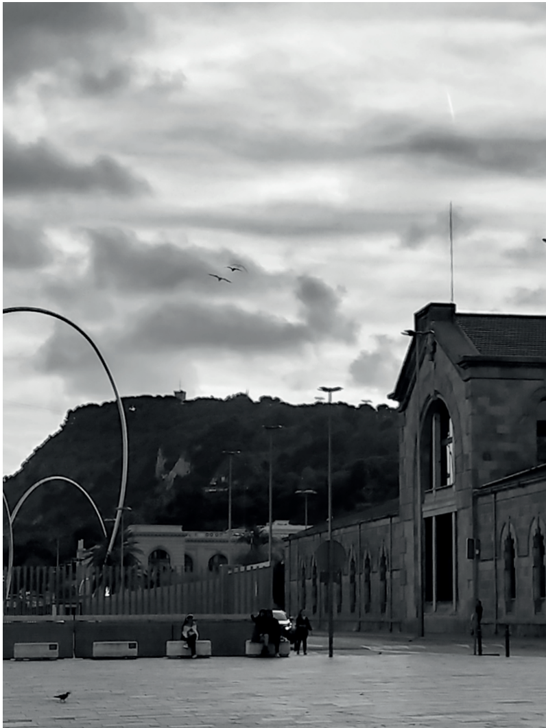
Vistas al monte de Montjuïc desde el puerto de Barcelona.