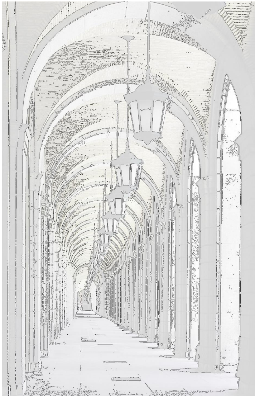
"La Arquería" de Zuazo del M.I.T.M.A.