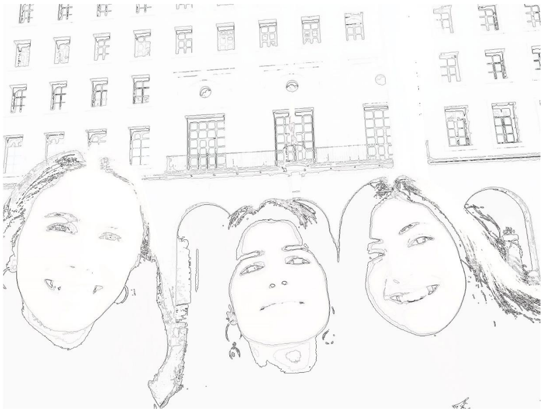
El primer día en el Ministerio de Transportes Movilidad y Agenda Urbana