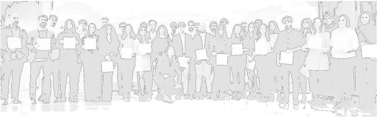
Ganadores de la Beca Arquia 2019