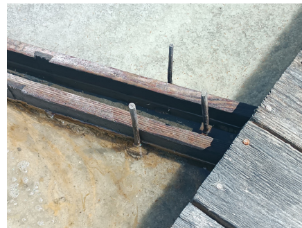
Detalle de canal entre salinas