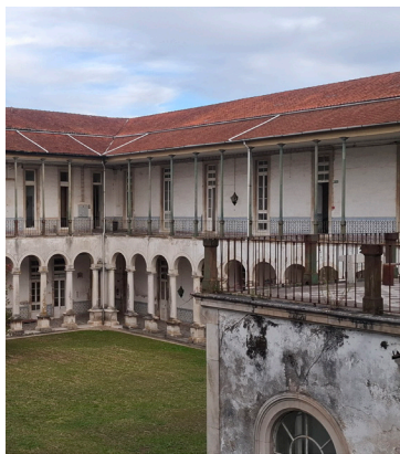
Interior del DARQ de Coímbra