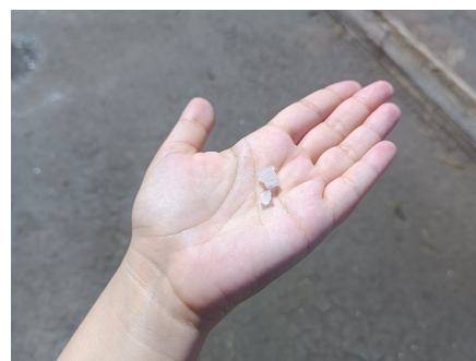
Escamas de sal en la mano de Inês