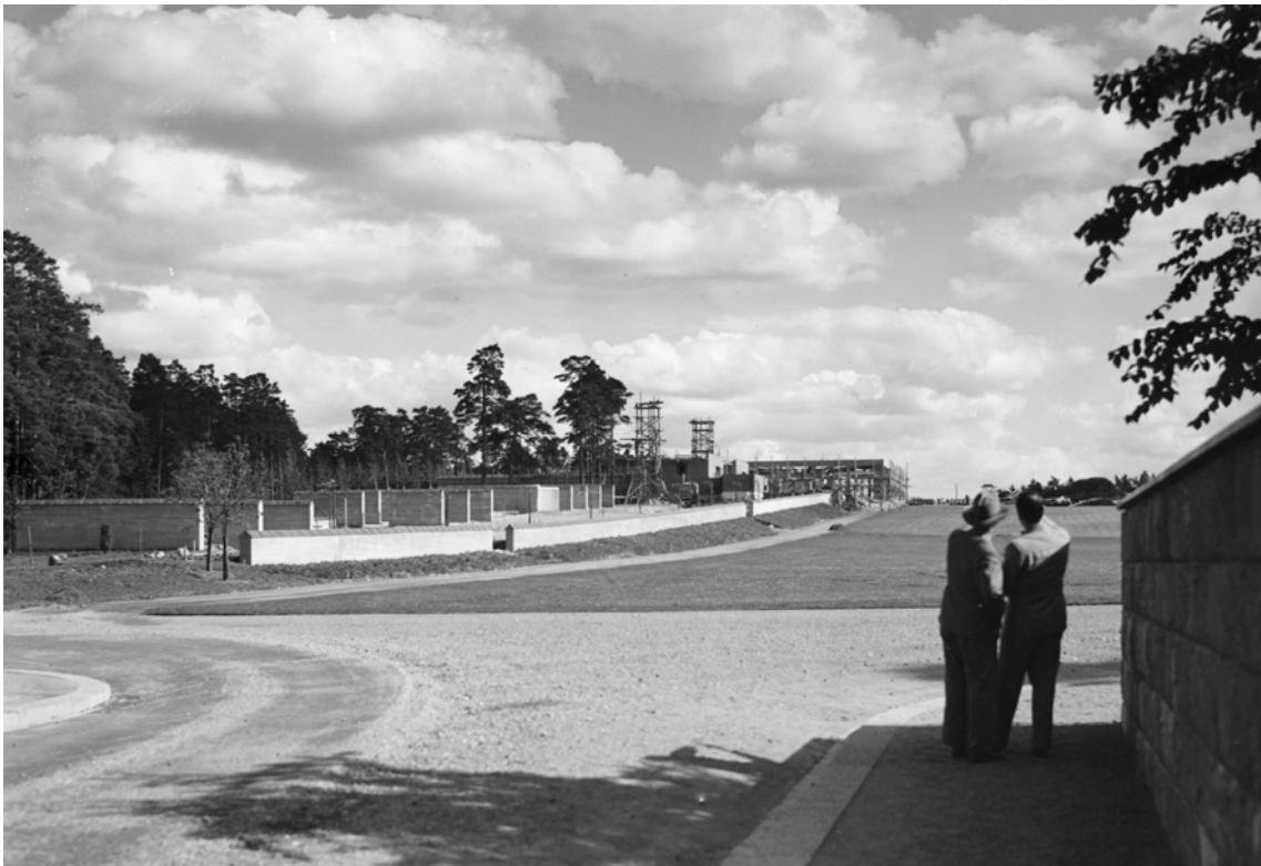
El Crematorio del Cementerio del Bosque durante su construcción en 1938