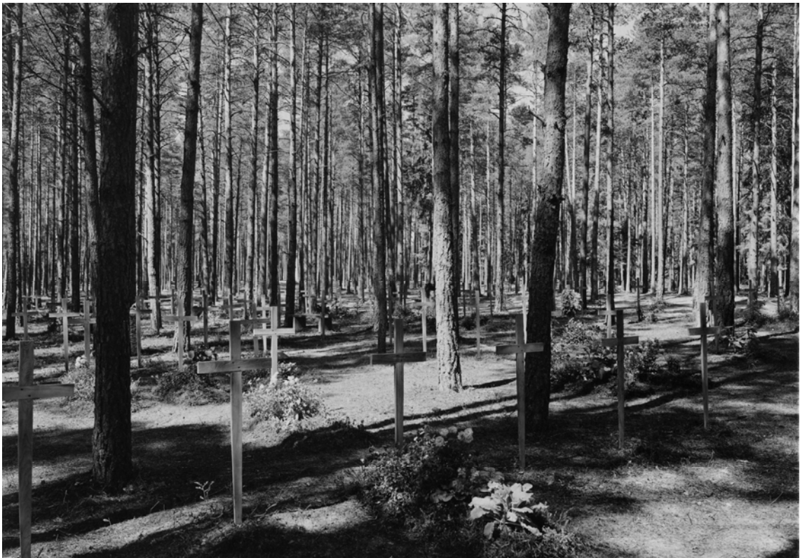
Tumbas del Cementerio del Bosque