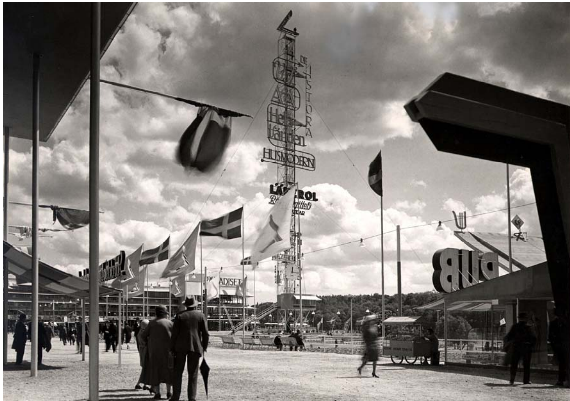
Mástil y Explanada de la Exposición Universal de Estocolmo diseñados por Lewerentz y Asplund respectivamente