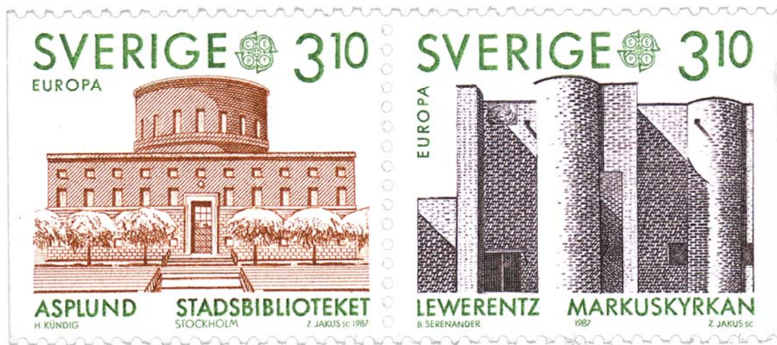
Imagen de Portada: Tumbas Malmström –Lewerentz- y Rettig –Asplund- del Cementerio Norte de Estocolmo, 1929 Imagen de Contraportada: Sellos con motivos de la Biblioteca de Estocolmo -Asplund- y la Iglesia de Björkby – Lewerentz-