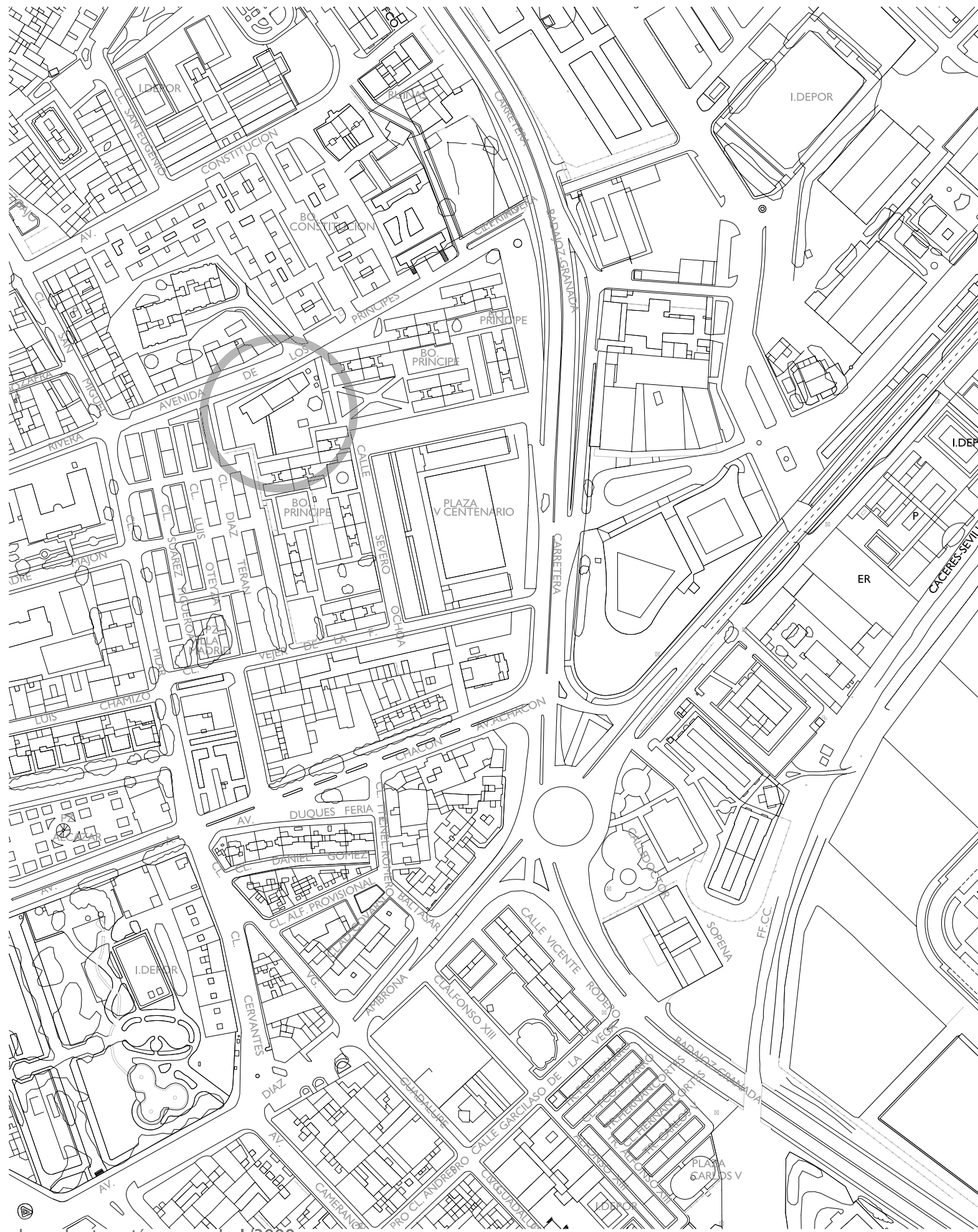
plano de situación escala 1/3000