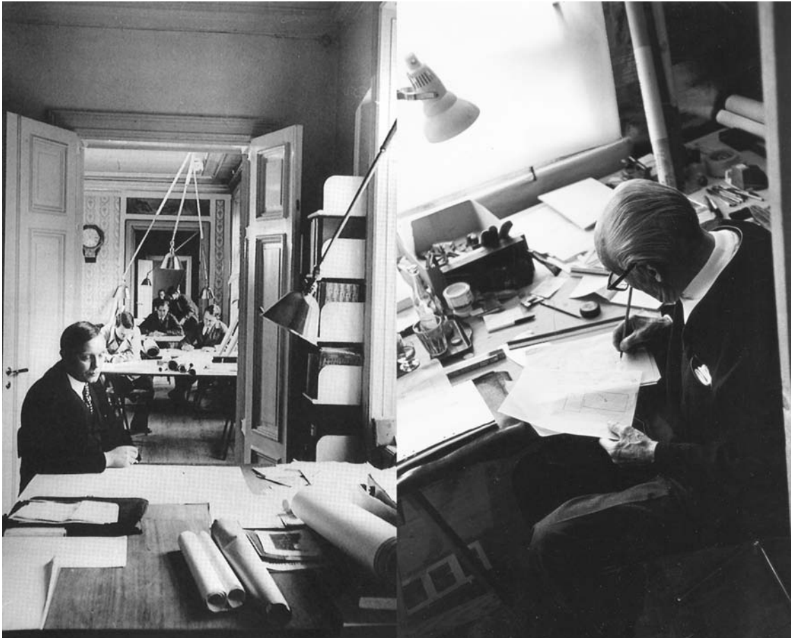
Asplund y Lewerentz en sus estudios de la calle Regeringsgatan de Estocolmo y de la calle Mellangatan de Skanör