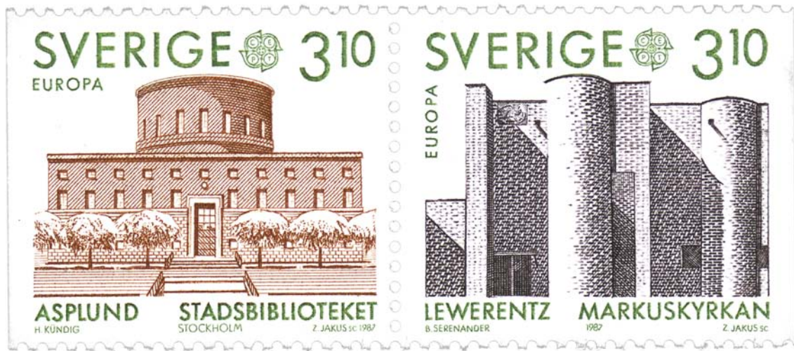
Imagen de Portada: Tumbas Malmström –Lewerentz- y Rettig –Asplund- del Cementerio Norte de Estocolmo, 1929 Imagen de Contraportada: Sellos con motivos de la Biblioteca de Estocolmo -Asplund- y la Iglesia de Bjorhagen – Lewerentz-