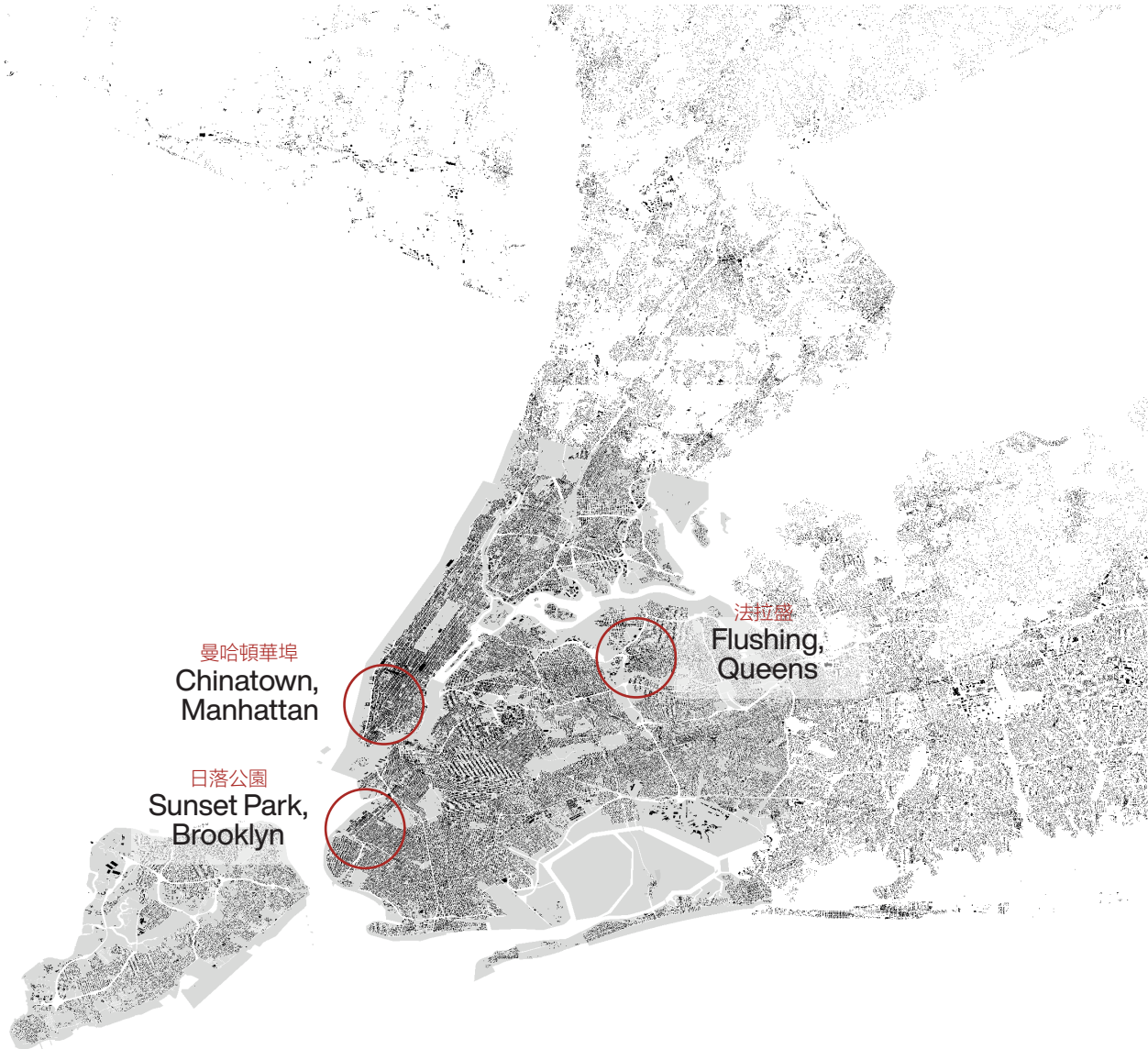
Mapa de elaboración propia. Proyección Equal Earth, adoptada como gesto deliberado: aunque a escala urbana su efecto es imperceptible, la investigación reivindica su uso sistemático frente a las proyecciones que distorsionan las superficies del Sur global. Datos: NYC Open Data ( https://data.cityofnewyork.us ). E: 1/250.000