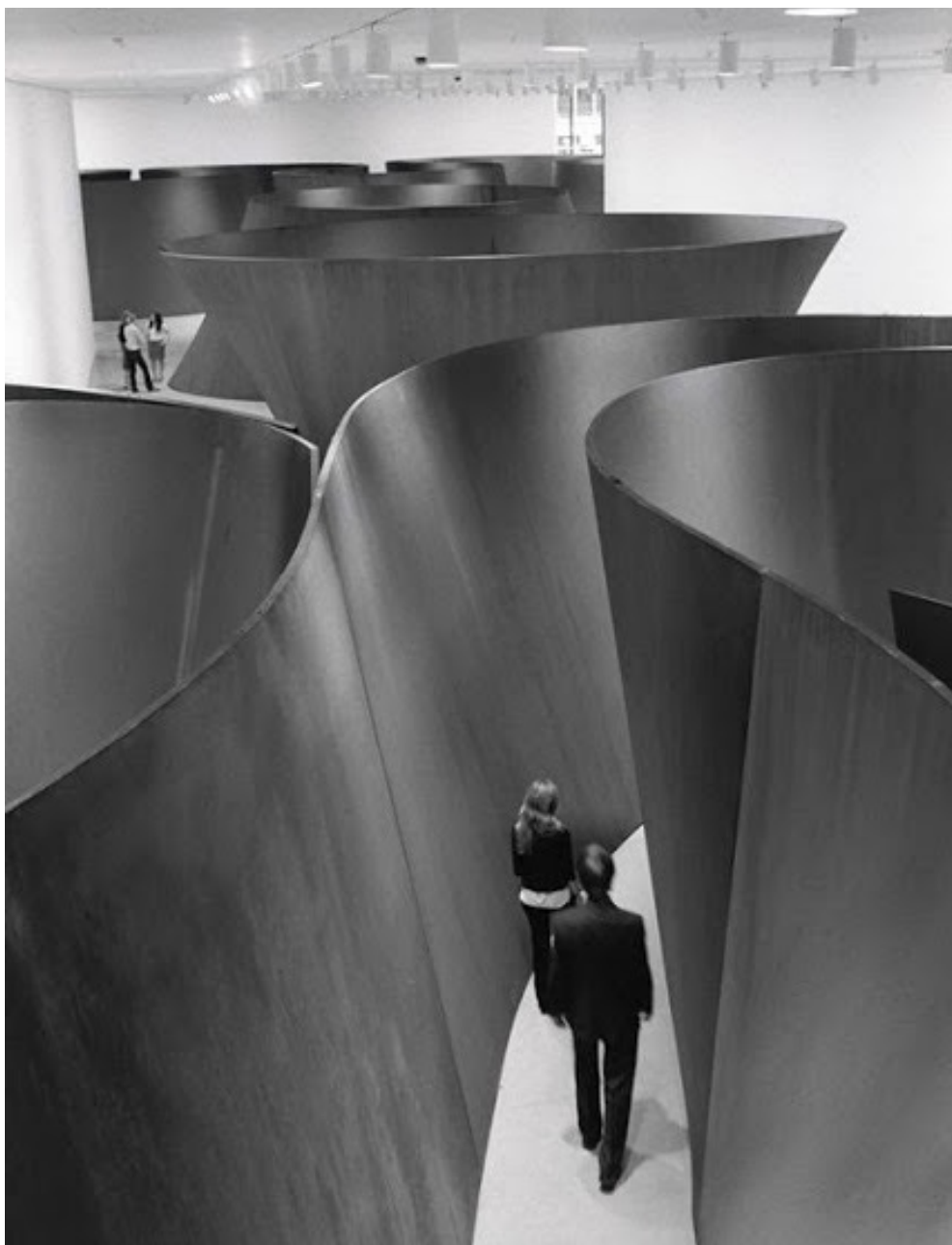
1. Richard Serra. Interior de Open Ended (20107-08). 2 The Matter of time. Museo Guggenheim de Bilbao. (2005)