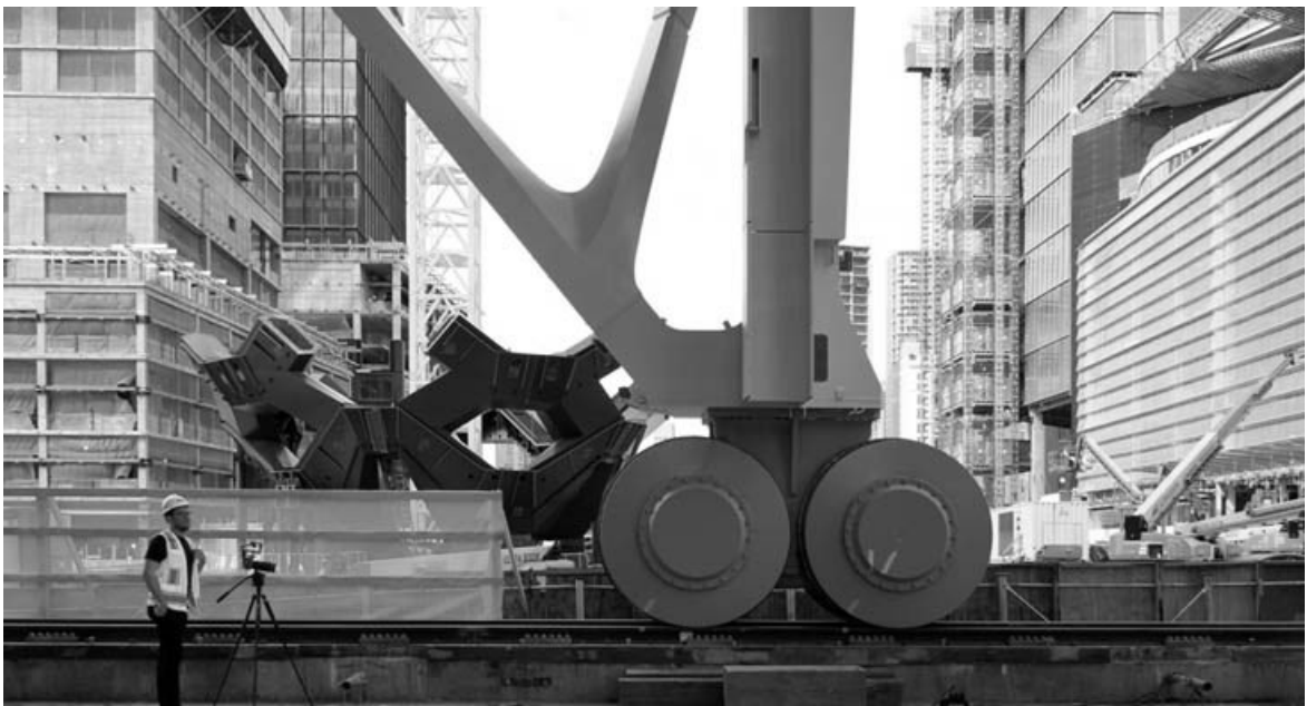
1. The Shed Museum. Elevation. Diller Scofidio + Remfro. 2018. 2 The Shed Museum under construction 2018