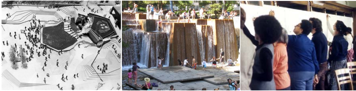
Lovejoy Plaza, Portland, Oregón, 1967. “Les Dalles of the Lovejoy” Imagen: Portland City Archives. Ira Keller Fountain, Portland, Oregón. Fotografía: Charles Birnbaum, 2008. The Cultural Landscape Foundation. Taller en Morningside Park, Harlem, Columbia, New York, 1970. Imagen: LHC.

Halprin, procesos participativos, ciudad, arquitectura, proyecto urbano, planeamiento.