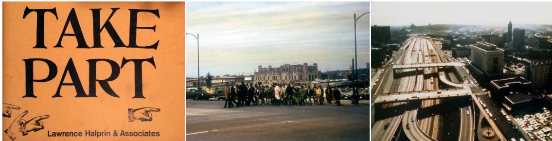
Portada del libro Take Part . HALPRIN, Lawrence; and Associates. LH&A, 1972. Taller participativo en Tulsa, Oklahoma, circa 1970. Imagen: LHC, 014.VI.47G702-Tulsa Mall WS. Interestatal-5 antes de la construcción del Seattle Freeway Park, ca. 1970. Imagen: LHC.

Cleveland-1973. En la tercera se define la metodología de los procesos Take Part . En la última sección, se discuten los resultados obtenidos y se apuntan nuevas perspectivas, se contextualiza una crítica de los procesos estudiados desde la praxis contemporánea para abrir vías de aplicación en la sociedad de hoy, se proponen nuevos caminos de investigación y se detallan las conclusiones.