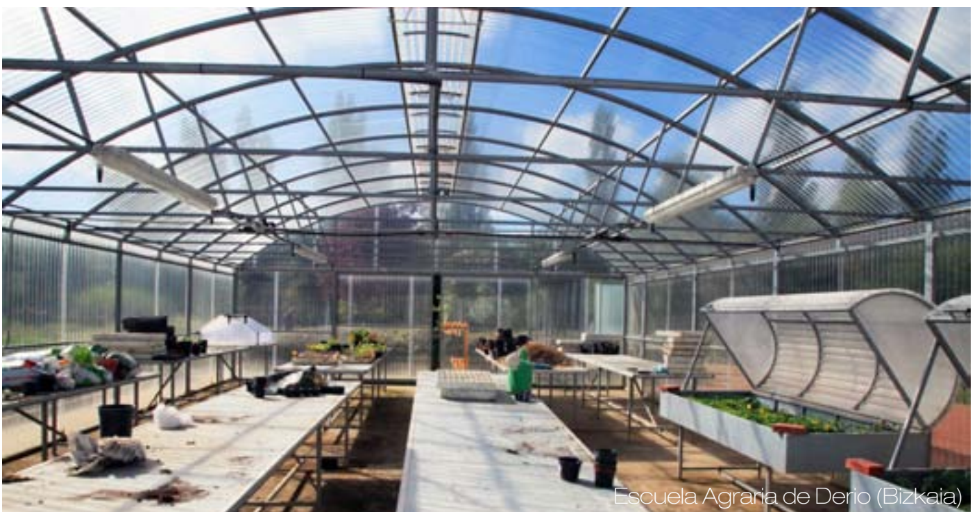
Escuela Agraria de Derio (Bizkaia)

Se plantea que una parte de los terrenos activados puedan ser visitados por el público en general para su sensibilización, y también por otros colectivos problemáticos que deseen acercarse a la ecología. De este modo, también se podrían facilitar colegios, centros de mayores, personas que deseen iniciarse en esta actividad, como desempleados, personas en riesgo de exclusión etc.