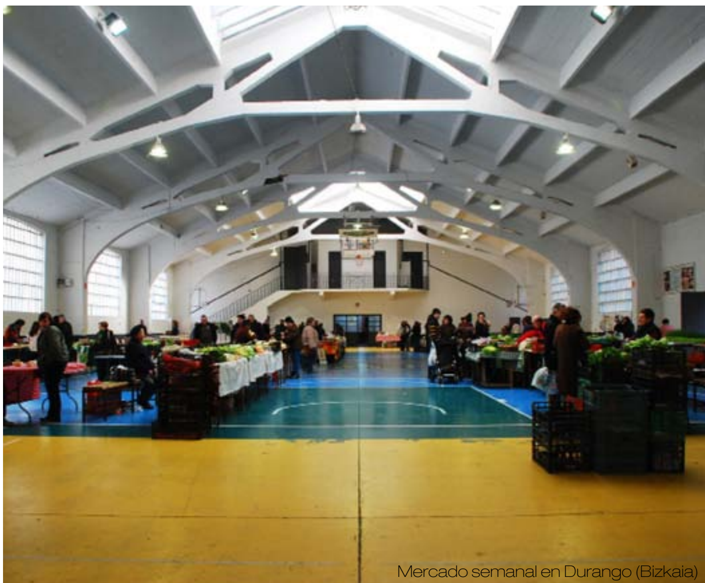
Mercado semanal en Durango (Bizkaia)

Por otro lado se propone que parte de la venta se realice de manera directa en una o varias tiendas permanentes asociadas (ubicadas en los espacios de cultivo de Iturrean etc) poniéndolo a disposición de consumidores particulares. Se propone, asimismo, el impulso y actualización de los mercados semanales en las localidades más representativas de las comarcas, adecuándolos en horarios etc para aumentar las ventas.