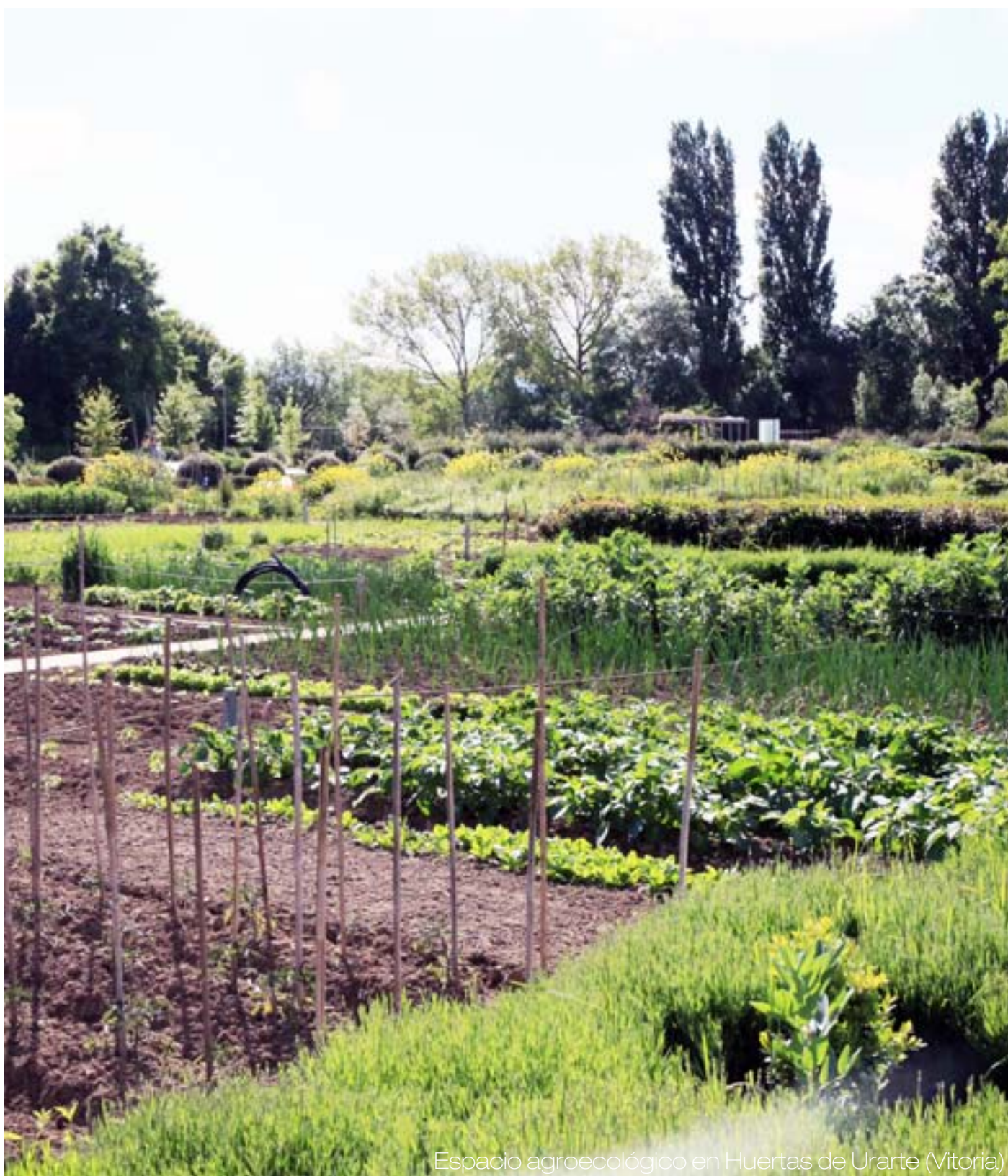
Espacio agroecológico en Huertas de Urarte (Vitoria)

El proyecto se desarrolla a partir de la generación de redes de personas y agentes, la activación de recursos en la zona (tierras de cultivo, espacios infrautilizados...) y la vinculación de proyectos educativos, de producción y comercialización con iniciativas relacionadas con otros sectores de promoción del ámbito rural como la gastronomía, la artesanía, el turismo o la investigación aplicada.