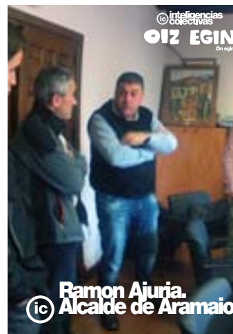
ic Ramon Ajuria, Alcalde de Aramaio