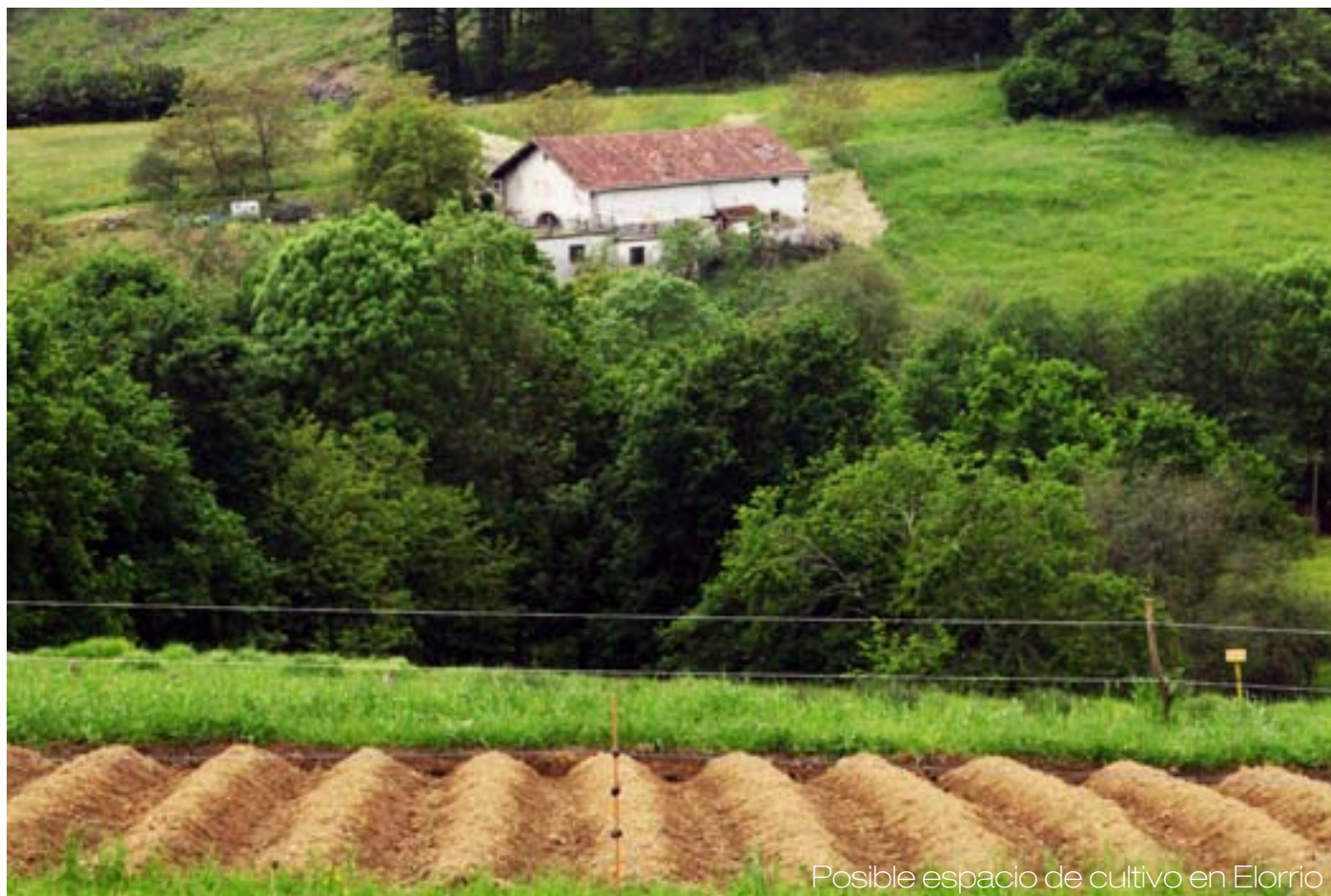
Posible espacio de cultivo en Elorrio

Además, se propone la realización de una exposición itinerante que comparta el proceso seguido desde el principio de la colaboración de Zoohaus "Inteligencias Colectivas" y las ADRs Urkiola y Lea-Artibai en septiembre de 2012. Esta exposición contendría desde la detección de inteligencias en las comarcas, hasta el proceso del OpenLab y la redacción y esquema base del proyecto Itaurrean. Esta exposición podría viajar por diferentes lugares tanto de las comarcas como otros espacios del estado e incluso se estudiaría su visibilidad a nivel internacional.