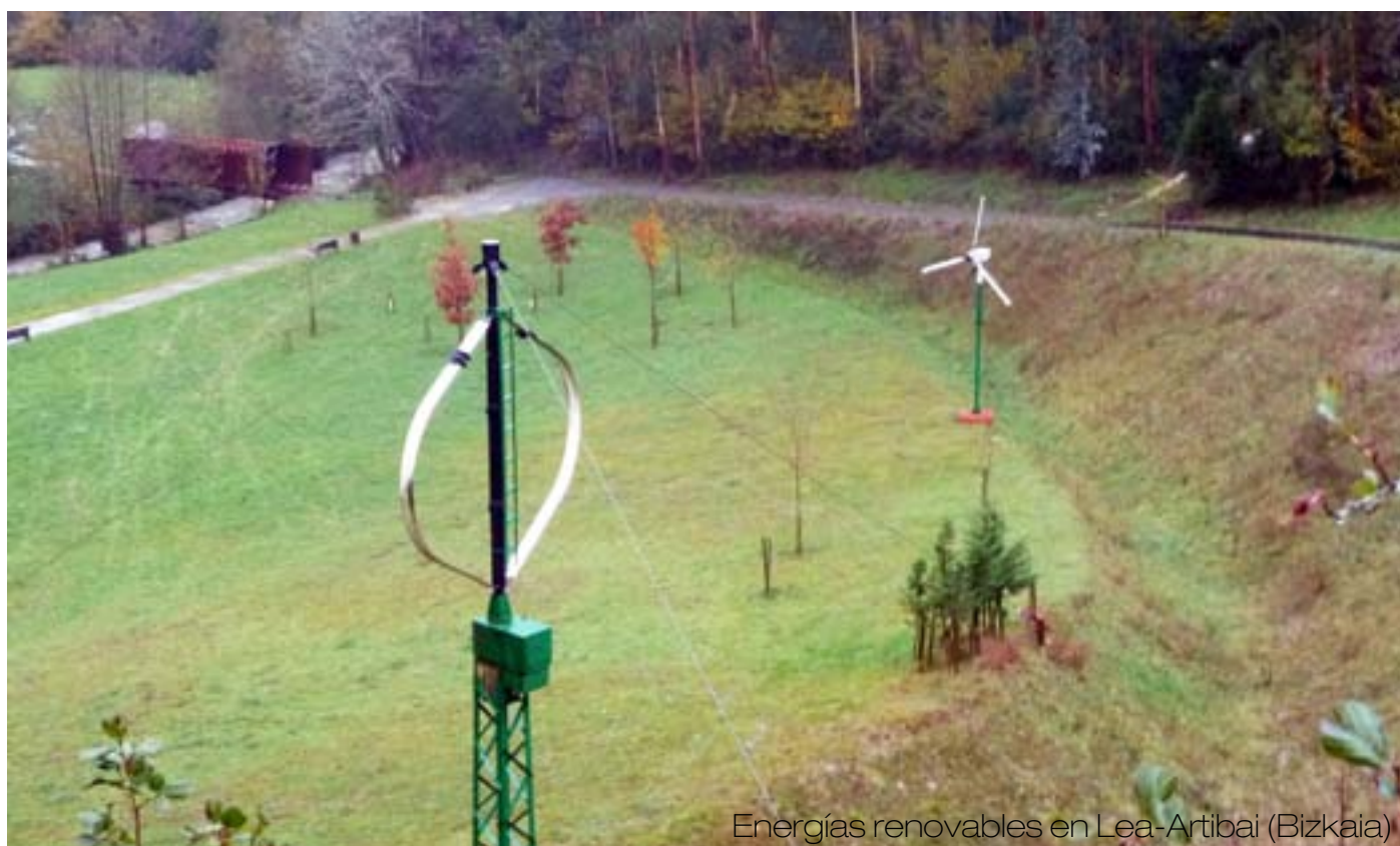
Energías renovables en Lea-Artibai (Bizkaia)

Entendemos que el proyecto, al alcanzar niveles de innovación importantes, podría resultar un atractor