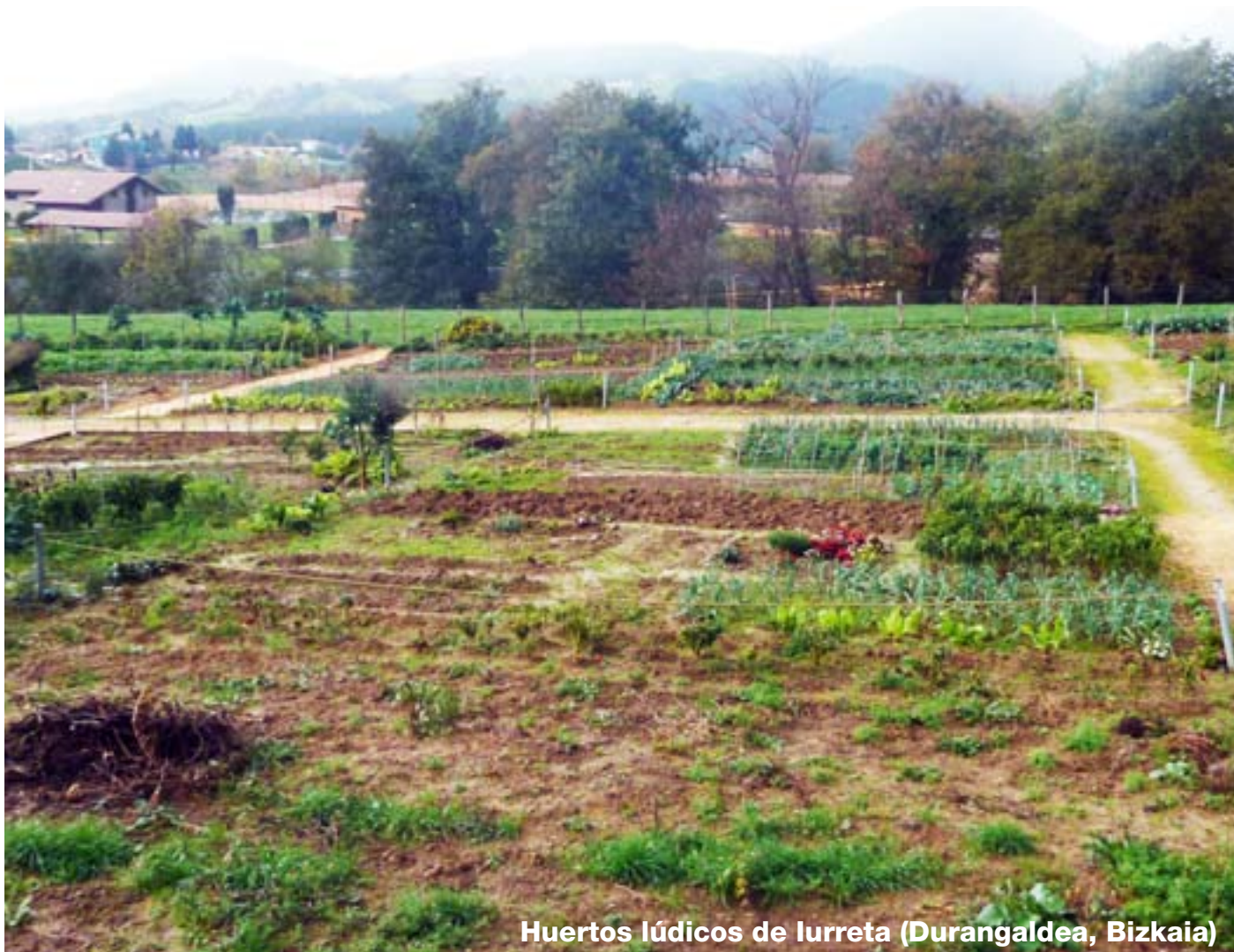
Huertos lúdicos de Iurreta (Durangaldea, Bizkaia)

Itaurrean se desarrollará a través de diferentes proyectos, algunos de los cuales pueden atender a campos vinculados a otros sectores, como la educación, el turismo, la gastronomía, las energías renovables, incluso la cultura etc. Es por ello que se plantea la microfinanciación de estas iniciativas parciales, de manera más sencilla y abarcable que el proyecto en su totalidad, y que ayudarán a construirlo en diferentes frentes, de manera más ágil.