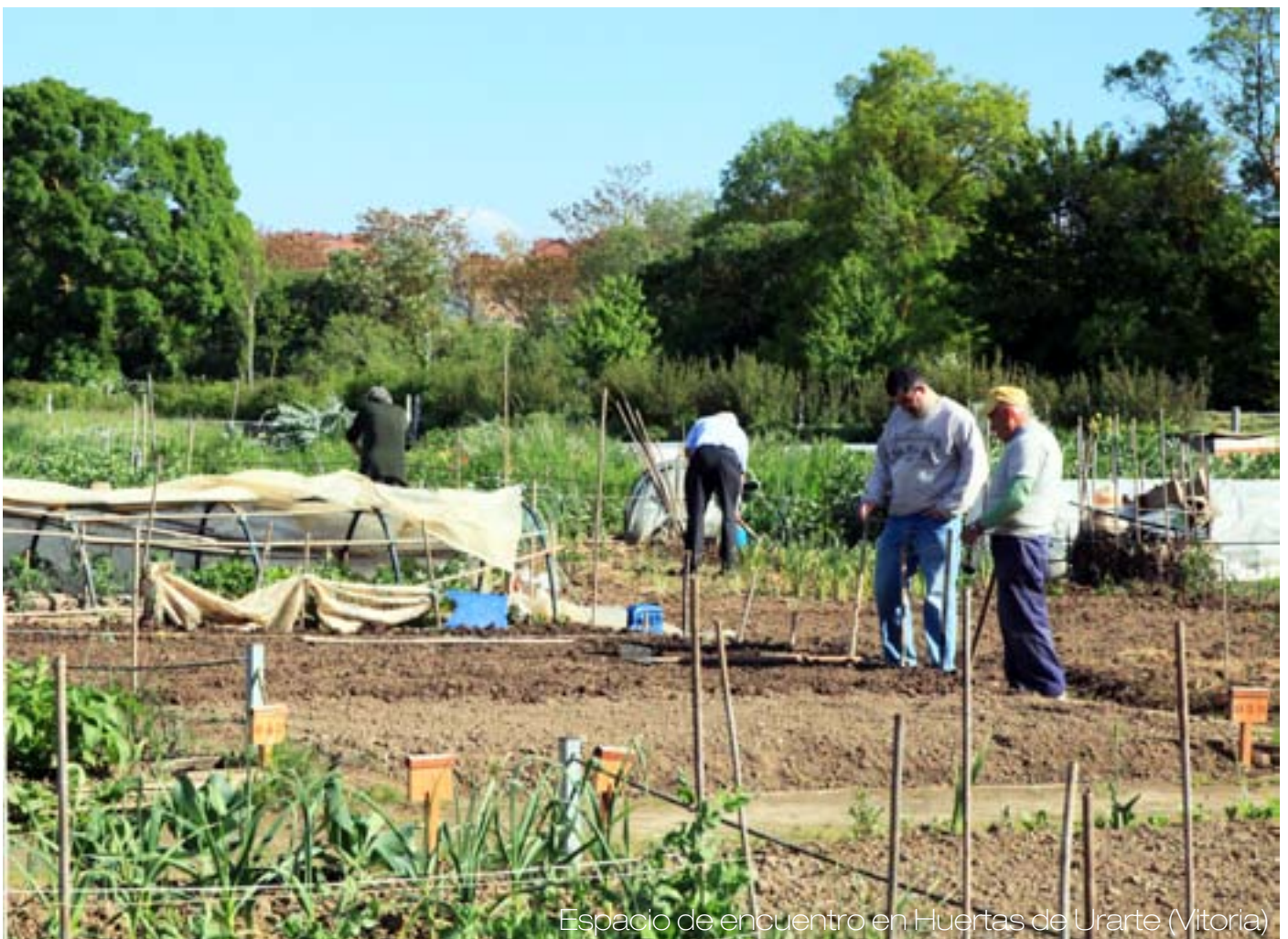
Espacio de encuentro en Huertas de Urarte (Vitoria)

+Establecer espacios físicos y digitales para la reflexión e investigación en torno a la producción y el consumo agroecológicos, vinculándolos con otras temáticas de interés para el mundo rural, como el turismo, la gastronomía o la educación.