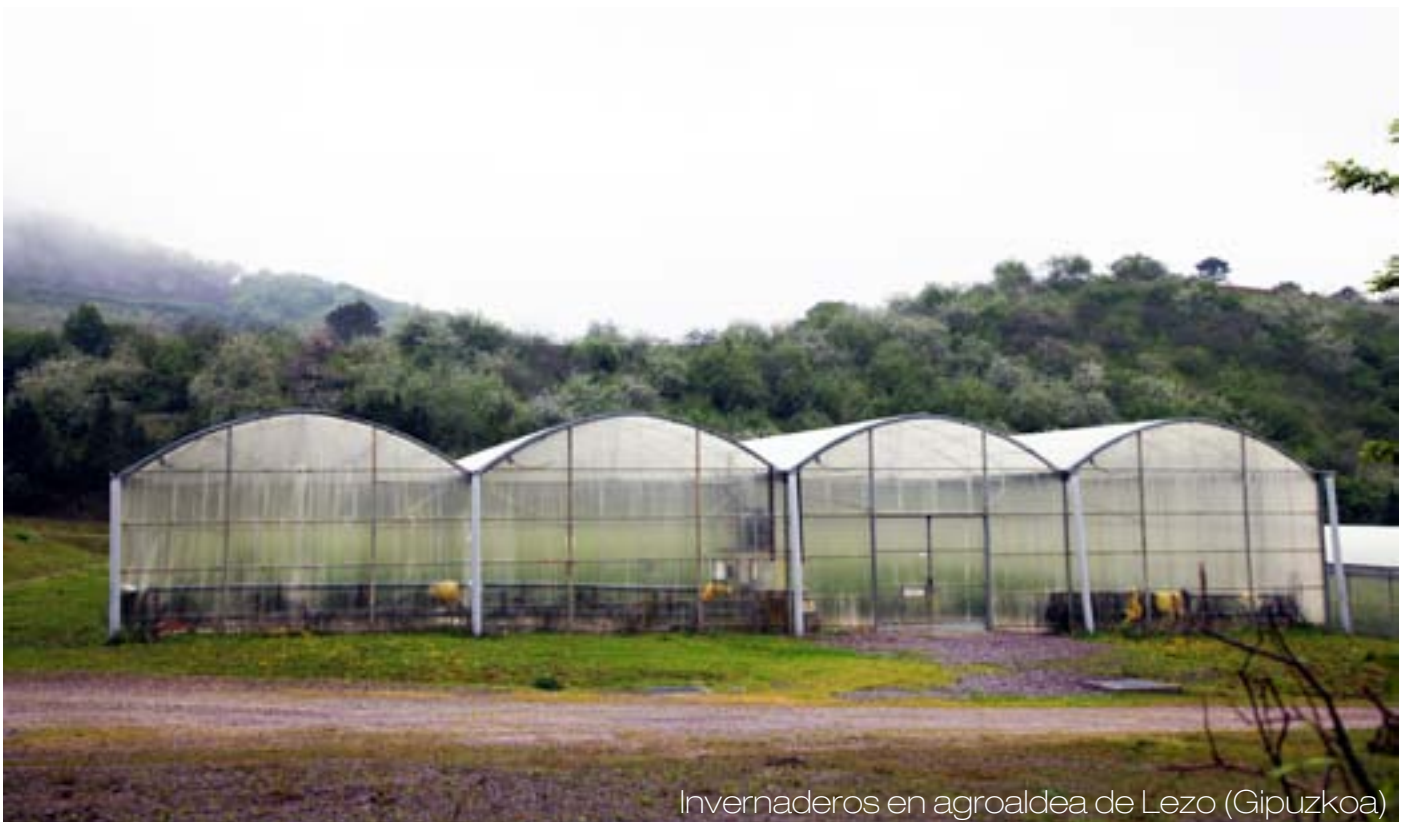
Invernaderos en agroaldea de Lezo (Gipuzkoa)

También podrían vincularse a la producción agroecológica otro tipo de producciones como huevos etc. En cuanto a actividades de transformación de productos (conservas, fabricación de pan, quesos etc) se evaluarán las necesidades de los agricultores en relación a la inversión necesaria.