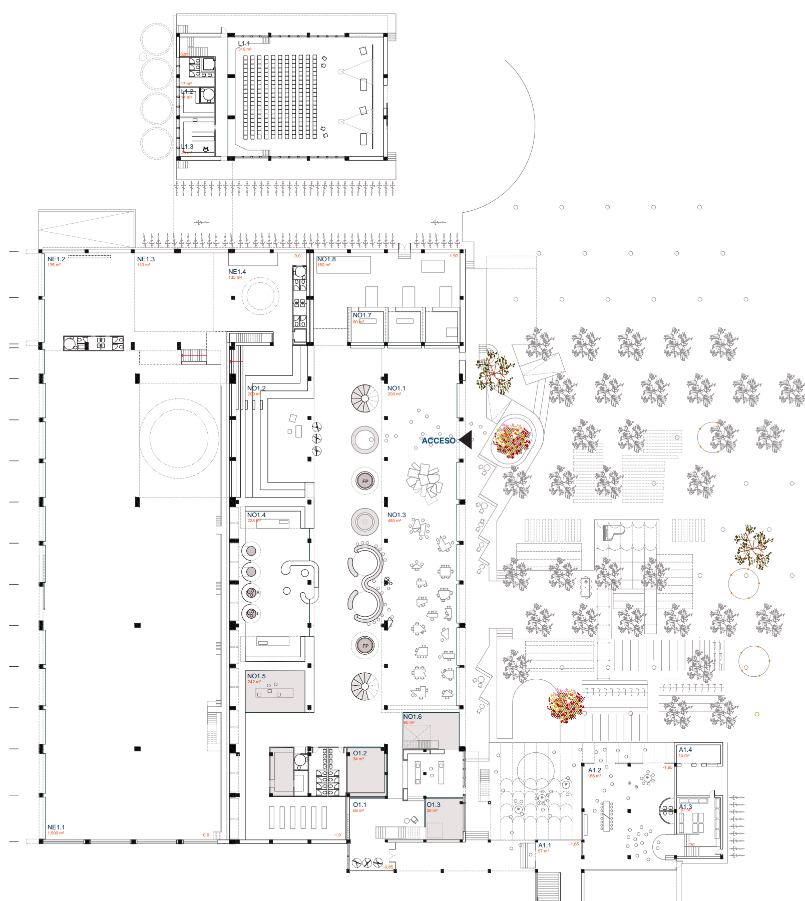
PLANTA BAJA niveles -1,90 / -1,65 / -0,85 / 0,0 E 1:500

El espacio de grada "suspendida" como transición funcional entre la nave este y el nivel superior de la nave oeste. Donde además incluimos una librería que la Fundación Arquia se compromete a llenar de contenido. Como indicamos al principio, es un lugar para estar tocando el piano por las mañanas , el hecho de que sea en pijama o no, dependerá de cada uno, pero seguro que es entre amigos y profesionales, a los que ya admiramos profundamente.