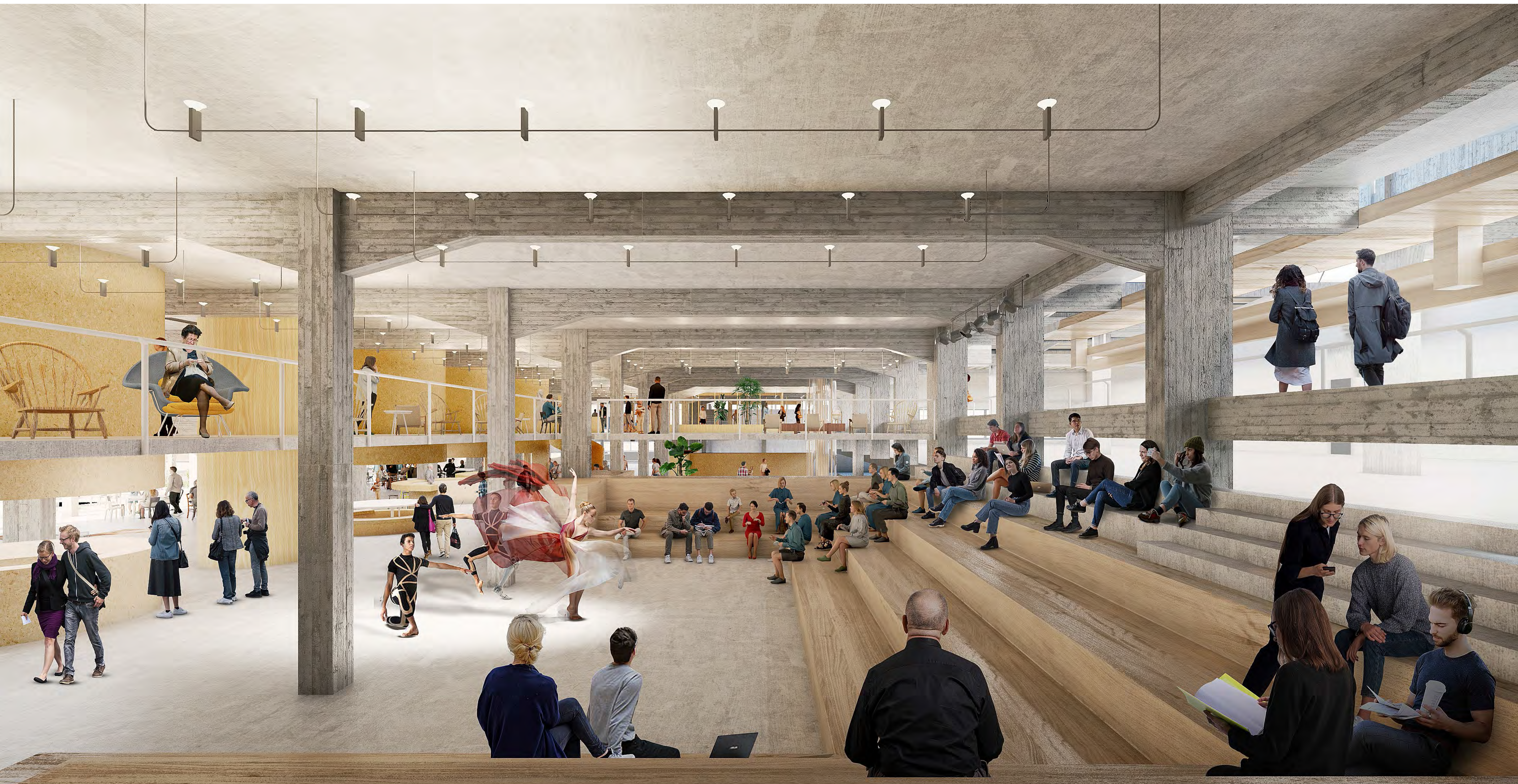
VISTA DEL INTERIOR DE LA NAVE OESTE NO 1.2 ESPACIO MULTIFUNCIÓN EN PLANTA BAJA