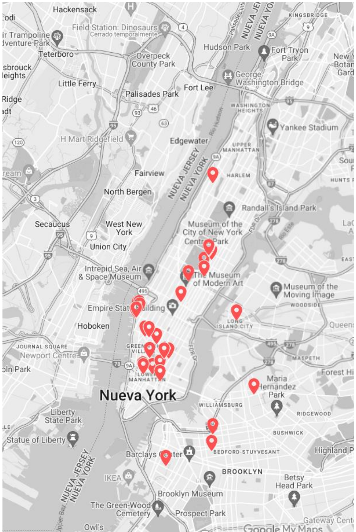
Fig. 4 Mapa de Encuesta a 24 Galerías de Nueva York. 2024.