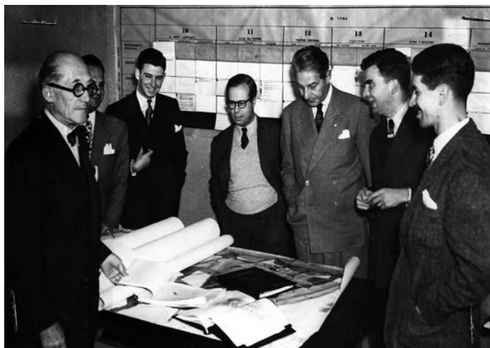
195.- Le Corbusier, Sert, Wiener, Carlos Arbeláez Camacho, Francisco Pizano de Brigard y otros funcionarios de la OPRB en la entrega del documento del Plan Piloto, de manos de Le Corbusier.

Como es lógico el documento original de la tesis y sus anexos deben ser editados con el fin de hacerla encajar en el formato de libro. Por lo tanto, en el caso de esta convocatoria las operaciones necesarias para la publicación de la tesis estarían relacionadas con la adaptación del texto, su contenido y las imágenes teniendo en cuenta las normas y estilo de la Colección Arquia/Tesis.