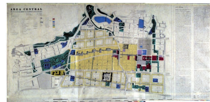
Cromos de las páginas del Dossier original del Plan Piloto. Encaje de la Región en el ámbito nacional y Plan Regional.