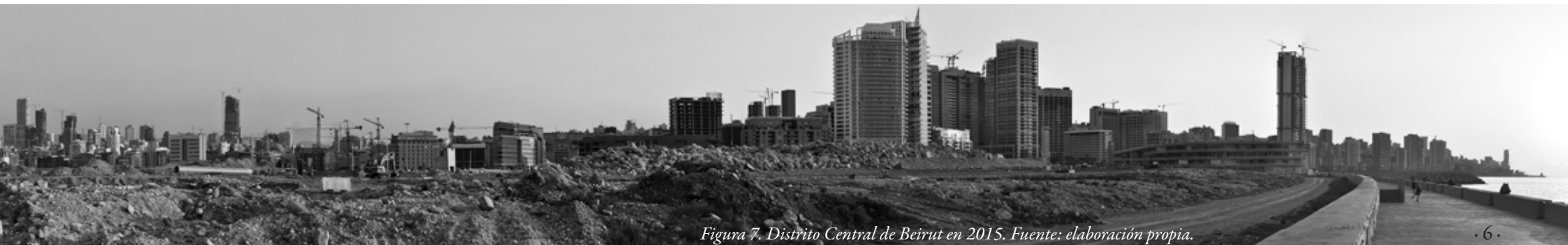
Figura 7. Distrito Central de Beirut en 2015.

En relación a la adecuación al nuevo formato de la colección, se considera que las imágenes incluidas en la tesis sobre los cambios y los procesos de incertidumbre acaecidos en los tres sistemas urbanos, pueden reproducirse en la edición de arquitecta/tesis a mayor tamaño, manteniendo en las páginas pares las imágenes y en las páginas impares el texto. En los capítulos o secciones donde se requiera, las imágenes también se podrán colocar en el área lateral de la página donde se ubican los pies de página y las citas. Gran parte de las imágenes incluidas en la tesis no han tenido difusión previa en la literatura hispánica puesto que se han obtenido de archivos en las ciudades de Ámsterdam, Sarajevo y Beirut. Así se cuenta con un gran número de imágenes y planos de archivo, mientras que otras imágenes son de elaboración propia realizadas durante las estancias en las ciudades y tienen carácter inédito, es el caso de los modelos morfológicos y topológicos elaborados sobre los tres sistemas urbanos.