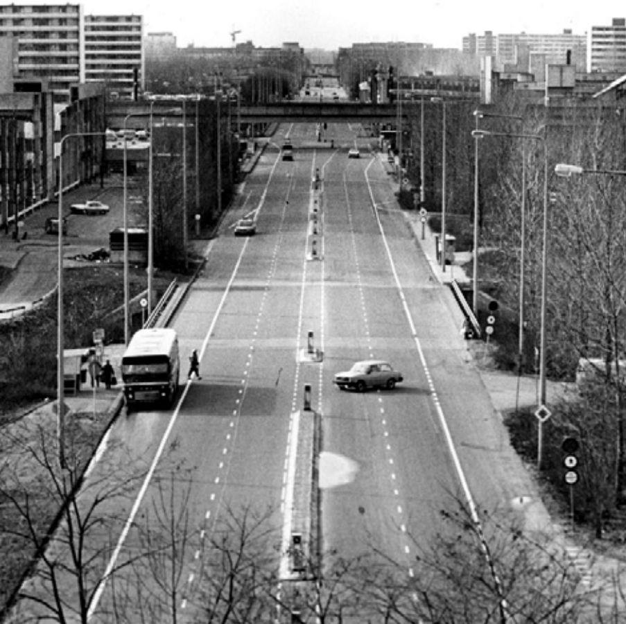
Figura 1. Bijlmermeer en los años 1970.

Gracias a la construcción teórica en torno al urbanismo de la seguridad y a la complejidad urbana se establece un método de análisis para sistemas urbanos en los que se haya producido un cambio en su forma urbana a la luz de la incertidumbre. El método recoge los enunciados extraídos de los marcos conceptuales sobre seguridad y complejidad aplicados en la ciudad y los distribuye asimétricamente en cinco fases consecutivas, pero de lectura sincrónica: forma urbana [1], aumento de incertidumbre [2], aplicación del dispositivo [3], cambio en la forma urbana [4], flujos de información [5]. Las cinco fases se aplican en el análisis de tres ensayos empíricos, identificados como tres sistemas urbanos con procesos de cambio bajo incertidumbre, que se analizan a través de modelos morfológicos y topológicos. Los tres sistemas urbanos seleccionados son el barrio residencial de Bijlmermeer en Ámsterdam, el barrio periférico de Dobrinja en Sarajevo y el Distrito Central de Beirut.