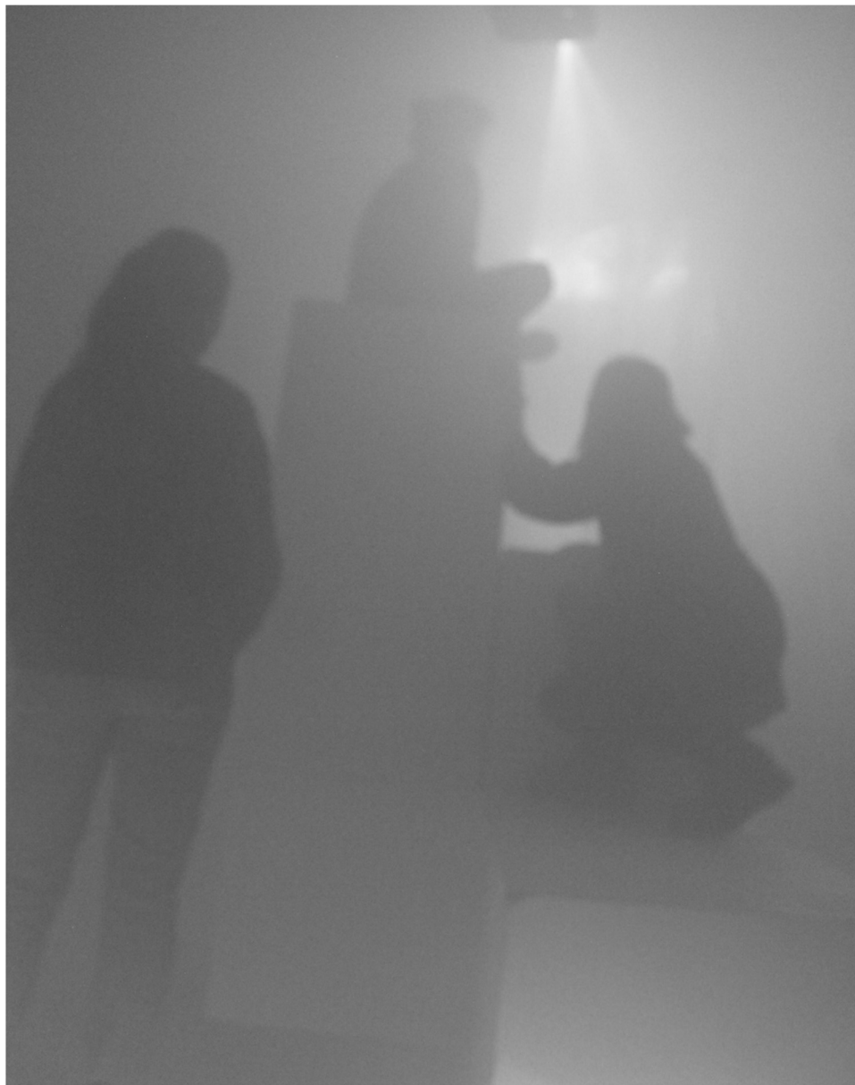
Figura 2. Imagen propia. Sucesos en una misma niebla. Distancias de percepción