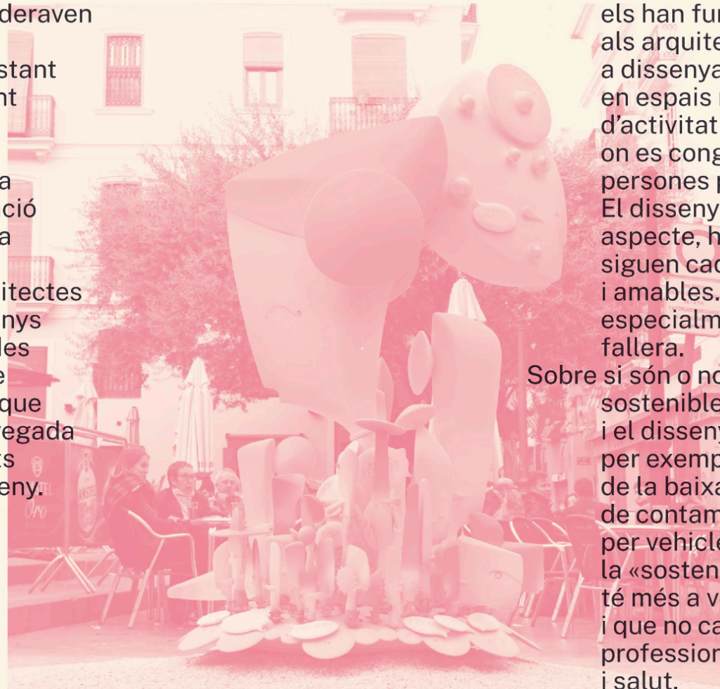
Falla Plaça del Dr. Collado El temps de les paraules , 2017 de Ricard Balanzá

Sobre si són o no les falles cada vegada més sostenibles, derivat de la innovació i el disseny (de l'urbanisme, per exemple), parlen alguns estudis de la baixada de les emissions de contaminació produïda per vehicles... Però, per a mi, la «sostenibilitat» actual a les falles té més a veure amb el «sostenir-les», i que no caiguen... Deformació professional, tradicional, seguretat i salut.