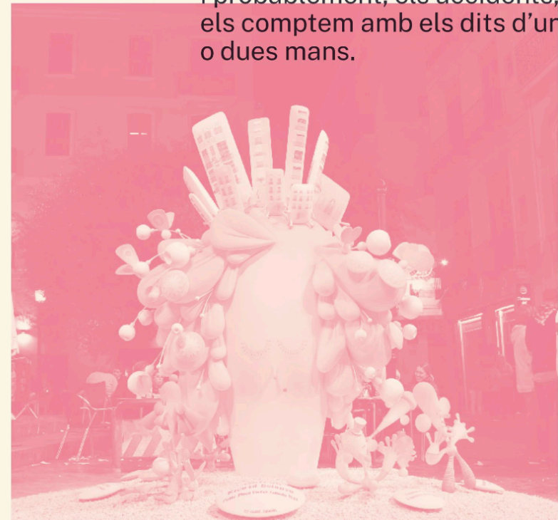
Falla Plaça del Dr. Collado Plena de Goig , 2019 de Ricard Balanzá

Encara que és cert que moltes falles han patit caigudes per pluja, vent, o fins i tot per inestabilitats estructurals, continua sense ser necessari una firma d'un tècnic competent. Però, per altra banda, s'han fet milers i milers de falles al llarg de la història i probablement, els accidents, els comptem amb els dits d'una o dues mans.