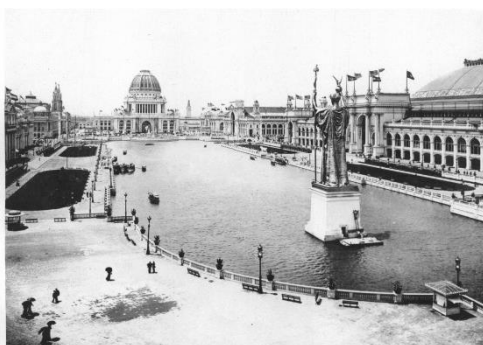
Figura 7: El relato íntimo desaparece del mapa en la exposición (Arnold, 1893)