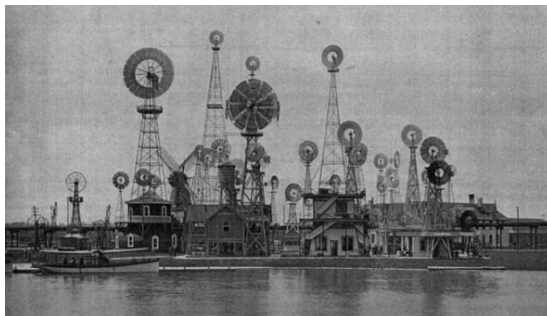
Figura 8: El relato se acerca a la escala tangible en esta parte de la exposición (1893)

El modelo espectacular de la exposición universal se expande también hacia la difusión de la ‘ arquitectura doméstica ’ (sic) en periodo de posguerra: La cocina pasa de los bastidores a la puesta en escena, despojándola de cualquier rastro de vida cotidiana. Ni objetos, ni rotos, ni descosidos. Unas imágenes de felicidad doméstica que perpetúan la cultura heteropatriarcal y de consumo 17 . El binomio razón-deseo se territorializa en público-privado .