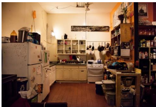
Figura 3: Lo ordinario como práctica emancipadora (Crenshaw, 2015)

R. es aficionada al teatro. Organiza pases libres en un espacio de creación, independiente de los circuitos convencionales del arte y el mercado actual: MAs House también es su casa 4 . Se constituye no solo como proyecto cultural, sino como una comunidad de afectos y cuidados donde los usos de cada metro cuadrado se entretejen y mutan día a día.