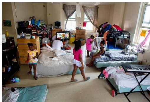
Figura 1: Refugio en Brooklyn (Fremson, 2013)

«You are required to vacate this property within 72 hours». S. arrienda desde hace 12 años en Brooklyn con su hija. El propietario quiere desalojar el inmueble para elevar el alquiler a los próximos inquilinos. Hoy cuenta su caso en un espacio comunitario, donde se reúne una de las 50 organizaciones por la vivienda de Nueva York. Llevará allí sus muebles, sus pertenencias, si no paralizan el desahucio. Un +1 en el listado de 12,302 familias que duermen en los refugios de la ciudad 2 . Su nueva casa: un rizoma.