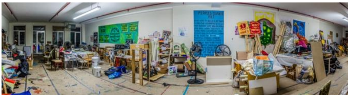
Figura 2: Arquitectura para el arte low-cost comunitario (Mayday Collective, 2014)

A. y M. son de Brooklyn. En 2013 se lanzaron a la aventura del 'DoItYourself, DoItWithOthers': «Una casa para el pensamiento crítico y el debate» 3 , un espacio de encuentro autogestionado por la propia comunidad. Vecinos y colectivos han reformado dos inmuebles para la materialización de eventos culturales, reuniones, talleres, huerto urbano o cafetería.