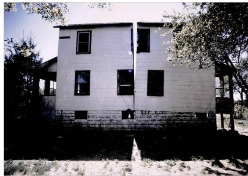
Figura 10: Splitting , el acto de dar luz a lo cotidiano, 'lo común' (Matta-Clark, 1974)

medida, a la retícula abstracta. Matta-Clark desterritorializa lo doméstico en 'Splitting' y la propiedad en 'Fake Estates' . Bisecta el American Dream eludiendo el método de representación disciplinar: Si la sección representada insiste en separarse y ser separado, la sección territorializada desvela las sombras de las copertenencias. Sección versus domesticidad compartida 22 . El corte es la puerta entreabierta entre lo instituido y lo instituyente, lo 'común' , la subversión de la disciplina, el rizoma, la revuelta.