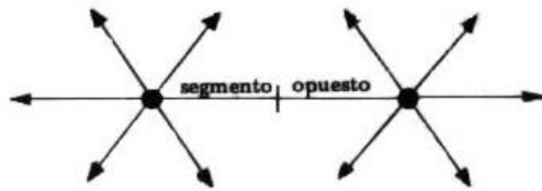
Figura 4: Articulación A-B, Institucional-(versus)-doméstico (Pacotte, 1936)

Iniciamos una deriva intramuros desde la ‘policy’ estadocéntrica instituida, en el presente perpetuo ‘ensanchado’ a partir de la conformación misma de Estado (Unido) en la era del espectáculo 10 . Nos desprendemos pues de la cronología arquitectónica para mapear un cartograma sin orden, jerarquía o inicio-fin. Escogemos relatos de ese continuum sin pretender abarcar “la” realidad.