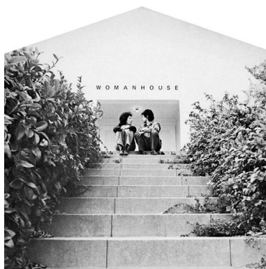
Figura 9: Womanhouse, la ‘casa’ como espacio de copertenencia (Woodman, 1972)

«La osadía [de Womanhouse] no consiste únicamente en la salida platónica y la ascensión hacia el exterior; más allá de eso supone una reafirmación del territorio doméstico en un territorio completamente extraño». (Berbel, 2015) 20 .