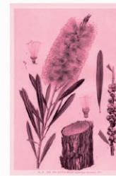
Limpiatubos, Escobillón rojo Callistemon spp.