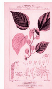
Morera del Japón / Morera del papel Broussonetia papyrifera