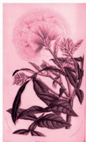
Albizia Albizia procera