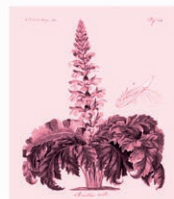
Acanto Acanthus mollis