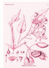
Brachichiton / Árbol Botella Brachychiton populneus