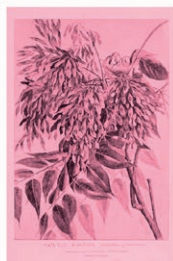
Ailanto / Árbol del Cielo Ailanthus altissima

Para facilitar la identificación y caracterización de las especies vegetales hemos desarrollado una herramienta de reconocimiento asistido mediante una clave de identificación que permite determinar las especies sin necesidad de ser un experto botánico. La base de datos que soporta esta funcionalidad cuenta en la actualidad con más de 400 especies, y crece día a día gracias a la labor de los propios usuarios.