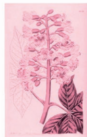
Castaño de Indias rojo Aesculus x carnea