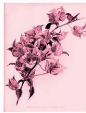
Buganvilla Bougainvillea spp.