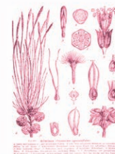
Casuarina Casuarina equisetifolia