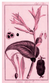
Achira Canna spp.