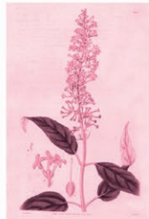
Arbusto de las mariposas Buddleja madagascariensis