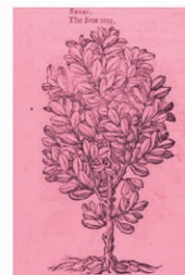
Boj balear Buxus balearica