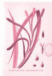
Carex Carex pendula