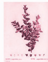
Boj Buxus sempervirens