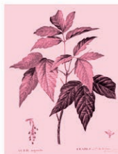
Arece Negundo Acer negundo