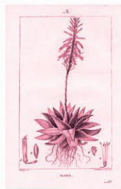
Pita Real Aloe maculata