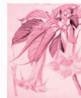
Floripondio Brugmansia arborea