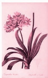
Agapanto Agapanthus umbellatus