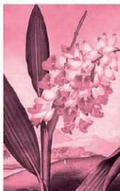
Alpina Alpinia zerumbet