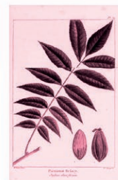
Nogal Americano / Pacanero Carya illinoensis