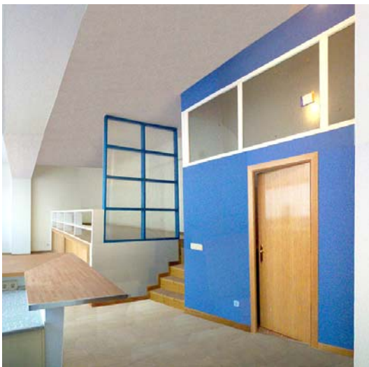
Reutilización de una nave industrial en Madrid y transformación en dos viviendas.