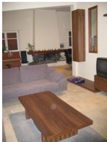
Ampliación de la vivienda ocupando el bajo cubierta y construcción de escalera de acceso.