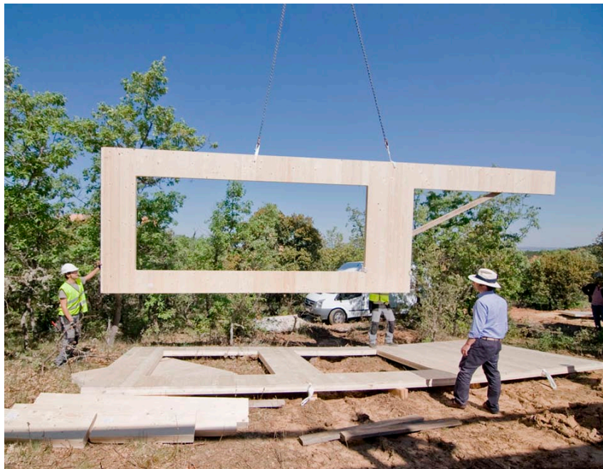
Casa EX (en construcción).

«Nothingness», guiones instantáneos y archivos operativos. Mayo 2011