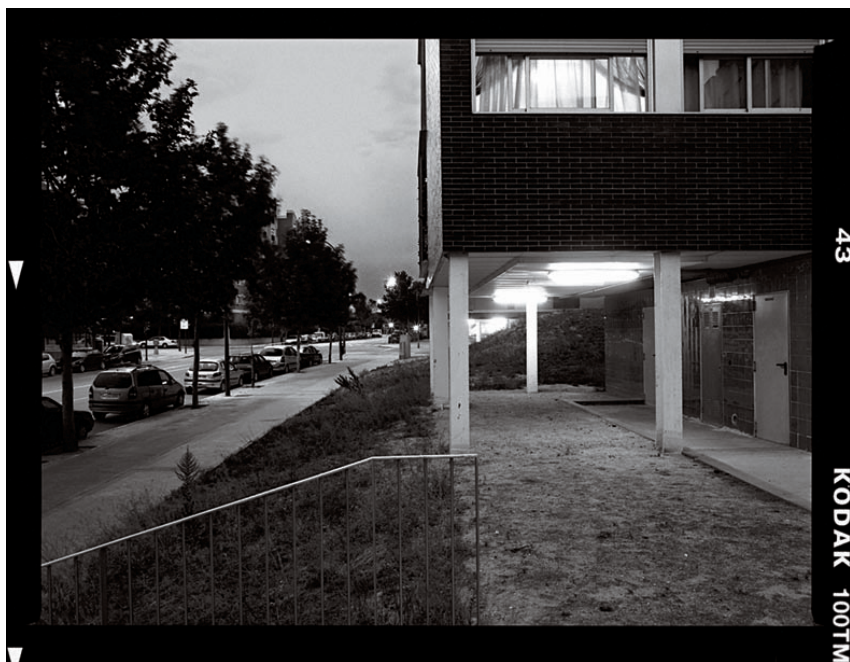
Viviendas en la M-40.