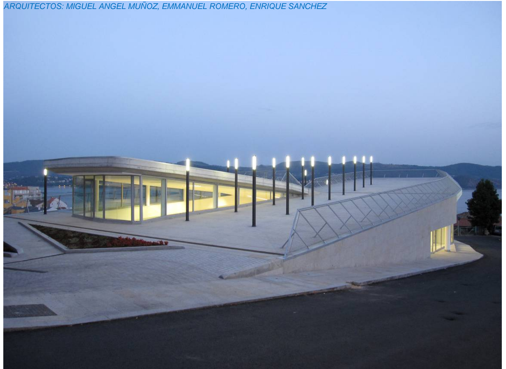
CASA DA CULTURA "XAIME ISLA COUTO" RAXÓ · CONCELLO DE POIO (PONTEVEDRA)

ARQUITECTOS: MIGUEL ANGEL MUÑOZ, EMMANUEL ROMERO, ENRIQUE SANCHEZ