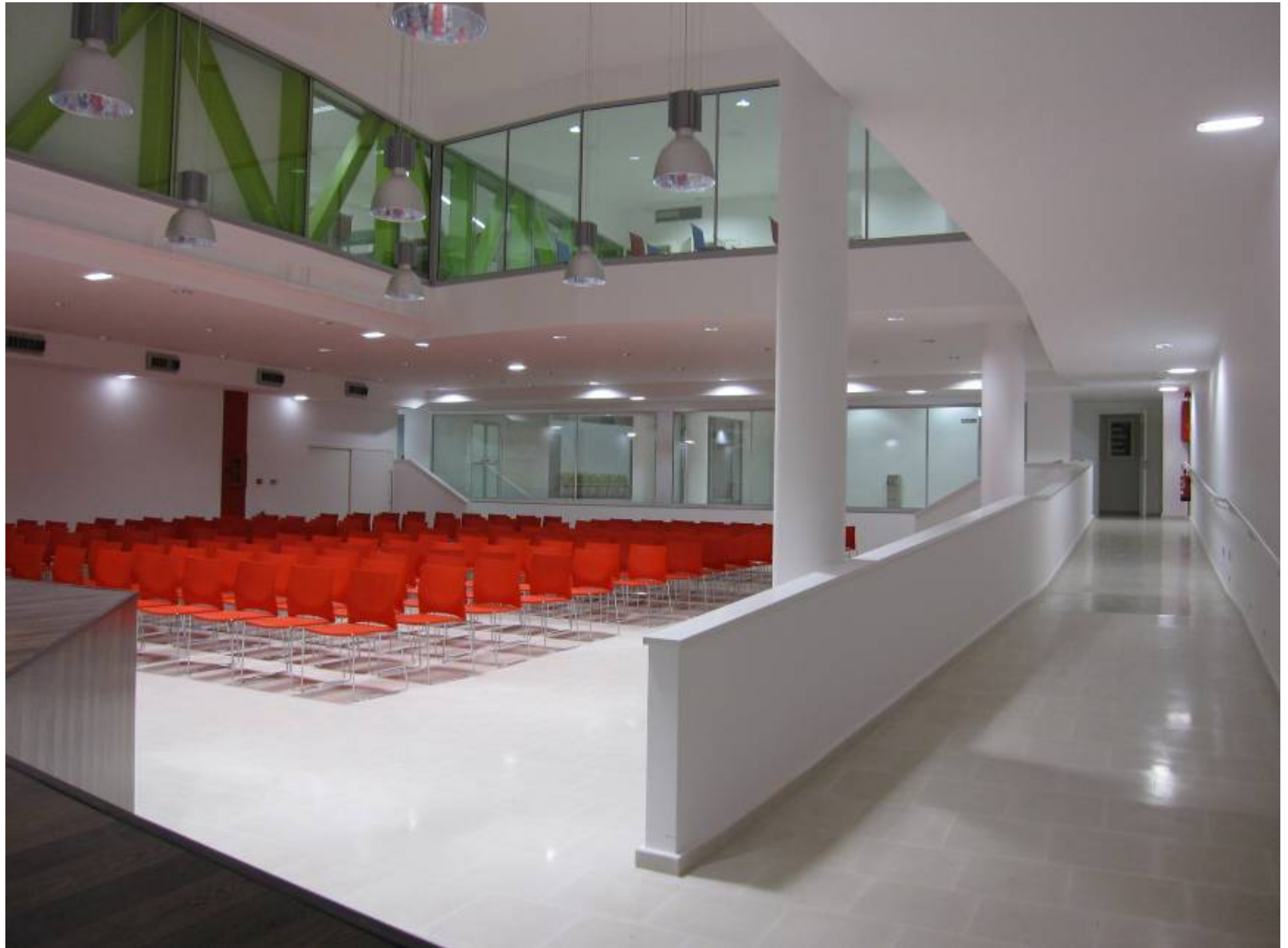
CASA DA CULTURA "XAIME ISLA COUTO" RAXÓ · CONCELLO DE POIO (PONTEVEDRA)