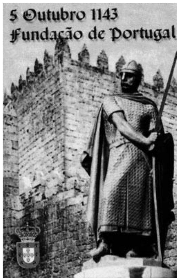
▲ Imag.2 – Cartel conmemorativo del Centenário da Fundação de Portugal

La política de intervención en monumentos nacionales – y, específicamente, en fortificaciones medievales – empezó a ser considerada una marca ideológica del Estado Novo , originando varias reacciones sarcásticas por parte de los opositores al régimen dictatorial. En la época contemporánea, el misticismo que recayó sobre la verdad de las intervenciones restaurativas suscitó frecuentes perplejidades e incomprensiones, a menudo de índole ideológica, entre las generaciones que conocieron las fortificaciones ya restauradas y suelen pensar que siempre fueron así, y las (cada vez menos) personas que asistieron y todavía se acuerdan de las intervenciones restaurativas del Estado Novo , y los ecos detractores del régimen acerca de los actos generalizados de reinvención de las fortificaciones. Esto dio lugar a un debate apremiante sobre las intervenciones en las fortificaciones medievales portuguesas para procurar esclarecer diversos puntos fundamentales, como por ejemplo el contexto en el que se situaron los castillos medievales en el imaginario cultural portugués, el papel desarrollado por las diversas ideologías culturales, políticas, socioeconómicas y otras en su percepción, y el modo en el que influenciaron los procedimientos y soluciones de las intervenciones patrimoniales realizadas en Portugal.