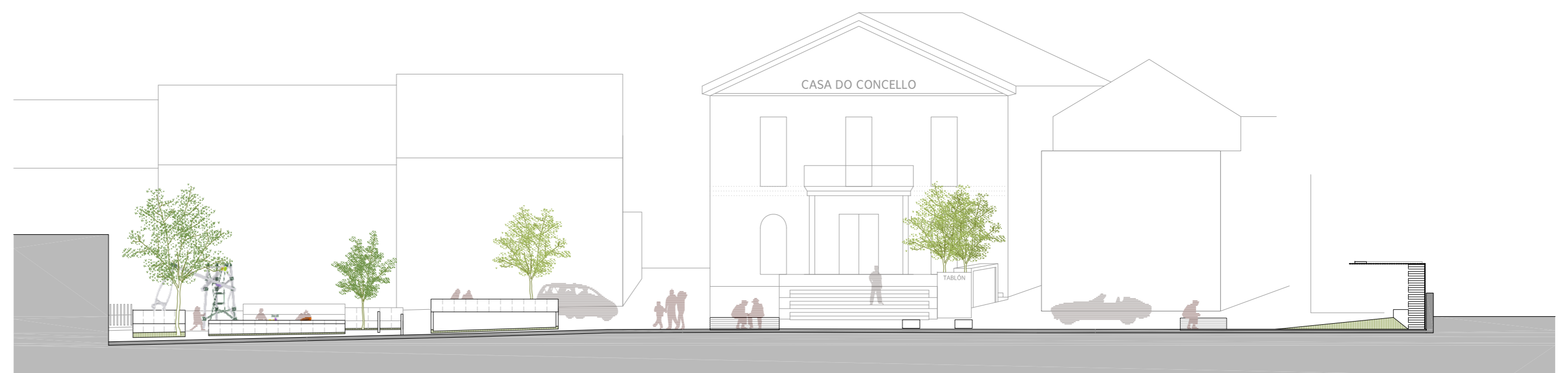
sección C 1:175