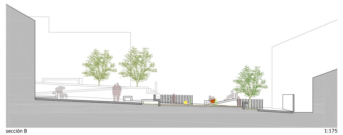
sección B 1:175