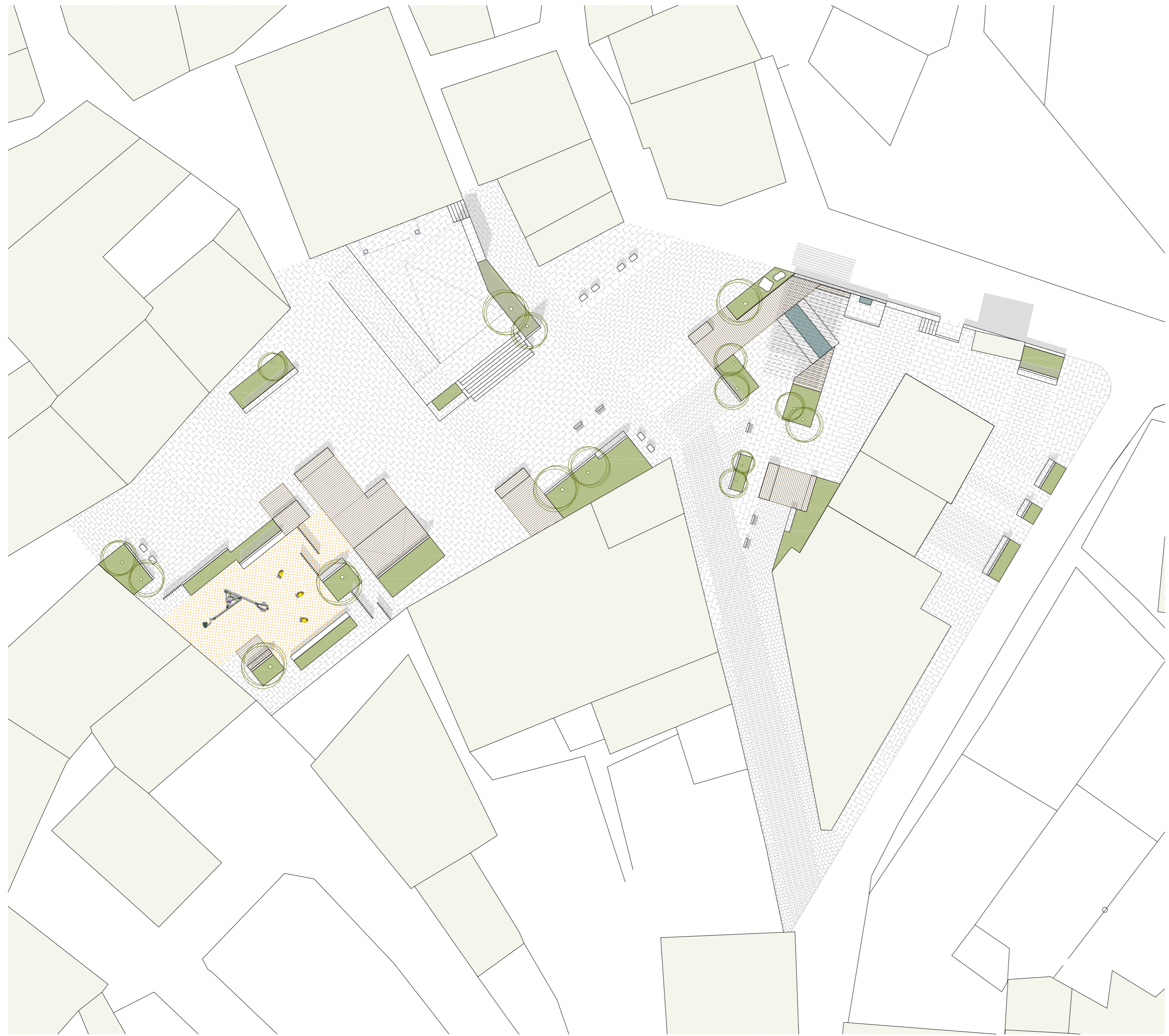
planta general 1:250