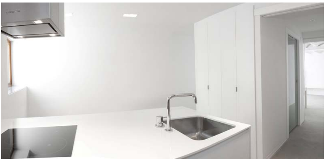
Zona día: cocina.

Las circulaciones son de vital importancia, ya que se ha sustituido el anterior acceso desde la calle directamente al interior de la vivienda con su correspondiente recibidor, por un acceso único desde el patio, convirtiéndose este en el nuevo recibidor. Desde el salón podemos contemplar el patio en su totalidad a través de una cristallera practicable de casi 6m. Se ha diluido el límite dentro-fuera con la intención de que el patio se convierta en una prolongación natural del salón.