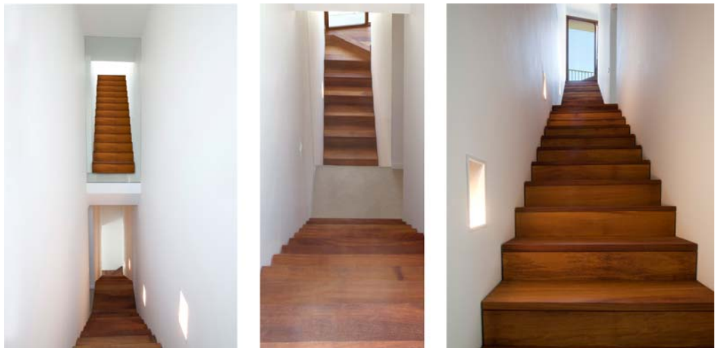
Escalera: visiones cruzadas.

Todas las comunicaciones verticales se disponen en la zona de la medianera con la vivienda contigua ya que es la que menores condiciones de iluminación y ventilación dispone. Debido a las reducidas dimensiones de los espacios, la escalera que une la zona de día con las de noche, ocupa toda la longitud de la vivienda y se ilumina a través de un ventanal situado en la segunda planta, con lo que se produce un cierto cambio de escala respecto al resto de espacios. Digamos que un elemento accesorio como suele ser una escalera, aquí cobra una importancia especial ya que visualmente nos relaciona todos los niveles de la vivienda.