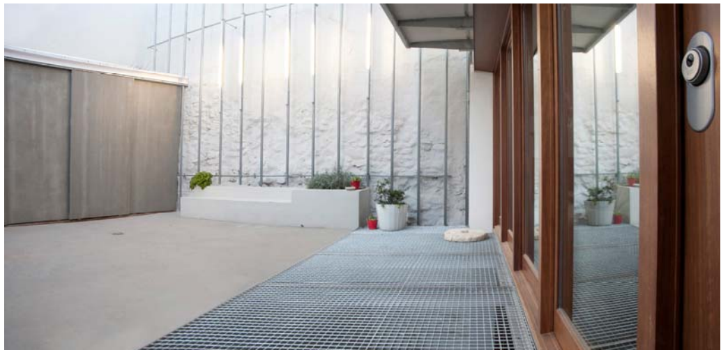
Patio de acceso: salón exterior.

Materialización Desde el principio se tuvo muy claro que a pesar de que el grado de rehabilitación de la vivienda era ciertamente importante, se intentaría mantener el espíritu de las edificaciones que conforman la trama urbana del casco antiguo. De esta forma trabajamos con elementos propios de esas técnicas constructivas, como el característico alero tradicional a base de hiladas de ladrillo o una composición de fachadas sobria y sosegada. El mismo criterio se siguió a la hora de escoger los materiales empleando el mortero de cal para la fachada, carpinterías de madera de iroko y canalones y bajantes vistas de zinc. Al exterior el resultado es el de una vivienda que parece que siempre estuvo allí y que tampoco renuncia a cierta contemporaneidad, principalmente por la composición de fachadas que sigue un gradiente de abstracción exterior-interior.