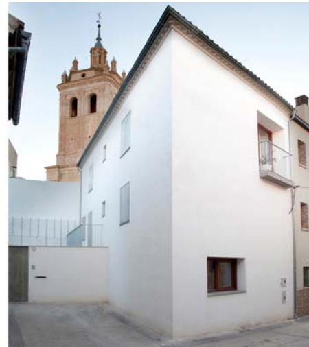
Estado original e intervención.

Estrategia En primer lugar, y con el fin de dignificar la esquina en la que se encuentra la vivienda, se completó el volumen que genera nuestra vivienda con la anexa, para que de esta forma, pueda entenderse más fácilmente la continuidad de la trama urbana tan característica de los cascos históricos, evitando así la aparición de aleros desalineados o tijeras en las medianeras. Se tuvo en cuenta, además, la visión de la torre de la iglesia, que en ese punto cobra especial importancia y de alguna manera, se intentó incorporar a la composición como un elemento más.