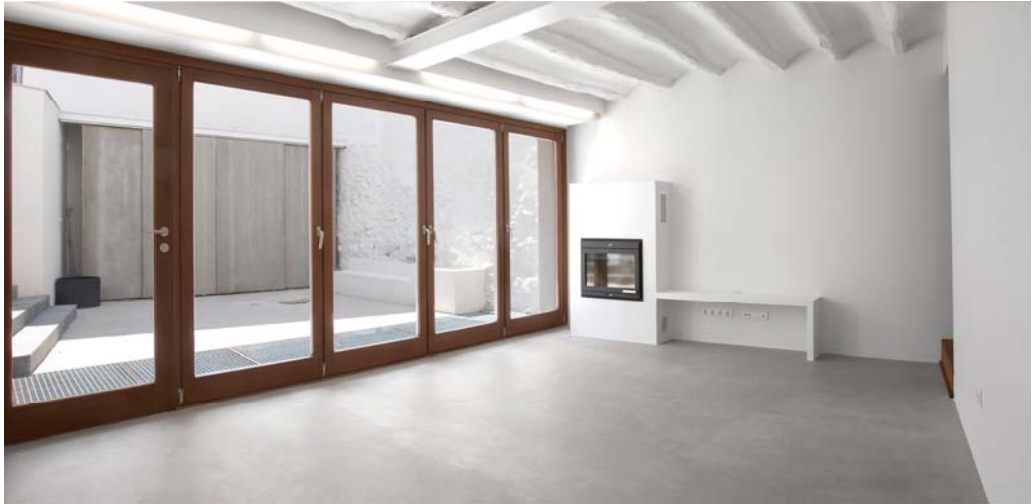
Salón interior: relación con el patio de acceso.

Los requerimientos programáticos han condicionado enormemente la disposición espacial en el interior ya que los nuevos propietarios son una familia con tres hijos. Así, la planta baja es la que cumple con las funciones de día (cocina y salón principalmente), las dos plantas superiores albergan dormitorios y baño y en el sótano que corresponde aproximadamente a la mitad de una planta, se sitúan servicios como el cuarto de lavado, instalaciones y una pequeña sala polivalente, un patio inglés dota de iluminación y ventilación a este espacio.